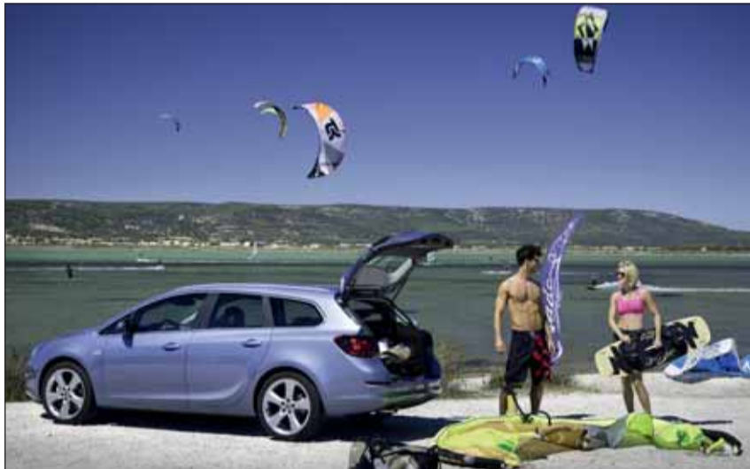
Starke Belastung: In die Ferien muss auch die Sportausrüstung mit.

In vielen deutschen und italienischen Innenstädten wird eine Umweltplakette verlangt. Die kann vorher beim TCS bezogen werden, wenn der Fahrzeugausweis vorgelegt wird. Einige Länder verlangen gar, dass ein Satz Glühlampen mitgeführt wird. Die Fahrzeugversicherung (Haftpflicht) gilt normalerweise für Europa und Nordafrika. Eine zusätzliche Pannerversicherung ist in der Regel nicht nötig, da diese meist in der Haftpflichtversicherung, der Mitgliedschaft in einem Autoclub (TCS) oder in der Mobilitätsgarantie des Importeurs eingeschlossen ist. Im Portemonnaie sollten neben dem Führerausweis auch die Karte der Krankenversicherung, die Identitätskarte, die Kreditkarte sowie ein paar Euroscheine (oder Fremdwährung) bereit sein. RHO