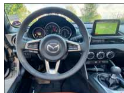
Geborgen: Der MX-5 ist ein echter Strassenfeger für Enthusiasten.

Die 184-PS-Version ist ein Spassmacher erster Güte. Das knackige Sechsganggetriebe passt wie angegossen. Wer einmal in den eng umschliessenden Sitzen Platz genommen hat, möchte kaum mehr aussteigen. Zum einen, weil der MX-5 auf der Passstrasse, wie auf kurvenreichen Überlandpassagen einen unvergleichlichen Spass bereitet, zum andern, weil das Aussteigen einige Akrobatik erfordert. Die Technik scheint unverwundlich (was soll denn da kaputt gehen?), der Genuss ist total und der Preis stimmt. Flink und klein, so muss es sein. RHO