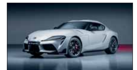
Für Fahrpuristen: Den Toyota Supra GR gibt es nun auch mit Schaltbox.

Ab sofort ist das Sportcoupé Toyota GR Supra auch mit inteligenem 6-Gang-Schaltgetriebe zu haben. Damit profitiert der bis zu 340 PS starke Zweiflügel von modernster Schalttechnik. Nun sind alle GR-Modelle auch mit Schaltgetriebe zu haben, denn der GR Yaris hat es serienmässig, der GR ebenfalls 86 als Option.