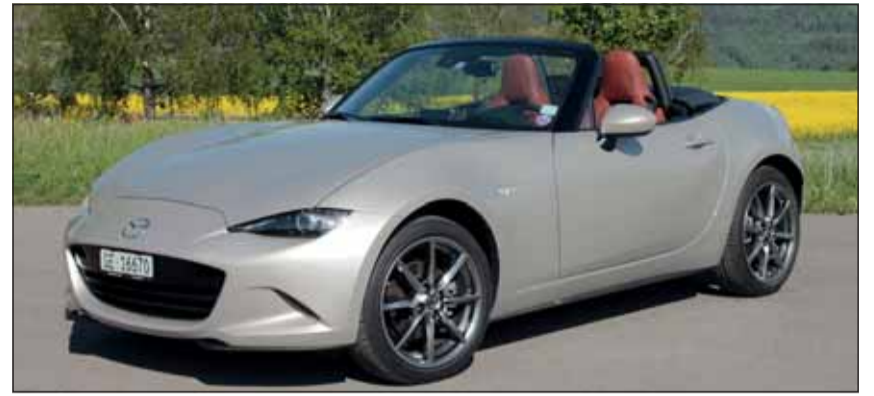
Zeitlos: Als Roadster hat der Mazda MX-5 nach wie vor eine Zukunft. RHO