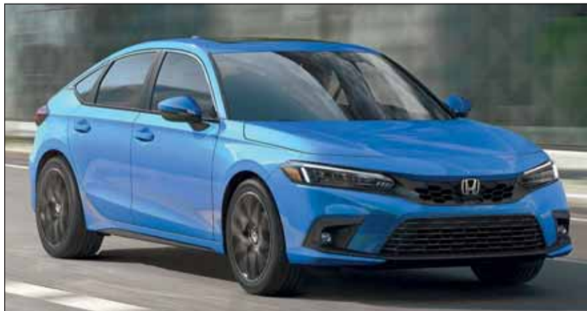
Flacher und schlichter: Der neue Honda Civic gefällt auf Anhieb.

Dem neuen Civic steht vorerst bloss eine Antriebsversion zur Verfügung. Das Hybridaggregat aus dem HR-V leistet 184 PS. Der Zweitliter Benziner treibt die Vorderräder allerdings meist nicht direkt an, er lädt den 72-Zellen-Akku, damit für den Elektromotor immer genügend Strom bereitsteht. Später soll noch die beliebten R-Type-Version dazukommen, welche die sportlichen Fahrer zufrieden stellen wird. Wenn die Civic-Lieferungen beginnen, wird auch der Preis bekannt sein. RHO