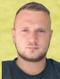
Jankovic Savo Industrie- und Unterlagsbodenbauer EFZ