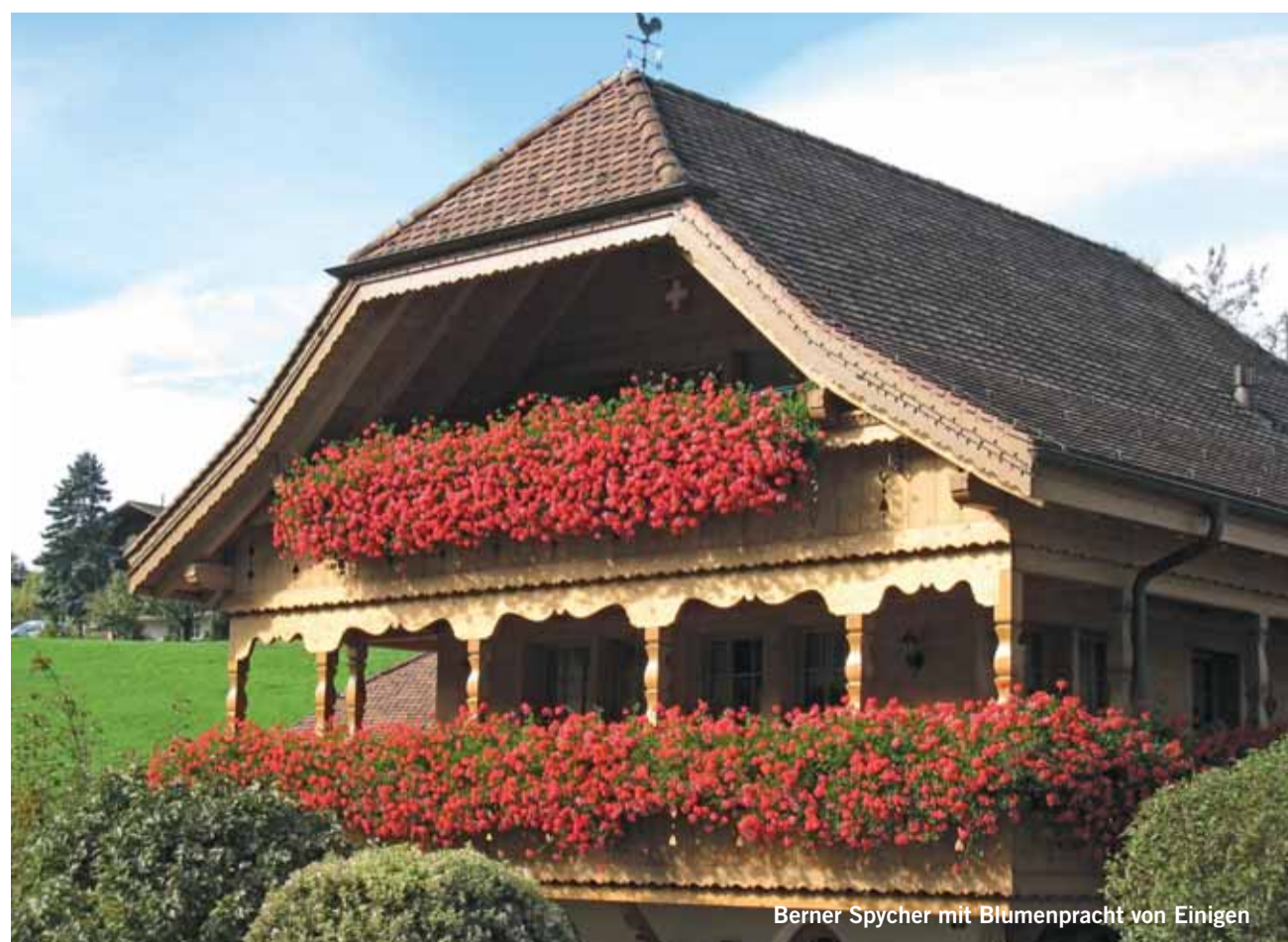
Berner Spycher mit Blumenpracht von Einigen

Jedes publizierte Bild wird mit einem Einkaufsgutschein von Coop im Wert von Fr. 30.00 belohnt. Senden Sie Ihr Bild in genügender Auflösung an anzeiger@ilg.ch oder Simmentaler Anzeiger, Herrenmattstr. 37, 3752 Wimmis. Bitte mit Absender und kurzer Legende. Es wird keine Korrespondenz geführt.