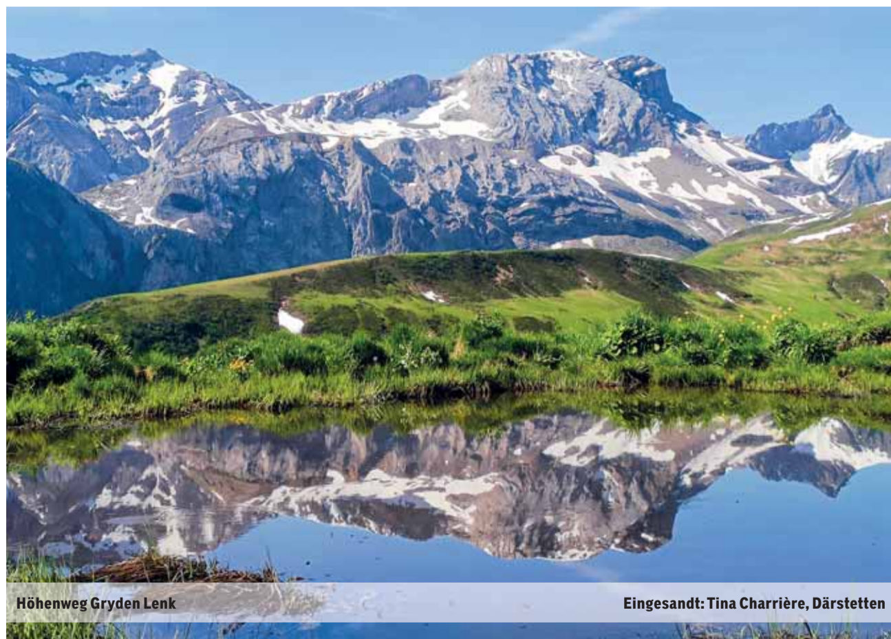
Höhenweg Gryden Lenk