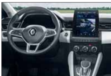
Modernster Zuschnitt: Der Captur macht auch innen Freude.

die Fahrt in den Urlaub ohne Bedenken bezüglich Reichweite geniessen. Mit der E-TECH Plug-in Hybrid Motorisierung (1,6 l-Vierzylinder mit 160 PS und der höheren Kapazität der Batterie (9,8 kWh, 400 V bei 105 kg Batteriegewicht) erreicht er im elektrischen Fahrbetrieb eine Reichweite bis 50 Kilometer. Im städtischen Verkehr liegt die rein elektrische Reichweite bei 65 km. Die Beschleunigung ist gut, der Fahrkomfort auch. Weil der Captur etwas höher auf den Rädern steht, schätzen ihn vor allem weniger gelenkige Personen. Nach 3 bis 5 Stunden an einer Stromquelle ist der Captur wieder voll geladen und einsatzfähig. RHO