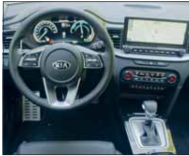
Modernster Zuschnitt: Der Kia Ceed SW bietet hohen Nutzwert

Platz ohne dass der Nutzwert eingeschränkt wird. Als Antriebe besitzt der Ceed SW PHEV einen 1,6 Liter Benziner mit 105 PS und 147 Newtonmeter Drehmoment sowie einen 44,5 KW (entspricht 60 PS) starken Elektromotor mit 170 Nm Drehmoment. Die Lithium-Ionen-Polymer-Batterie ist 117 Kilo schwer. Sie leistet 360 Volt und 24,7 Amperestunden und liefert 8,9 Kilowattstunden (kWh). Daraus resultiert eine Systemleistung von 161 PS, das Gesamtdreh-