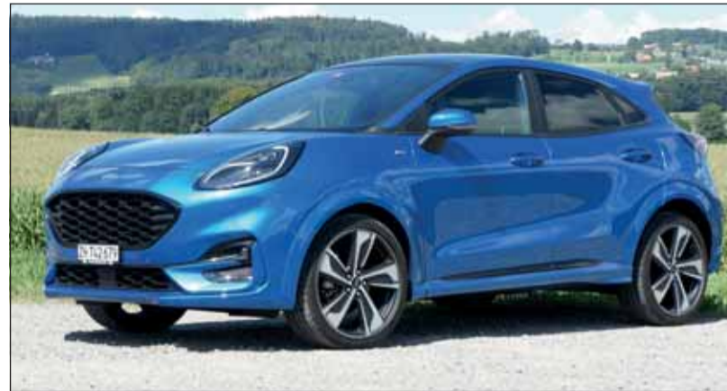
Ford Puma: Kleiner aber zeitgemässer Crossover für die ganze Familie. cj