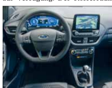
Gut gelöst: Das digitale Cockpit im Puma ist einfach bedienbar.

die Fahrt in den Urlaub ohne Bedenken bezüglich Reichweite geniessen. Mit der E-TECH Plug-in Hybrid Motorisierung (1,6 l-Vierzylinder mit 160 PS und der höheren Kapazität der Batterie (9,8 kWh, 400 V bei 105 kg Batteriegewicht) erreicht er im elektrischen Fahrbetrieb eine Reichweite bis 50 Kilometer. Im städtischen Verkehr liegt die rein elektrische Reichweite bei 65 km. Die Beschleunigung ist gut, der Fahrkomfort auch. Weil der Captur etwas höher auf den Rädern steht, schätzen ihn vor allem weniger gelenkige Personen. Nach 3 bis 5 Stunden an einer Stromquelle ist der Captur wieder voll geladen und einsatzfähig. RHO