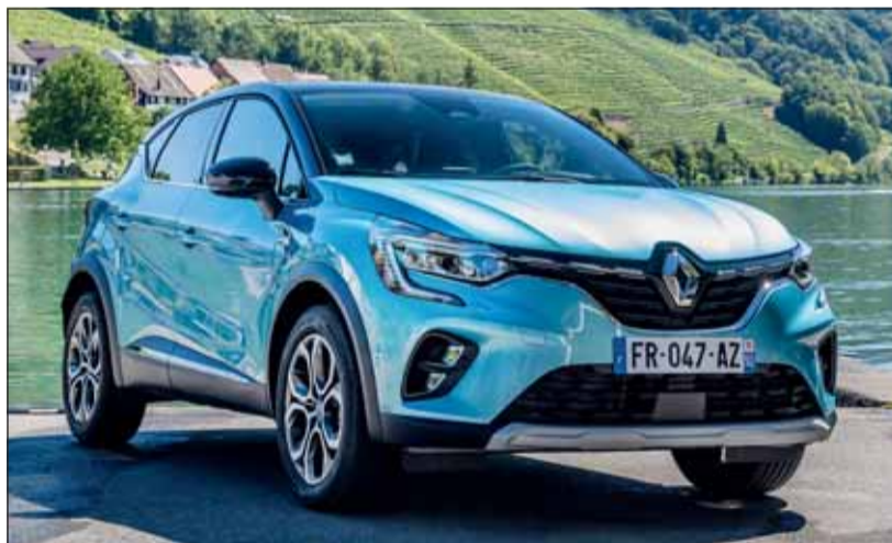
E-Tech Hybrid: Der Renault Captur kommt mit Elektro-Technik. Renault

Im Fahralltag bietet der Captur E-Tech eine ausserordentliche Vielseitigkeit: Während die täglichen Fahrten im rein elektrischen Fahrmodus absolviert werden, lassen sich längere Reisen oder