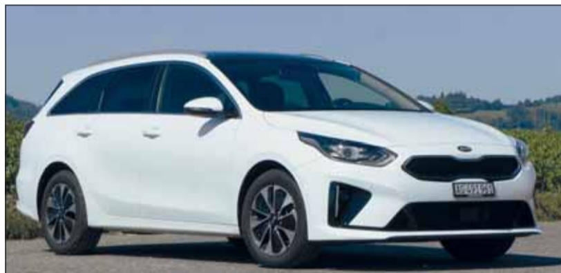
Eleganter Kombi: Der Ceed hat eine beeindruckende Ausstrahlung . cj

Alles was eine Reise angenehm macht ist beim Ceed SW Hybrid mit an Bord: Kühl- und heizbare Sitze vorn, Tempomat mit Abstandhalter, Notbremsassistent und vieles mehr. Der 4,6 Meter lange Ceed SW ist für Fr. 40'900.- zu haben. Das Panoramaglas-Schiebedach kostet 1500, das Style-Plus-Paket 2000 Franken. RHO