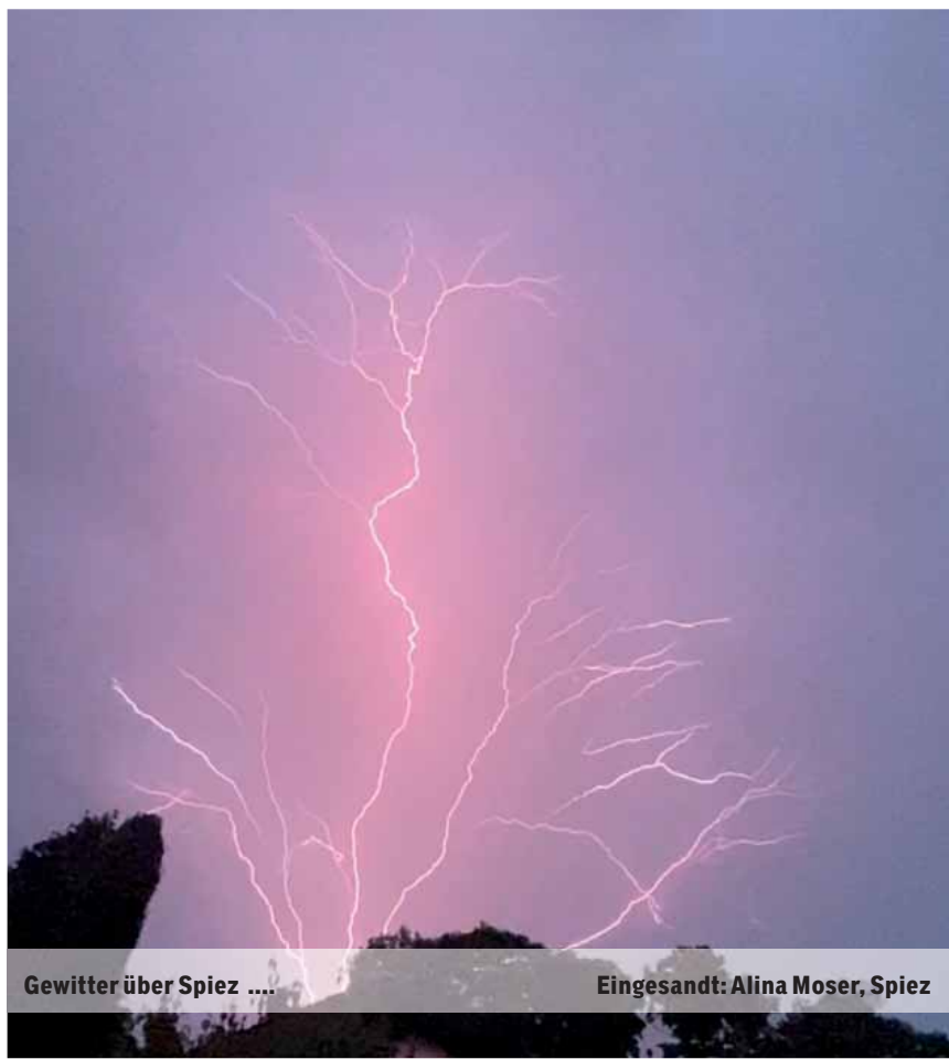
Gewitter über Spiez .... Eingesandt: Alina Moser, Spiez

Senden Sie uns ein schönes, originelles oder lustiges Bild und wir belohnen Sie mit einem Einkaufsgutschein von Coop im Wert von Fr. 30.–. Senden Sie das Bild in genügender Auflösung an anzeiger@ilg.ch oder Simmentaler Anzeiger, Herrenmattestr. 37, 3752 Wimmis. Bitte mit Absender und kurzer Legende. Es wird keine Korrespondenz geführt.