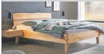
z.B. 180x200 cm 1'789.-