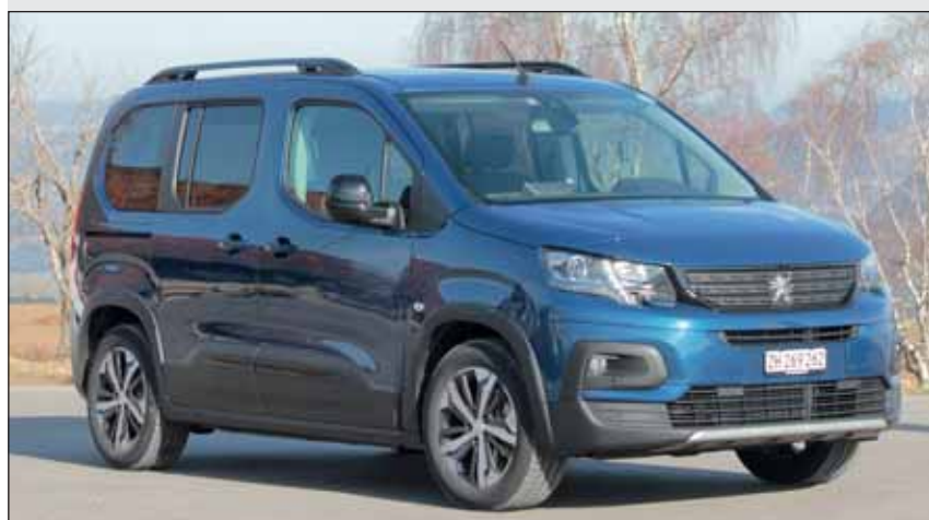
Plauschauto: Die ganze Familie profitiert vom neuen Stromer. RHO

Als zeitgerechter Stromer mit 100 kW-Motorleistung hat der elektrische Rifter eine gute Zukunft. Das kompakte Fahrzeug ist überaus beweglich in urbaner Umgebung und maximal 130 km/h schnell. Längere Ausfahrten müssen gut geplant werden, weil der Berlingo alle 180 bis 200 Kilometer an die Stromtankstelle muss. Die Reichweite hängt dabei von zahlreichen Faktoren ab, die teilweise von Fahrer nicht beeinflusst werden können (Aussentemperatur, Strassenprofil). Auch in beladenem Zustand überfährt er Bodenwellen sanft. Zudem lässt er sich wegen dem tiefen Schwerpunkt zügig durch Kurven bewegen. Ein modernes Konzept mit vielen Vorteilen.