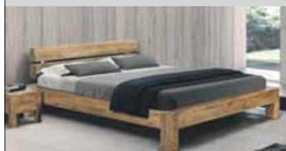
z.B. 180x200 cm 1'559.-