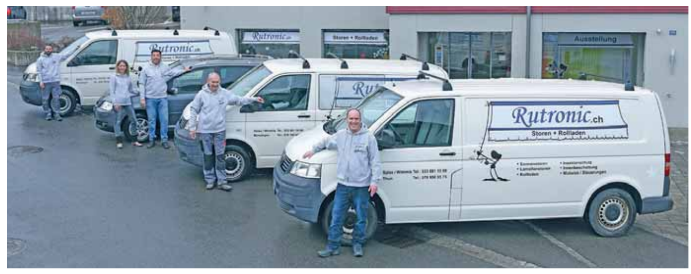
Das Team von «Rutronic Storen und Sonnenschutz» ist auf textile Beschattungen und Storensysteme aller Art spezialisiert.

Rutronic Storen und Sonnenschutz feiert 20-jähriges Firmenjubiläum