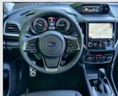
Saubere Sache: Die Bedienung des Forester ist sehr übersichtlich.

Angetrieben wird der Forester von einem Vierzylinder-Boxer, welcher von einer E-Maschine unterstützt wird. Die kombinierte Antriebskraft wird durch ein CVT-Getriebe mit 7 Gangstufen an alle vier Räder abgegeben. Der Wechsel zwischen den beiden Aggregaten, das Rekuperieren und auch das Boosten funktionieren unmerklich. Subaru hat dem Forester ein ausgewogenes Fahrwerk spendiert, welches sich elektronisch an den Untergrund anpassen lässt. Viel Platz und hohe Zuverlässigkeit sind vereint.