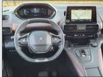
Typisch Peugeot: Die Anzeigen befinden sich über dem Lenkrad.

ches Ambiente bereit, um alle die mitwollen aufzunehmen. Der Fahrer hat digitale Anzeigen vor sich die sich über dem Lenkred befinden. Auf dem grossen Mittelmonitor lassen sich neben der Navigation zahlreiche Funktionen anzeigen und verändern. Die meisten aktuellen Komfort- und Sicherheitsassistenten sind bereits in der Basisversion mit dabei. Auffallend sind die vielen praktischen Ablagen, die im ganzen Innenraum verteilt sind. Der variable Kofferraum lässt sich durch die grosse Heckklappe mit 641 bis 2126 Liter Ladegut vollstopfen.