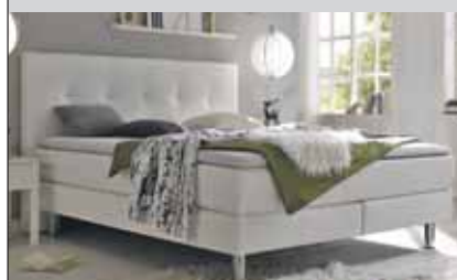
z.B. 160x200 cm 1'745.-