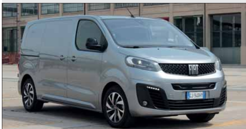
Profitiert von Zusammenarbeit: Der neue Fiat e-Scudo vor Lingotto RHO

langem Radstand. Lautlos und ohne Emissionen schafft er problemlos Steigungen, umrundet Kurven wie auf Schienen und beschleunigt nach einem Ampelhalt so zügig, dass andere das Nachsehen haben. Beim Hinunterfahren und Bremsen rekuperiert das System und produziert Strom.