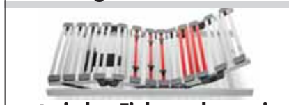
motorischer Einlegerahmen, in Ihr Bett einbaubar 1'699.-