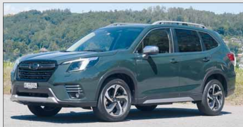
Aufgefrischt: Der aktuelle Subaru Forester AWD gibt richtig was her. cj