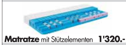
Matratze mit Stützelementen 1'320.-