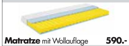
Matratze mit Wollauflage 590.-