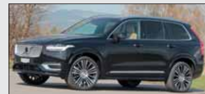
Fahrende Lounge: Das Volvo-Flaggschiff wirkt für alle einladend.

Seit 2002 ist das grosse Volvo-SUV der Masstab für Sicherheit und Komfort. Mit nachladbarem Hybridsystem ist er zudem stark und schnell. Im T8 Recharge arbeiten ein Turbobenziner (223 kW) vorne und ein 65 kW starker Elektromotor hinten zusammen. Der 7-Plätzer verwöhnt mit grosszügigen Platzverhältnissen, und vollendeter Verarbeitung.