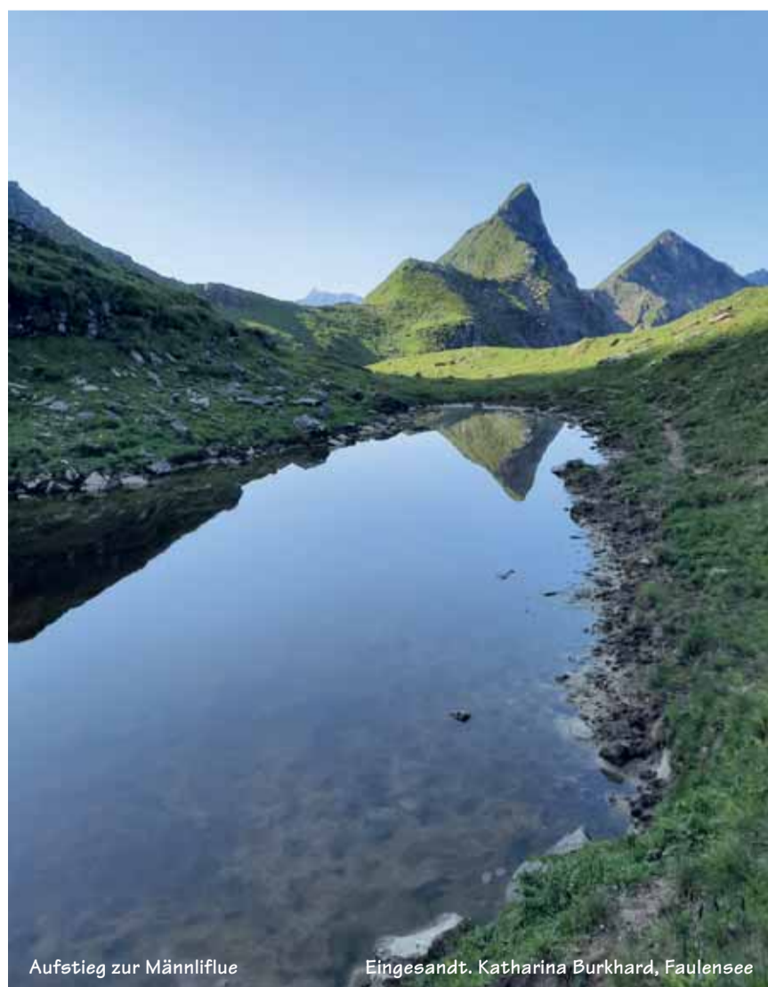
Aufstieg zur Männliflue