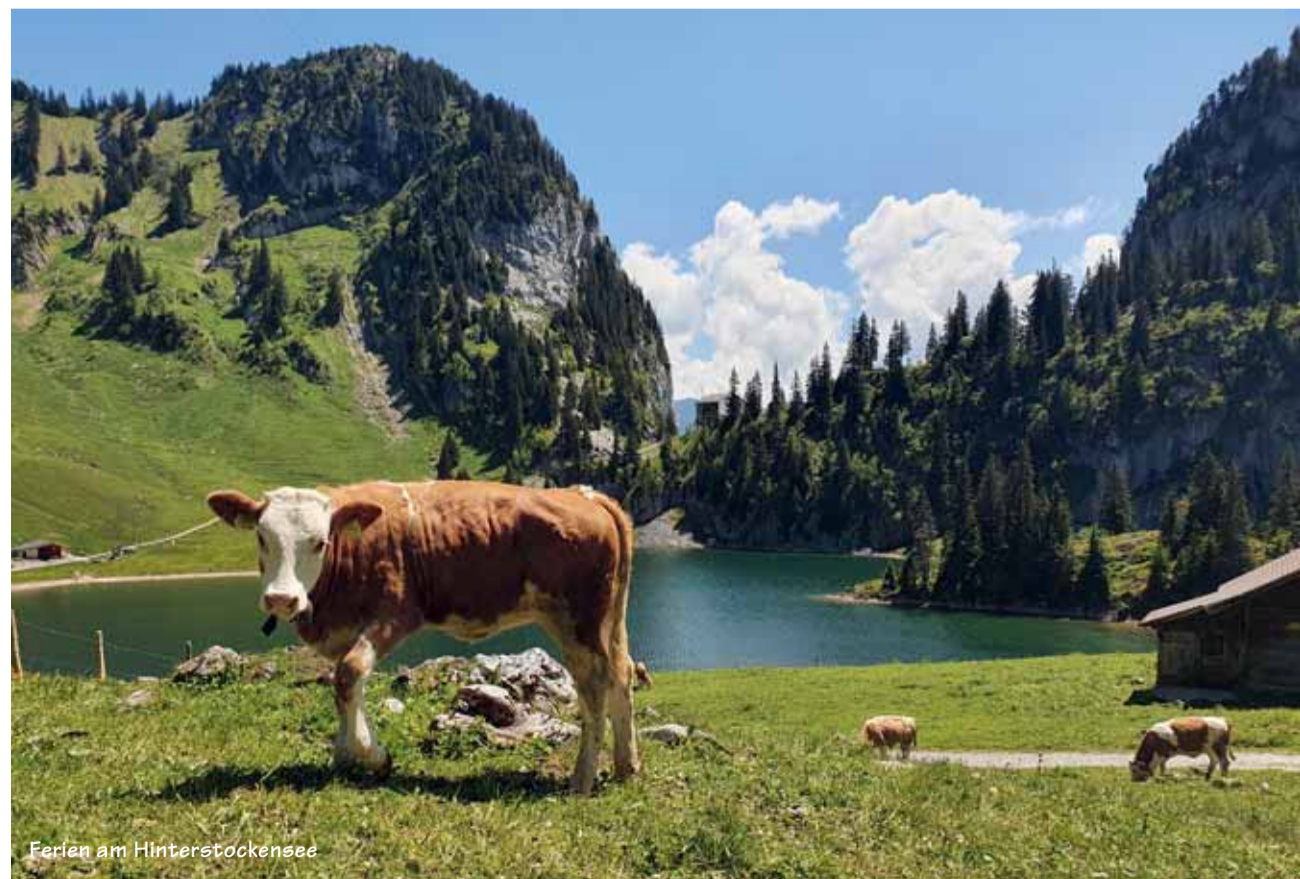
Ferien am Hinterstockensee