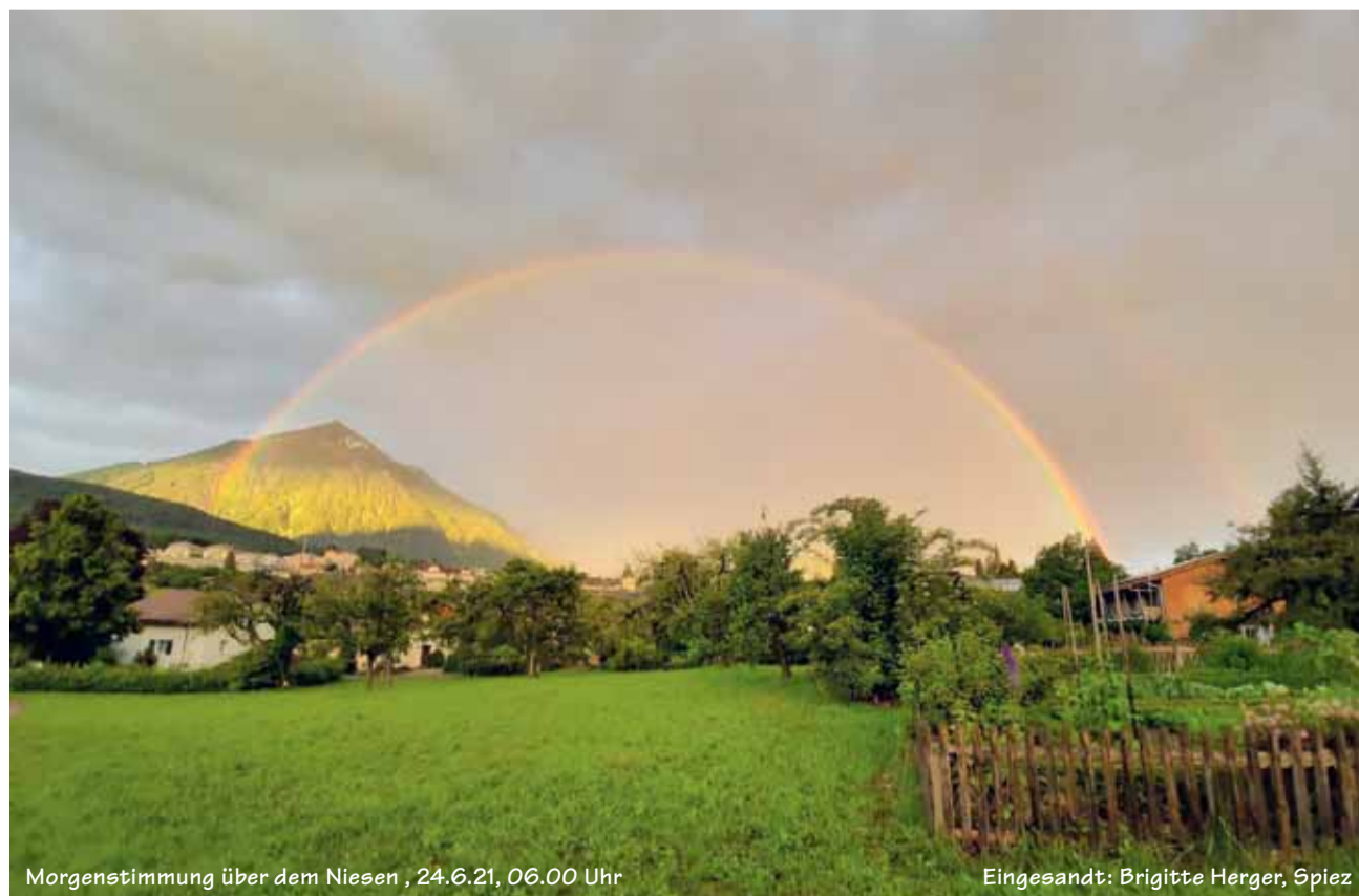
Morgenstimmung über dem Niesen, 24.6.21, 06.00 Uhr