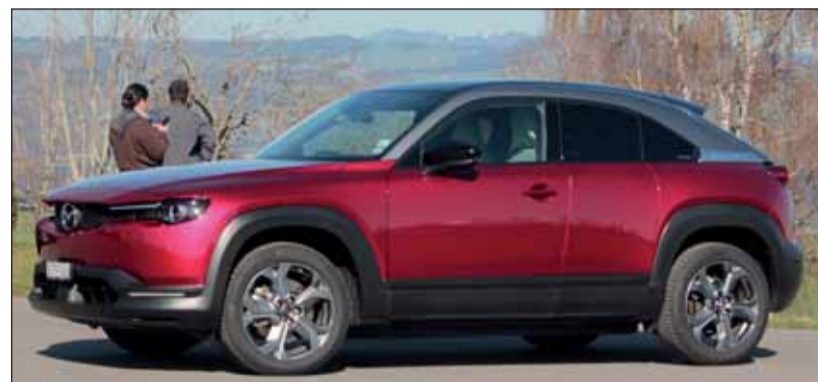
Mazda MX-30: Moderner Crossover-Sedan für die ganze Familie. RHO