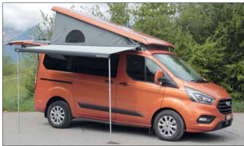
Camper: Der Nugget reist mit vielen Vorteilen und fünf Personen. RHO

Der kraftvolle Motor macht aus dem Nugget einen Kombiwagen, der überall mithält und durch sein kultiviertes Fahrwerk auffällt. Schade, dass er nicht mit dem Hybrid-Triebsatz kombiniert werden kann. In viele Tiefgaragen (Höhe 2,07 m) passt er sogar problemlos hinein. Ob grosse Reise oder kurzer Wohnungsersatz, der Ford Transit Nugget überrascht immer wieder mit seiner durchdachten und praktischen Ausstattung für moderne Nomaden.