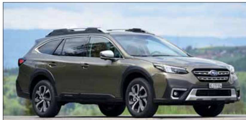
Robuster Auftritt: Die 6. Generation des Subaru Outback ist nun da.

Der symmetrische Allradantrieb ist bekannt, auch der 2,5 Liter grosse Boxer-Vierzylinder. Neu sind die Direkteinspritzung sowie die Weiterentwicklung fast aller Bauteile. Zudem wurde die Spreizung des Getriebes erweitert sowie erhebliche Gewichtseinsparungen erzielt. Verbessert wurde zudem der X-Mode für mehr Grip abseits der Strasse, steile Bergabfahrten und Anhängerbetrieb. Nach wie vor ist der Outback ein Alleskönner, dem keine Reise zu abenteuerlich ist. Die Preise für den neuen Outback liegen zwischen Fr. 43'900.– und Fr. 49'900.–.