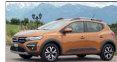
Dacia Sandero Stepway.

Neuaufgabe: Dacia Sandero Vollständig neu entwickelt hat Dacia den Bestseller Sandero und mit ihm die Crossover-Version Stepway. Zur neuen Generation gehört die elegant daher kommende Aussenhaut. Der Dreizylinder geht munter zur Sache und gibt seine Kraft an das butterweich zu schaltende 6-Ganggetriebe (alternativ: CVT-Automatik) weiter. Gut gemacht.