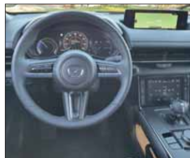
Korkeinlagen: Im mehrheitlich schwarzen Innern hellt Kork auf.

In der gefahrenen Lancierungsversion liegt die Reichweite durch die 35,5 kWh-Batterie bei rund 200 km. Das ist für Reisefreudige natürlich zu wenig. Unter der Motorhaube benötigt der Synchronmotor aber längst nicht allen Platz. Da plant Mazda auf Wunsch einen Wankelmotor als Stromhersteller einzubauen, so dass die Reichweite nach Belieben vergrössert werden kann. Die Fahrleistungen und -eigenschaften sind auf hohem Niveau. Ein typischer Mazda, anders als die andern und mit hohem Wohlfühlfaktor ausgestattet. RHO