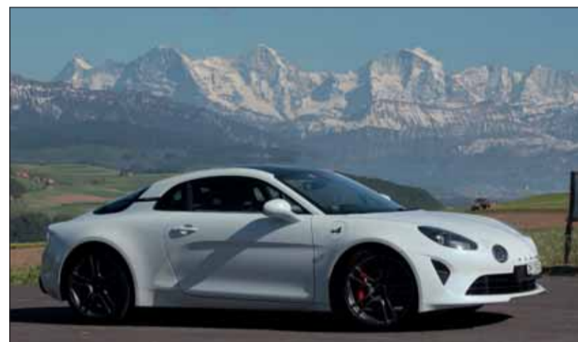
Rassenrein: Die Alpine A110 S ist schön, schnell und echt sportlich.

Im Normalfall genügt die Leistung des 292 PS starken Turbomotors ohne weiteres. Aber es ist erlaubt, den Sportknopf im Lenkrad zu drücken und dem quer hinter den Sitzen installierten Vierzylinder die optimale Leistung abzufordern. Diese Art wird natürlich vor allem auf abgesperrter Piste eingestellt. Sie ist begleitet von einem betörenden Geräusch, das beim Gaswegnehmen in ein fröhliches Klappern übergeht. Das 7-Gang-Doppelkupplungsgetriebe funktioniert so oder so fabelhaft, vor allem, wenn die Gänge über die Schaltwippen abgerufen werden. Die beiden grossen Rundanzeigen (rot hinterlegt im Sportmodus) werden zu Ovalen, sobald der Rückwärtsgang eingelegt wird. Zwischen ihnen erscheint das Kamerabild. In jedem Fall ist die Alpine S ein rassenreiner Sportwagen, der höchste Ansprüche, auch in Bezug auf den Komfort und die Sicherheit erfüllt. Viel Leistung und ein überwältigendes Fahrwerk, das ist die Alpine A110 S. Den 260 km/h schnellen Zweiplätzer gibt es bereits ab Fr. 74'800.-.