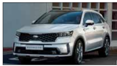
Kia Sorento: Die neue Generation.

Die vierte Generation des Flaggschiff-SUV von Kia wurde so konzipiert und konstruiert, dass sie alles mitmacht, was das Leben zu bieten hat. Mit einem geräumigen Platzangebot setzt er hinsichtlich seiner Funktionalität neue Massstäbe. Mit dem neuen Modell hält zudem erstmals auch die Hybridisierung Einzug ins Sorento-Lineup