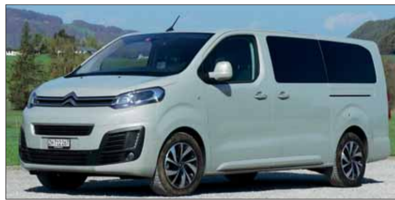
Raumschiff: Gute Zugänglichkeit und hoher Kofort im SpaceTourer.