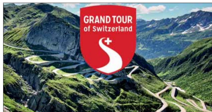
Tremola: Die alte Gotthardpassstrasse auf der Südseite ist spannend.

War die Familie schon einmal am Schwarzsee oder auf dem Col de la Croix? Oder auf der Schwägalp (mit Seilbahn auf den Säntis) oder im Jura? Dann könnten dies lohnende Ziele sein, den überall gibt es Pensionen und Hotels, die Kunden gerne empfangen. Den Ideen sind praktisch keine Grenzen gesetzt, um in der Schweiz zu verweilen und sich für ein paar Tage zu entspannen. Denn es gibt so viel zu entdecken, das den meisten Menschen verborgen bleibt, wenn sie auf der Autobahn vorbeirauschen. Für sämtliche Vorlieben hält die Schweiz zahlreiche Angebote bereit, sie müssen nur gesucht und gefunden werden.