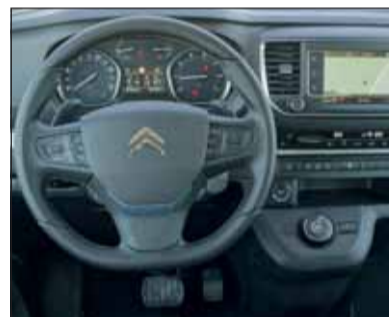
Übersichtlich: An die Bedienung im Jumpy gewöhnt man sich rasch.

Unglaublich, wie der Jumpy auch beladen zügig Fahrt aufnimmt und im Verkehr mitkommt. Verantwortlich sind dafür der grossvolumige Sauber-Diesel und der ausgezeichnete Getriebeautomat, beide harmonieren ausserordentlich gut zusammen. Die Servolenkung ist überaus präzise und die Bremsen hoher Belastung gewachsen. Die Fahrt kann natürlich durch vorausschauende Fahrweise noch angenehmer gestaltet werden, dies kommt zudem dem Verbrauch zugute. Wer die eingebaute Gripcontrol einem Allradantrieb vorzieht, kann auch das haben. Wir empfehlen den Jumpy SpaceTourer jedoch in der Werksausführung, die genügt.