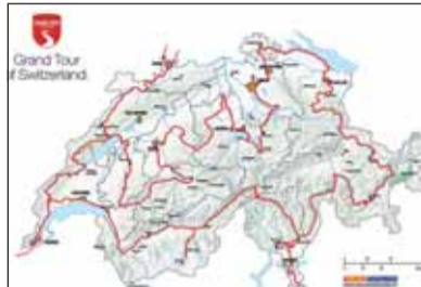
Neue Ziele: Die Grand Tour in der Schweiz birgt viel Sehenswertes.

Kinder spannend sein, selbst Wünsche einzubringen. So kann die ganze Familie bei der Planung teilnehmen. Die Grand Tour bietet etappenweise Fahrten durch landschaftlich reizvolle Gegenden vom Jura bis in den Tessin. Die ausgeschilderte ganze Tour ist rund 1600 Kilometer lang und führt an 22 Seen entlang und über viele Hochalpenpässe. Natürlich kann individuell von der ausgeschilderten Route abgewichen werden. Etwa zum Besuch von Verwandten oder Freunden, die sich freuen würden.