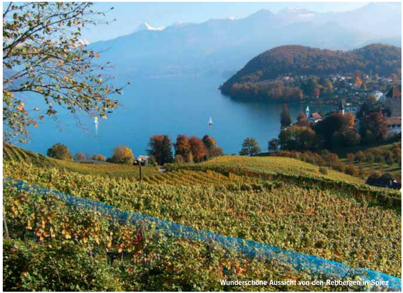
Wunderschöne Aussicht von den Rebbergen in Spiez

Jedes publizierte Bild wird mit einem Einkaufsgutschein von Coop im Wert von Fr. 30.00 belohnt. Senden Sie Ihr Bild in genügender Auflösung an anzeiger@ilg.ch oder Simmentaler Anzeiger, Herrenmattestr. 37, 3752 Wimmis. Bitte mit Absender und kurzer Legende. Es wird keine Korrespondenz geführt.