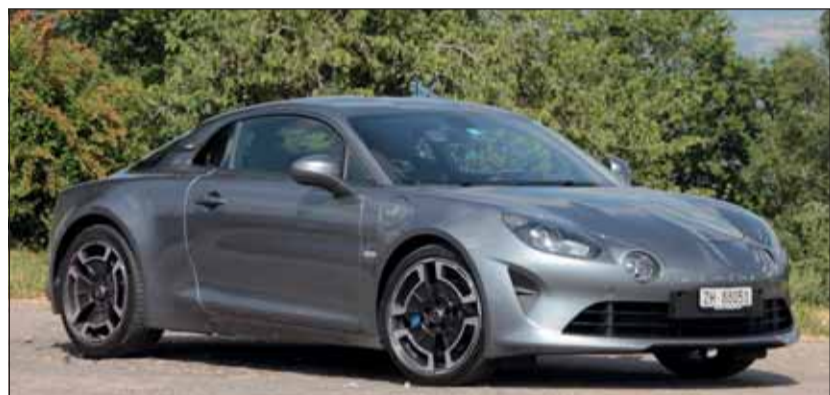
Dynamisch: Der Alpine A110 ist ein durchgestylter Mittelmotorsportler. RHO

Rennerfahrung immer mit dabei Ohne vom Gas zu gehen die sieben Gänge mit den Schaltwippen zu sortieren, ist eine wahre Freude. Dabei beschleunigt der A 110 enorm, der 1,8-Litermotor dreht hoch – immer wieder auf fast 7000 Touren. Die Turbomaschine setzt dabei 252 PS und ein Drehmoment von 320 Newtonmeter frei. Natürlich macht es nur Sinn, den Launch-Start bloss auf abgesperrter Piste zu aktivieren. Aber auch auf der (Pass-)Strasse bereitet der Légende viel Spass, denn er fährt wie auf Schienen und es kommt nie das Gefühl auf, er habe zu wenig Kraft oder ungenügende Bremsen. Auf der Autobahn ist die 4,18 Meter lange Flunder bis zu 250 km/h schnell und auf 100 km/h beschleunigt sie in 4,5 Sekunden. Unterwegs bleibt der hinter den Sitzen installierte Motor angenehm leise und das Fahrwerk schluckt Bodenwellen knackig weg. Das stylischste Auto der Schweiz (Publikumswahl) kann ab Fr. 67'300.– beim Renault-Händler gekauft werden – es ist einfach toll.