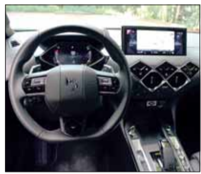
Einzigartig: Der DS3 besitzt Waben auch im Cockpit.