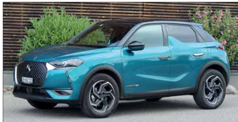
Zweifarbzig: Der DS 3 Crossback ist besonders edel gemacht. RHO