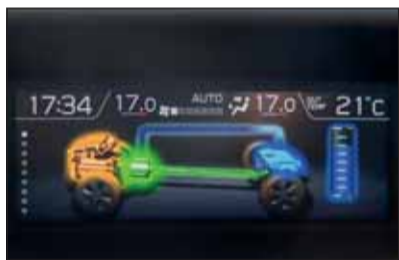
Kraftfluss: Der Monitor zeigt, wie die Komponenten thermisch und elektrisch zusammenarbeiten.

Der optimierte 2.0-Liter-Benzinmotor leistet 150 PS. Er wird von einem 16,7 PS starken Elektromotor unterstützt. Der E-Motor ist in des Lineartronic-Getriebe integriert. Die Lithium-Ionen-Batterie befindet sich symmetrisch angeordnet unter dem Kofferraumboden, ohne den Innenraum zu verkleinern. Der Subaru Forester erscheint im Dezember zudem in einer neuen Optik als gelungene fünfte Generation.