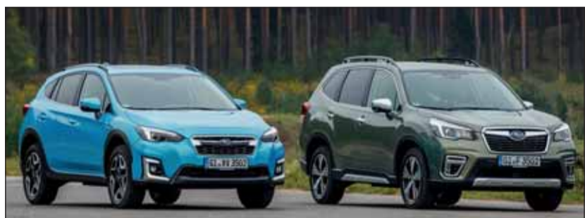
Mild-Hybrid: Subaru XV und Forester 4x4 mit neuem Antriebssystem.

Unter normalen Fahrbedingungen unterstützt der neue E-Motor den Boxermotor und wirkt beim Anfahren wie ein kleiner Turbo. Das funktioniert bis Tempo 40 km/h und bis zu 1,6 Kilometer. Will man rein elektrisch fahren, muss man das Gaspedal aber besonders sanft drücken. Besonders im Stadtverkehr kann das System seine Vorteile ausspielen und beim Spritsparen helfen. Die bekannt guten 4x4-Eigenschaften bleiben voll erhalten. Im Dezember ab Fr. 38'150.– bis 45'500.–. SK