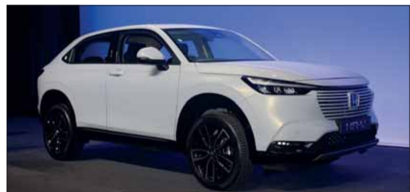
Gestreckt und anders: Das SUV Honda HR-V kommt völlig verändert.