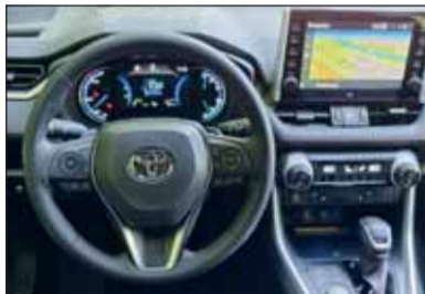
Hochwertig: Der RAV4 PHEV ist ein Eroberertyp mit besten Zutaten.

erst der fahrerseitige Typ-2-Stecker, durch Drücken von Öffnen auf dem Schlüssel, gelöst werden. Anders lässt sich der Ladevorgang an einer Ladesäule ohne Hinweise nicht unterbrechen. Toyota beschreibt das Laden auf 26 Seiten im Manual. Kaum der Rede wert sind die gute Verarbeitung, die feudalen Ledersitze, die Bedienung unterwegs sowie die perfekte Materialwahl und solide Verarbeitung. Die Platinum-Ausstattung lässt keine Wünsche offen; sie steht mit Fr. 65'400.- in der Preisliste.