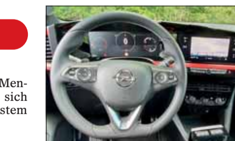
Farbtupfer inklusive: Im neuen Opel Mokka ist es modern und heimelig.

Der 130-PS-Benziner ist eine französische Entwicklung. Das tut dem Mokka aber keinen Abbruch. Im Gegenteil, denn er nimmt agil Fahrt auf. Weil die GS-Line 300 Kilo leichter ist als die Elektroversion, entpuppt er sich im Verkehr als überaus tauglich. Dabei bleibt er immer recht sparsam, nicht zuletzt wegen der Getriebeautomatik. So ist es ein Vergnügen ihn über kurvige Strassen zu bewegen, im Stadtverkehr mitzuschwimmen oder über die Autobahn zu jagen. Der aus jeder Perspektive gefallende Opel dürfte für viele Familien zum Partner werden.