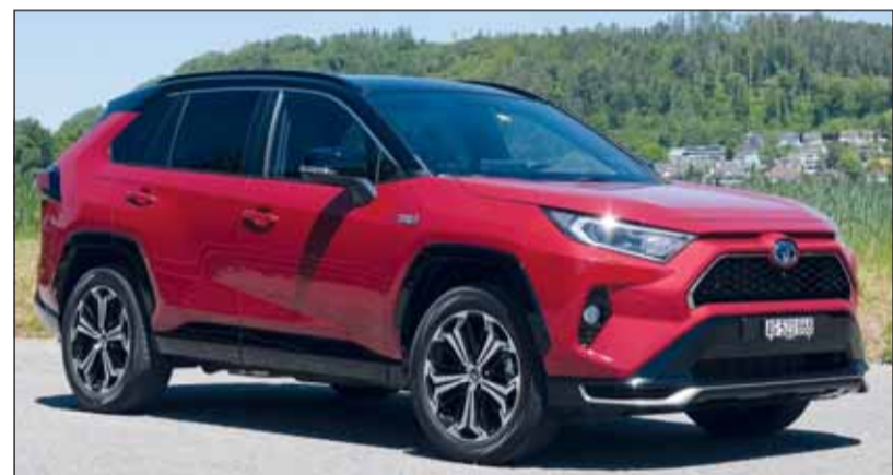
Jüngste Evolution: Der SUV-Pionier mit nachladbarem Hybridantrieb.