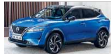
Leichter und vitaler: Die 3. Generation des Qashqai ist nun am Start.

Der 4,43 Meter (+35 mm) lange Nissan Qashqai zeigt sich weltoffen. Den neusten Trends angepasst wurde ebenfalls der Innenraum. Für den Vortrieb stehen zwei elektrifizierte Motoren zur Wahl: ein in zwei Leistungsstufen (140 PS und 158 PS) angebotener 1,3-Liter-Benziner mit Mildhybrid-System und später das erstmals angebotene e-Power System.