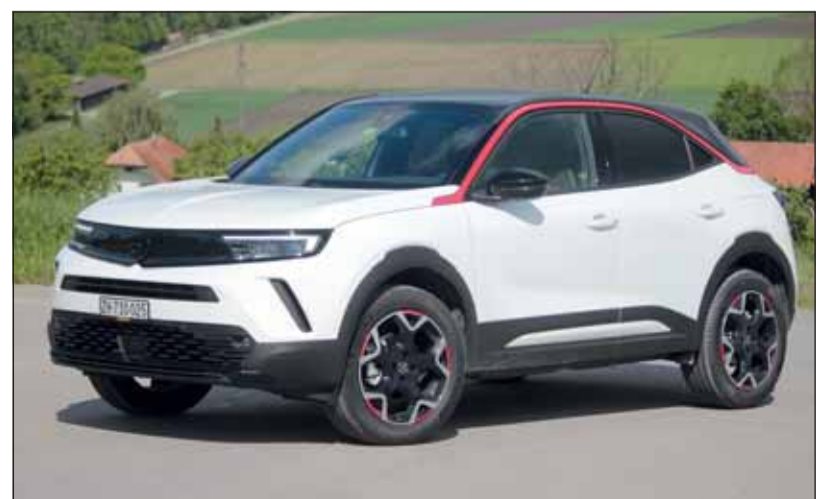
Neue Ära: Opel zeigt mit dem Mokka, wie die Zukunft aussieht.

Der Opel Mokka B hat nichts mehr mit seinem Vorgänger gemein. Er ist ein Multitalent, das mit Traditionen bricht und der Zukunft voraus ist.