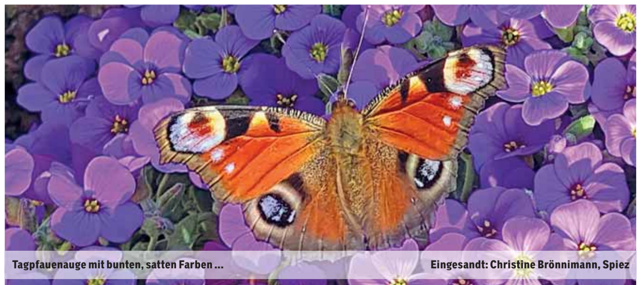
Tagfauenaugen mit bunten, satten Farben ...