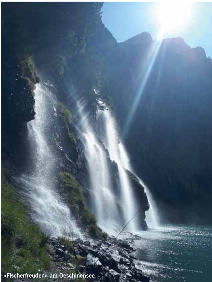
«Fischerfreuden» am Oeschinensee