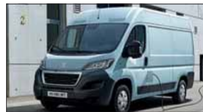
Peugeot e-Boxer: Der elektrische Transporter ist da.

Peugeot e-Boxer: Stadtlieferer Mit dem vollelektrischen Modell e-Boxer behalten Unternehmen den uneingeschränkten Zugang zu Stadtzentren und profitieren von niedrigen Unterhaltskosten. Der Peugeot e-Boxer ist mit zwei Batterievarianten erhältlich, die grössere ermöglicht eine Reichweite von bis zu 340 Kilometern. Der e-Boxer deckt viele Transportbedürfnisse ab.