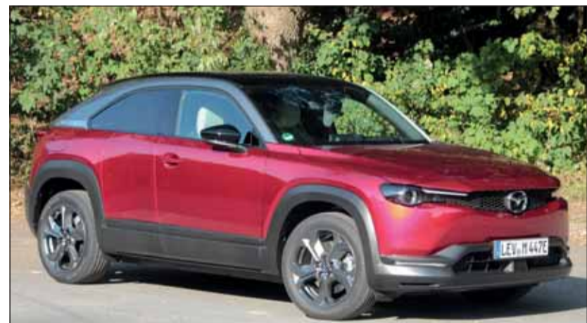
Fällt auf: Der elektrische Mazda MX-30 kommt als Crossover-Sedan. RHo

Unter der Motorhaube des MX-30 benötigt der verbaute Synchronmotor mit 107 kW Leistung (271 Nm Drehmoment) längst nicht allen Platz. Da soll als nächster Schritt ein Wankelmotor als Stromhersteller eingebaut werden, so dass die Reichweite nach Belieben vergrössert werden kann. Die Fahreigenschaften sind typisch: bis 50 km/h raketenmässig, danach sorgt meist der Verkehr für eine gemächlichere Gangart. In fünf Stufen kann die Rekuperation bis zur Einpedalfahrweise der Situation angepasst werden. Gut gelöst. Mit einem Einstiegspreis von 36'990 Franken bietet der MX-30 ein Angebot, das die Mazda-typischen Merkmale hervorhebt und grosse Eigenständigkeit bietet.