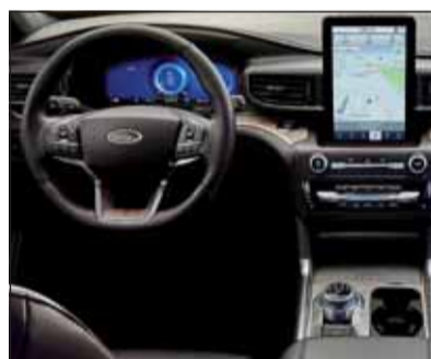
Hochkant: Der Bildschirm dominiert den feudalen Innenraum.

Unter allen Umständen kommt der Explorer mit seinem ladbaren Hybridantrieb voran, denn seine Fähigkeiten auf der Strasse und im Gelände sind sehr gut. Dabei erstaunt es, wie sich das massive Gefährt auch bei engen Verhältnissen agil bewegen lässt. Die Karosserie ist durch Sensoren rundum gut geschützt und Kameras zeigen allfällige Hindernisse auf dem grossen Monitor. Allerhöchster Reisekomfort ist auch dann gegeben, wenn Schnee liegt oder eine Sanddüne zu meistern ist. Bis gegen 40 km können elektrisch zurückgelegt werden, das reicht für eine Stadtfahrt----