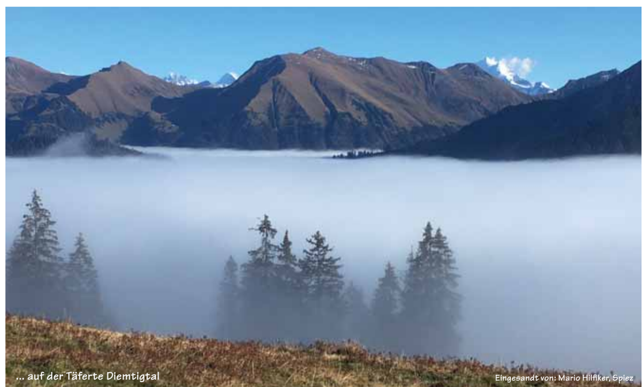
... auf der Täferle Diemtigtal