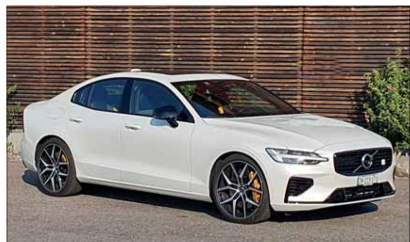
Schicker Schwede: Perfekte Limousine mit modernsten Zutaten. RHo

Der aufgeladene 2-Liter-Vierzylinder ist mit 318 PS allein schon für gute Fahrleistungen gut. Dazu kommt der Elektromotor, der seinerseits 87 PS (65 kW) beisteuert und ermöglicht, dass der Volvo heikle Gebiete emissionsfrei durchquert. Mit voll geladener Traktionsbatterie (400V, 11,6 kWh) kommt der S60 in der Stadt lautlos daher, denn die Reichweite beträgt über 50 km. Dann muss die Batterie wieder geladen werden. Eine Fahrt auf der Autobahn zeigte, dass der Strom rasch einmal aufgebraucht ist, aber der spritzige Vierzylinder liefert zuverlässig Leistung ohne Ende. Da alle vier Räder an der Traktion beteiligt sind, bleibt der Volvo auch bei Regen oder verschneiter Fahrbahn sicher in seiner Spur. Eine grosse Armada an Assistenten überwacht jede Bewegung des Autos, so dass er seine Passagiere sicher ans Ziel bringt. Höchsten Komfort vermittelt der Getriebeautomat. Ein ideales Auto für die Schweiz also, das auch optisch viel ausstrahlt. Bloss 2,1 l/100 km Verbrauch und das ab Fr. 77'800.-.