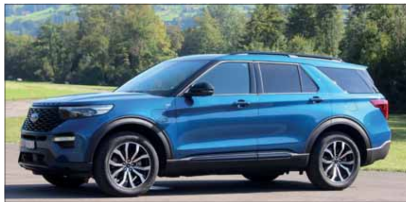
Siebenplätzer: Der grosse Ford auf dem Flugplatz Reichenbach. RHo