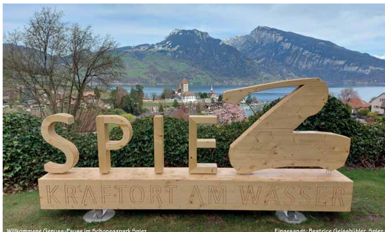
Willkommene Genuss-Pause im Schoneggpark Spiez