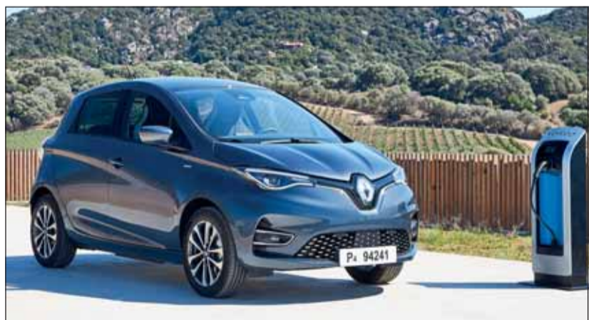
Ausstrahlung gewonnen: Der überarbeitete ZOE hat zugelegt. Renault

Der neue Zoe besitzt eine um 25 Prozent höhere Reichweite durch die grössere Batterie (50 kWh). Die Lademöglichkeiten wurden um eine Gleichstrom-Schnellladung erweitert. Der fremderregte Synchronmotor geht behutsam mit dem Strom um, was wir auf einer ausgiebigen Tagesetappe (ca. 280 km) erfahren konnten. Dabei konnte festgestellt werden, dass die Batterie durch Rekuperation immer wieder elektrische Energie tanken konnte und dadurch die Reichweite deutlich ausgeweitet wurde. Zwei Motoren (100 oder 135 kW) stehen im Angebot. Der Renault ZOE kostet Fr. 25'900.- bis Fr. 31'200.-. Dazu kommt die lauleistungsabhängige Batteriemiete (94 bis 144 Fr.). Wer die Batterie kaufen möchte, bezahlt 10'000 Franken dafür. Das könnte sich für Vielfahrer lohnen. Spass macht der Renault ZOE so oder so. RHO