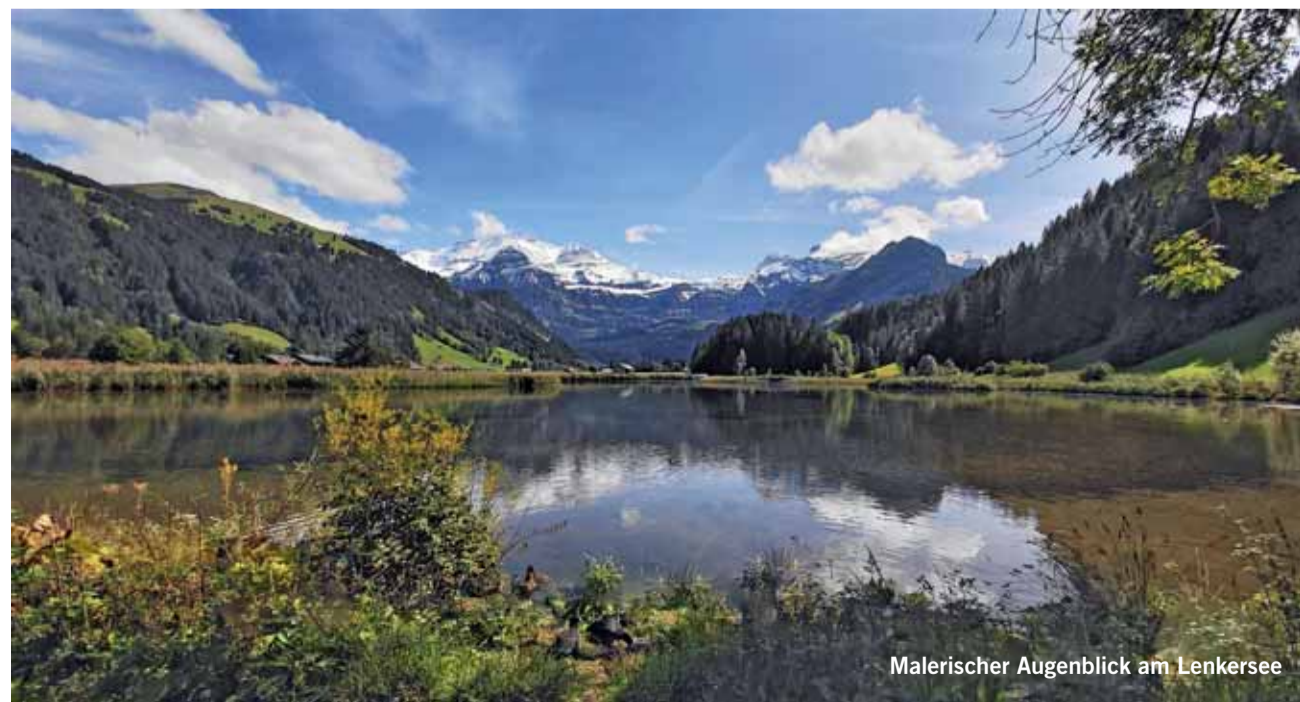
Malerischer Augenblick am Lenkersee

Senden Sie uns ein schönes, originelles oder lustiges Bild und wir belohnen Sie mit einem Einkaufsgutschein von Coop im Wert von Fr. 30.00. Senden Sie das Bild in genügender Auflösung an anzeiger@ilg.ch oder Simmentaler Anzeiger, Herrenmattstr. 37, 3752 Wimmis. Bitte mit Absender und kurzer Legende. Es wird keine Korrespondenz geführt.