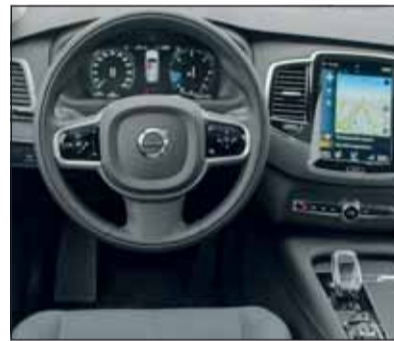
Edel-SUV: Der Volvo hat einen kristallinen Getriebewählhebel.

10 Kilowatt steuert der als milder Hybrid bezeichnete Starter/Generator an die Systemleistung bei. Das hilft beim Anfahren und bügelt das Turboloch weg. Wichtig legt sich der XC90 ins Zeug – wenn nötig zieht er auch bis 2,7 Tonnen schwere Anhänger mit. Der ohnehin hohe Komfort wird durch die Wahl der Luftfederung weiter gesteigert. Das erhabene Gefühl in einem Volvo zu sitzen, kennt auch dann keine Grenzen, wenn der XC90 über kurvenreiche Landstrassen gefahren wird. Die wuchtige Edeloptik und das feine Interieur stimmen. RHO