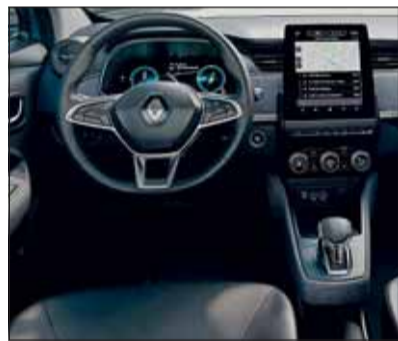
Moderne Zeiten: Der Renault ZOE verfügt über ein digitales Interieur.

Den Weg, den Renault mit dem ZOE eingeschlagen hat, ist einzigartig. Er ist sofort als Elektrofahrzeug erkennbar und zeigt sich klar als Vertreter der Franzosen. Die neue Generation hat in allen Bereichen zugelegt, was den ZOE als Alltagsvehikel besonders auszeichnet. Eine durchgehende Ver-