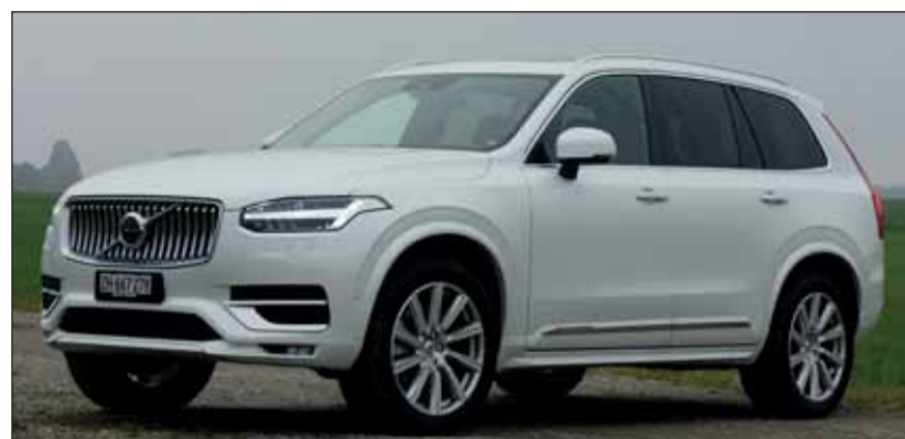
Wohlfühl-Grösse: Das Volvo-SUV mit milder Hybridtechnik gefällt. cj