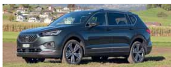
Grösster Seat: Das SUV Tarraco.

Der Tarraco ist Seats neuester und grösster SUV-Streich. Er ist mit bis zu sieben Plätzen zu haben und bietet höchsten Komfort. Angetrieben wird der Spanier durch einen Dieselmotor mit 190 PS, welche über eine 7-Gangautomatik an alle vier Räder weitergegeben werden. Der Tarraco fühlt sich damit auch im Gelände zu Hause. AB Fr. 47'550.- ist er zu haben.