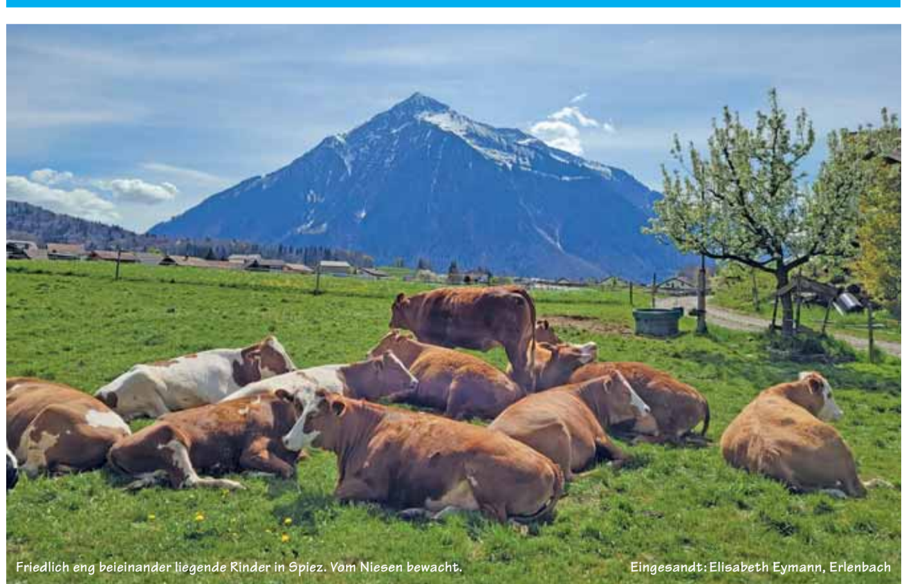
Friedlich eng beieinander liegende Kinder in Spiez. Vom Niesen bewacht.

Senden Sie uns ein schönes, originelles oder lustiges Bild und wir belohnen Sie mit einem Einkaufsgutschein von Coop im Wert von Fr. 30.-. Senden Sie das Bild in genügender Auflösung an anzeiger@ilg.ch oder Simmentaler Anzeiger, Herrenmattstr. 37, 3752 Wimmis. Bitte mit Absender und kurzer Legende. Es wird keine Korrespondenz geführt.