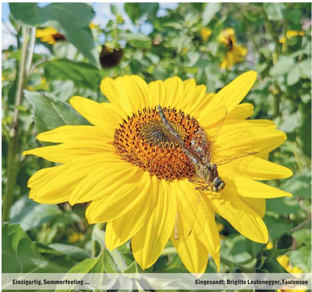
Einzigartig, Sommerfeeling ...