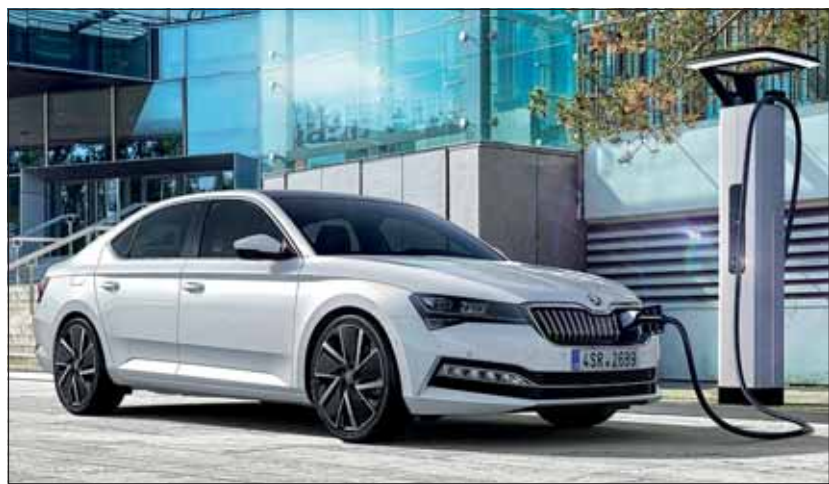
Hybrid mit Ladefunktion: In diesen Tagen erscheint der Superb iV. Skoda