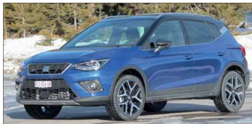
Kleiner Crossover: Der Erdgas-Arona bietet als FR viel für das Auge. RHO