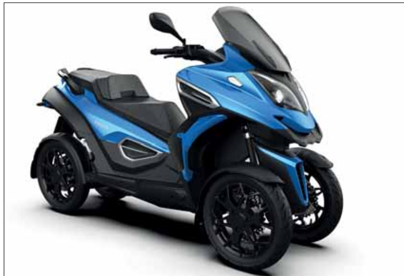
Rollce-Royce der Stadt: Der eQooder ist neu und hat Bezug zur Schweiz.