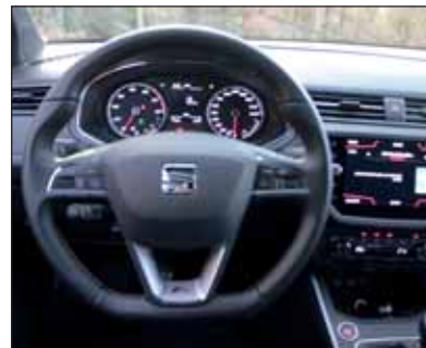
Betont sportlich: Die FR-Ausstattung passt zum Seat Arona.