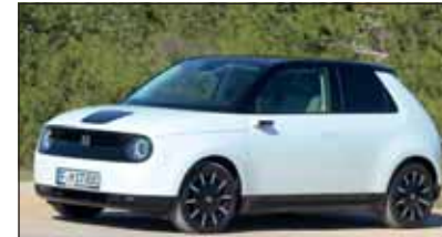
Der Honda e ist ein praktischer Kerl, besonders in der Stadt.

Ein einzigartiges Auto ist der elektrische Honda. Denn er bietet viel Platz für vier Personenn und ist voller technischer Leckerbissen. Er fährt mit dem zwischen den Hinterrädern eingebauten Elektromotor (113 kW) rund 200 Kilometer, bevor er wieder an die Steckdose muss. Im Kaufpreis von Fr. 43'100.– ist auch eine der modernsten Vernetzung dabei.