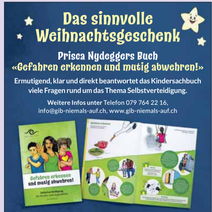
Illustration © LG AG Wimmis