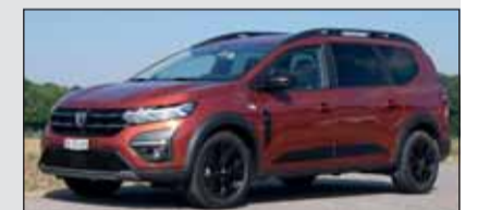
7-Kämpfer: Der Dacia Jogger hat tatsächlich 7 Plätze zu bieten.

Dacia Jogger ab Fr. 21'590.– Dacia hat mit dem neuen Jogger ein Crossover-Raumwunder zum Preis eines Kleinwagens im Angebot. Das Leben an Bord ist einfach, aber auch langstreckentauglich. Das kernig klingende Turboaggregat (1-Liter, 110 PS) zieht aus dem Stand kräftig an und sorgt mit einem lang übersetzten sechsten Gang für tiefe Verbrauchswerte (5,9 l/100 km).