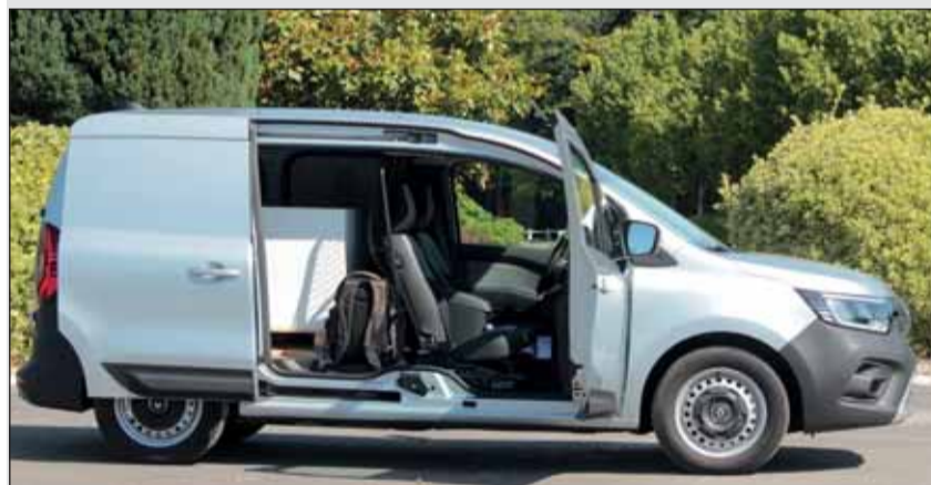
Auch die Elektroversion kann ohne rechten B-Pfosten bestellt werden. RHo

moment von 245 Nm, das vom Start weg zur Verfügung steht und so für eine entspannte Fahrt im städtischen Lieferverkehr sorgt. Der 45-kWh-Akku besteht aus acht reparaturfreundlichen Modulen. Zur hohen Effizienz des Kangoo Van E-Tech Electric trägt ebenfalls die rekuperative Bremsstrategie bei. Der Fahrer kann mit Hilfe des Gangwahlhebels zwischen drei Rekuperationsstufen von Stufe eins (kein rekuperatives Bremsen) bis hin zur Stufe drei (maximale Rekuperation) wechseln. Bei maximaler Rekuperation beschleunigt und bremst der Fahrer fast ausschliesslich über das Fahrpedal. Unterwegs in den Dörfern nördlich von Paris, wo willkürliche Stopptafeln und viele liegende Polizisten zuhauf zu finden sind, hat sich die Stufe drei bewährt. Der tiefe Schwerpunkt durch die 45 kWh-Batterie lassen ihn satt auf der Strasse liegen. Der neue Kangoo Van E-Tech Electric kann in der Schweiz seit Juni bestellt werden und startet bei einem Preis von Fr. 34'750.– (exkl. MwSt). RHo