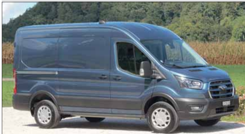
Kraftvoll: Der elektrische Ford Transit bringt rund 850 Kilo ans Ziel.

Wie bei elektrisch angetriebenen Personenwagen ist auch der Transit vom Start weg ein richtiger Sprinter. Weil unser Transit laut Fahrzeugausweis ein Gesamtgewicht von 3,5 Tonnen hatte, schrumpfte die Nutzlast auf 914 Kilo. Dafür sind die Fahrleistungen optimal, auch auf der Autobahn. Die Reichweite, sie hängt natürlich auch von der Zuladung ab, liegt bei klar über 300 Kilometer. Das heisst mit ihm kann locker eine Ladung von beispielsweise Bern nach Zürich gebracht und ohne Zwischenladung wieder zurück gefahren werden. Insgesamt topt der Ford Transit seine Konkurrenz in vielen Belangen.