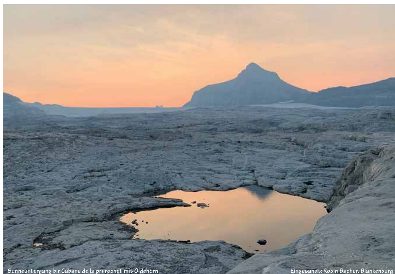
Sunnauntergang bir Cabane de la prarochet mit Oldhorn