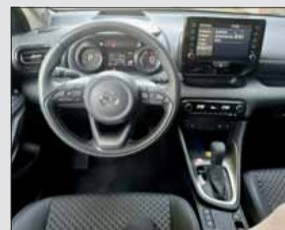
Arbeitsplatz: Der Hybrid-Mazda ist sehr gut ausgestattet.

Wenn es um Hybridantriebe geht, ist Toyota der absolute Weltmeister. Kein anderes Unternehmen hat annähernd gleichviele Systeme auf die Strasse gebracht. So wie er aussieht, fährt der Kleinwagen auch; wendig und agil in der Stadt, locker und spurtreu bei Kurvenfahrt sowie kraftvoll am Berg. Wer der Umwelt Sorge tragen möchte, dem sei der Mazda2 Hybrid empfohlen. RHo