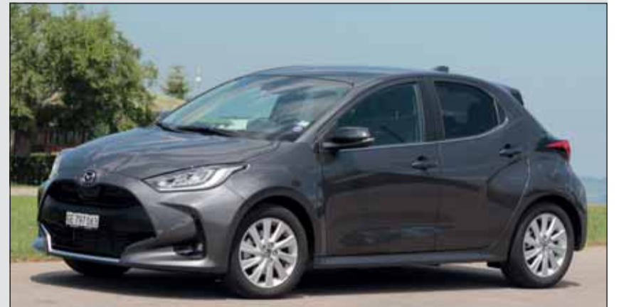
Augenfällig: Der Mazda2 Hybrid hat eine eigenständige Karosserie. RHo