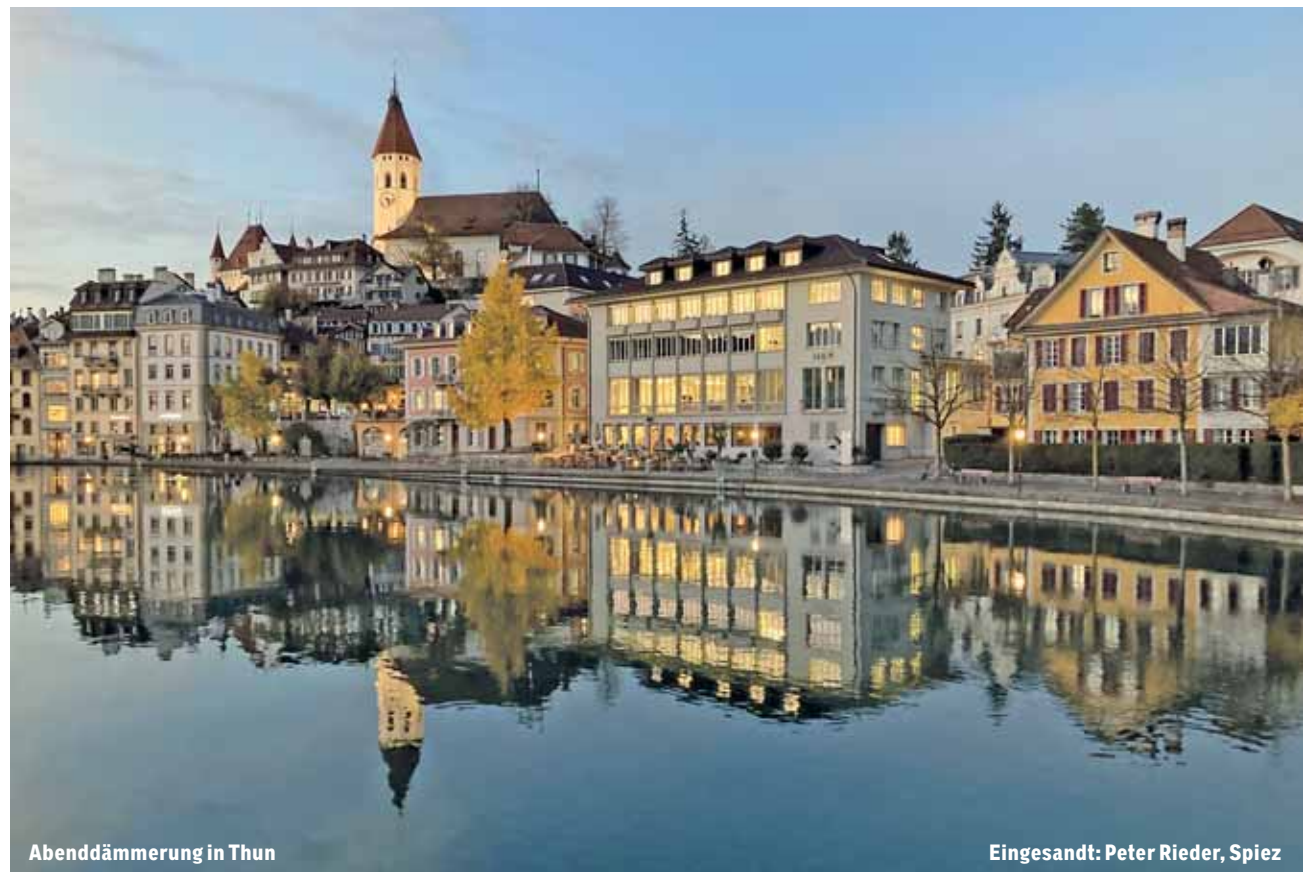
Abenddämmerung in Thun