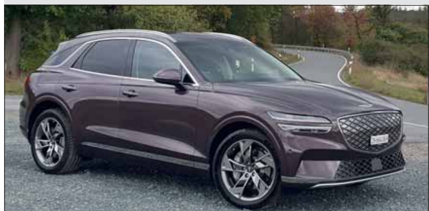
Genesis GV70: Jetzt mit zwei E-Motoren und 360 kW unterwegs.