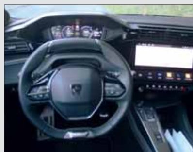
Braucht kein Head-up-Display: Im Peugeot liegen die Anzeigen immer über dem Lenkrad.