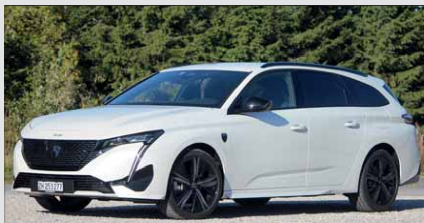
Langgestreckt: Der 308 SW ist deutlich länger als der Sedan.