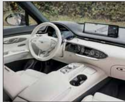
Sehr schön gemacht: Der elektrische Genesis GV70 hat einen Boostknopf im Lenkrad.

Der elegant gestylte E GV70 ist 4,715 Meter lang und besitzt einen Radstand von 2,875 m. Durch