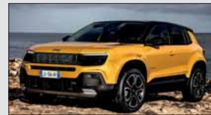
Jeep Avenger: Der neue Elektro-Jeep mit Frontantrieb.

Der Avenger hat eine knackig gezeichnete SUV-Karosserie mit ausstehenden Kotflügeln und Jeep-typischer Front. Die vier Fahrmodi Eco, Sand, Schnee und Schlamm suggerieren echte Geländewagen-Tugenden. Aber den Avenger wird es leider nur mit Frontantrieb geben. Dafür reichen 115 kW locker aus. Die Reichweite: rund 400 km.