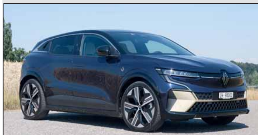
Zweifarbiger: Renault hat sich für goldene Elemente entschieden.

Der Antriebsmotor befindet sich immer zwischen den Vorder- und Hinterrädern, im Testwagen leistete er satte 160 Kilowatt (kW), was rund 218 PS entspricht. Die 60 kWh-Batterie liefert bei einem Verbrauch von durchschnittlich 16,1 kWh auf 100 Kilometer Strom für 300 km auf der Autobahn und bis über 400 km über Land. Damit ist der Renault vergleichsweise weit unterwegs, aber das Stromtanken dauert dann halt viel länger als bei flüssigen Treibstoffen. Die Passagier schätzen den hohen Abrollkomfort, weil der Mégane Bodenwellen sanft ausbügelt. Toll, wie der Mégane in 7,4 Sekunden auf 100 km/h beschleunigt, gleitet und wenn gewünscht rekurviert (verzögert), ohne dass das Bremspedal benutzt werden muss. Der elektrische Mégane ist ein durch und durch zeitgemässes, vitales Fahrzeug. Die Preisliste beginnt bei 40'000 Franken vergleichsweise günstig.