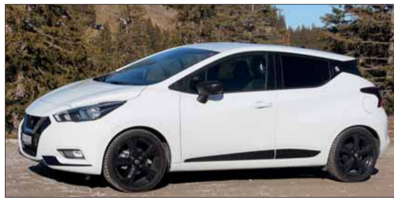
Moderne Optik: Der Nissan Micra hat sich zur Augenweide gemauert. RHO