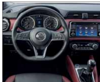
Freundlich: Das Micra-Interieur strahlt Jugendlichkeit aus.

Als Kraftquelle diente unserem Micra der Direkteinspritzer mit Turbo-Boost. Der Testwagen besass die manuelle Sechsgang-Schaltung, die für eine Beschleunigung von 0 bis 100 km/h nur knapp zehn Sekunden benötigt. Ausgezeichnet können die Lenkung und die Bremsanlage bezeichnet werden, die modernsten Ansprüchen genügen. Der Micra liebt kurvige Strecken und ist auch auf der Autobahn stabil unterwegs. Gut gibt es ihn auch mit Getriebeautomatik, die ein entspannteres Fahren gestattet, allerdings stehen ihm dann nur 100 PS zur Verfügung. RHO