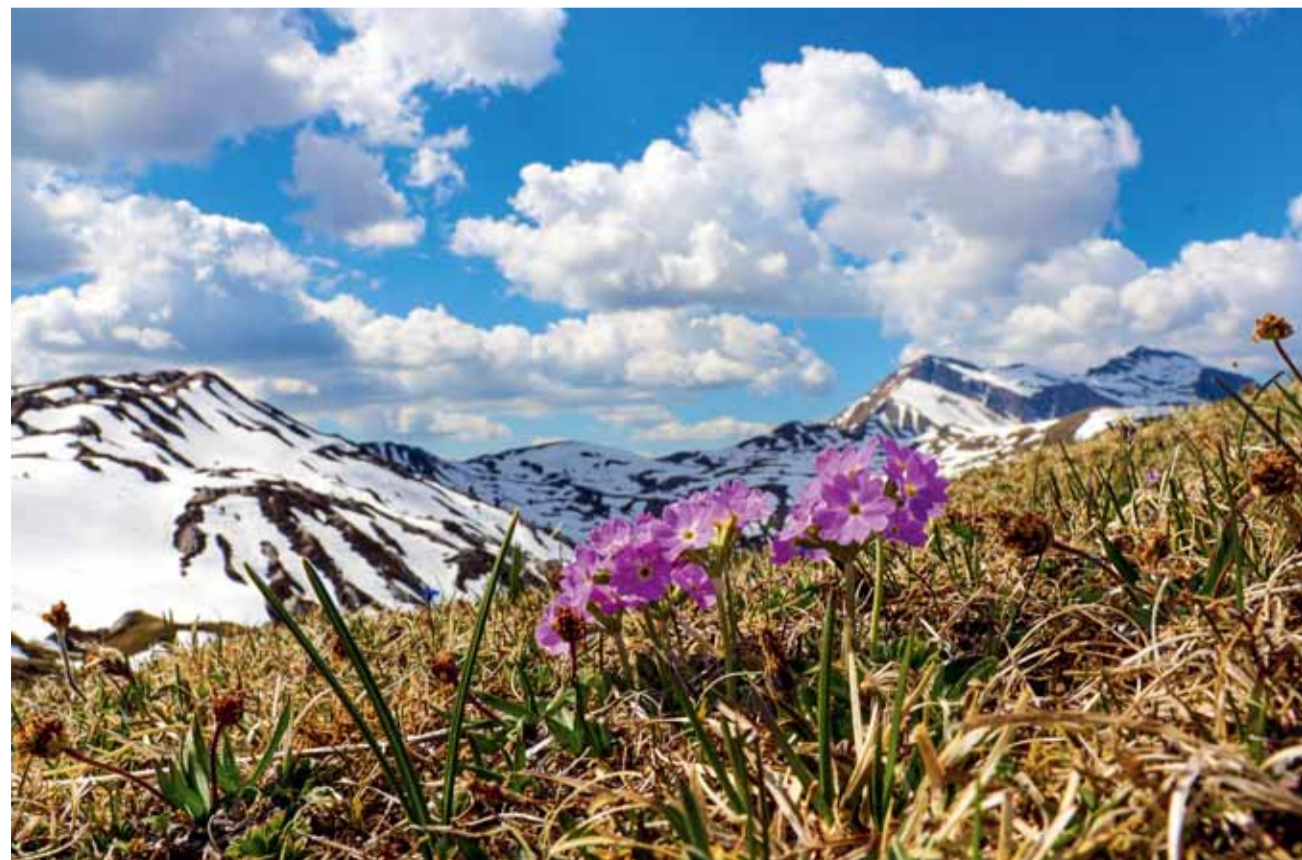
Die Mehprimel steht in voller Blüte und strahlt mit dem Wetter um die Wette.