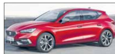
Seat Leon: Auch der spanische Golf wurde gründlich überarbeitet.

In diesen Tagen erlebte der Seat Leon seinen fulminanten Marktauftritt. Die neue Generation erobert die Welt allerdings in einem schwierigen Umfeld. Wir werden den völlig neuen Leon samt Kombi Sports Tourer baldmöglichst detailliert vorstellen, denn wie das Äusserere bereits zeigt, hat der Neuling enorm viel zu bieten.