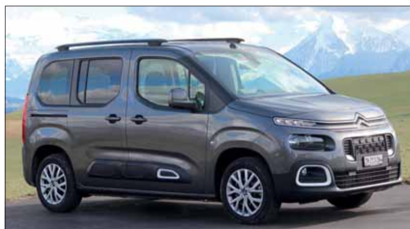
Verspielt: Der Familien-Berlingo befördert bis zu sieben Personen. RHO