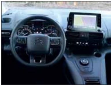
Moderner Minivan: Der Berlingo ist einfach zu bedienen und sicher.

verhältnisse, hinten fühlen sich drei oder fünf Personen ebenfalls recht wohl. Komfort wird auch auf längeren Reisen geboten. Nicht zuletzt, weil dem Musikgenuss für die Passagiere kaum Grenzen gesetzt sind. Der grosse Monitor für die Navigation und etliche Steuerungen ist personalisierbar. Im Laderaum finden zwischen 641 bis 2126 Liter Transportgut Platz. Er ist über eine grosse Heckklappe erschlossen, die hintere Sitzreihe über beidseitige Schiebetüren.