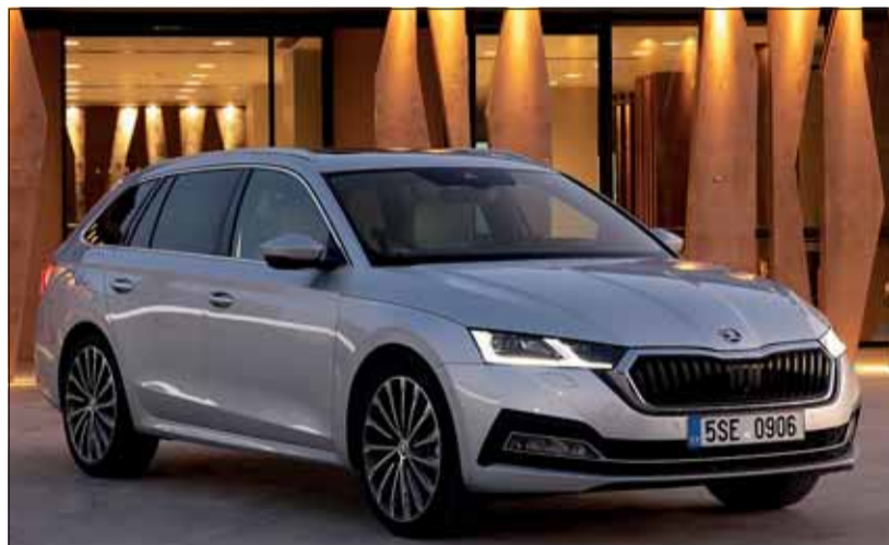
Nochmals gereift: Der Octavia ist Bestseller und Schönling zugleich. Skoda

Zur Einführung stehen für den Octavia – er ist hierzulande wie sein Vorgänger nur als Combi lieferbar – ein 1.5 TSI mit 150 PS sowie ein 2-Liter TDI mit 115 oder 150 PS zur Wahl. Der Benziner ist mit einem 5-Ganggetriebe, der kleinere Diesel mit einem 6-Ganggetriebe bestückt. Nur der stärkere TDI besitzt ein 7-Gang-Doppelkupplungsgetriebe und damit eine Automatik. Die Ausstattung Ambition ist bereits reichhaltig bestückt, allerdings wird sie von der Ausstattung Style (sie ist 2400 Franken teurer) noch gedopt. Hier werden alle Wünsche hinsichtlich Komfort und Sicherheit bei weitem erfüllt. Neben der guten Vernetzung nach aussen und der durchgehenden Digitalisierung bei den Anzeigen gefallen im neuen Octavia einmal mehr die zahlreichen cleveren Details, welche Skoda seit jeher auszeichnen. Bald folgen auch Hybrid-Versionen. Die Basispreise liegen zwischen 30'940 und 36'440 Franken. Dafür gibt es überaus viel Auto. RHO