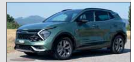
Gefällig: Der Sportage zeigt, was er hat: Rasse und Kraft im Überfluss.

Der neue Sportage ist ein Hansdampf in allen Gassen, fährt auch mal neben der Strasse, zieht Anhänger und ist seinem Besitzer in zahlreichen Situationen ein echter Kumpel. Jede der am Antrieb beteiligte Komponente (1.6, Benzin, 180 PS und E-Motor sowie Allradantrieb) erledigt ihre Sache perfekt. Ab Fr. 57'450.– plus sieben Jahre Garantie.