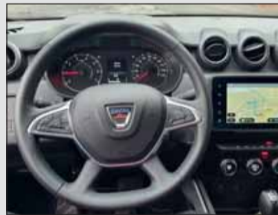
Dacia Duster: Es ist alles da, was unterwegs für Komfort sorgt. Die Verarbeitung ist ordentlich.