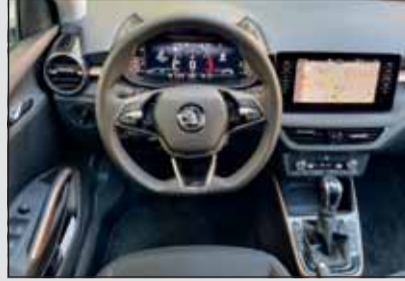
Zweifarbiger: Das Interieur des Fabia ist ein Traum für jung und alt.

Angetrieben wird der Fabia von einem Dreizylinder-Turbobenziner mit 110 PS Leistung, welche über ein Doppelkupplungsgetriebe an die Vorderachse geleitet werden. Mit dieser Motorisierung erreicht