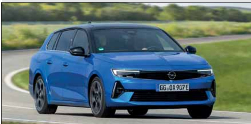
Opel Astra Sports Tourer: Der Kombi mit der Vizor-Front ist elegant.