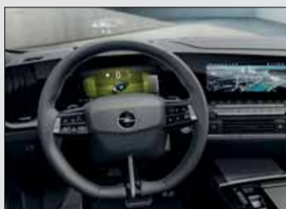
Digital-Cockpit: Der Astra hat modernste Zutaten.

cm sehr tief unten verläuft. Von der Seite ist zu sehen, dass der hintere Überhang 21 Zentimeter länger ist. Daraus ergibt sich ein bis zu 1634 grosser Laderaum. Schon mit aufgestellten Rücksitzen bietet das Gepäckabteil des neuen Opel Astra Sports Tourer knapp 600 Liter Ladevolumen. Das ganze Ladesystem ist durch den Intelli-Space-Ladeboden überaus flexibel nutzbar.