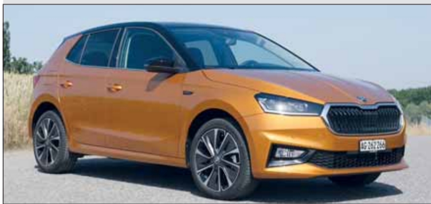
Gewachsen: Der neue Fabia setzt die Messlatte auf ein hohes Niveau.

er eine Maximalgeschwindigkeit von 205 und Tempo 100 in 9,7 Sekunden. Zusammen mit dem adaptiven Fahrwerk fährt sich der Fabia komfortorientiert und lässt sich weder von Spurrinnen noch von Fahrbahnverwerfungen aus der Ruhe bringen. Im Test und mit viel Zuladung schnitt der Skoda auch bei den Verbrauchswerten gut ab – 6 Liter auf 100 Kilometer sind realistisch. Fazit: Der Fabia bringt in der getesteten Version eine mehr als üppige Ausstattung mit an den Start. Zudem überzeugt der Kleinwagen mit zahlreichen klugen Details, einer sehr hohen Alltags-tauglichkeit und viel Komfort. Zu haben ist der 110-PS-Skoda Fabia ab Fr. 22'500.–