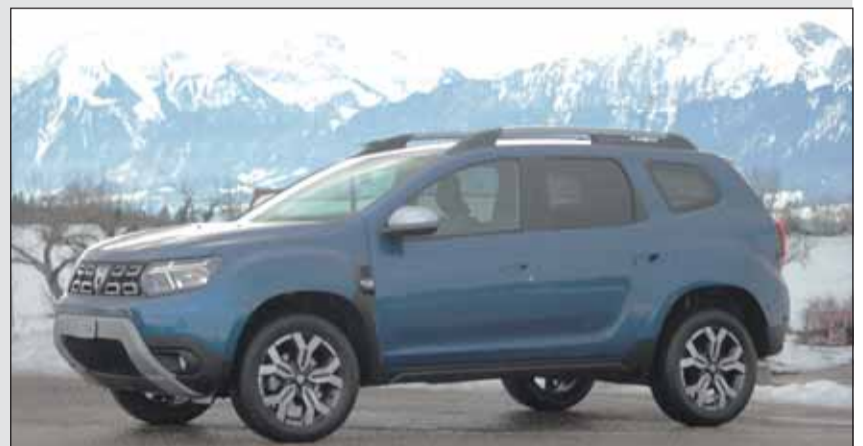
Praktiker-SUV: Der neue Duster bietet mehr Komfort und Sicherheit.