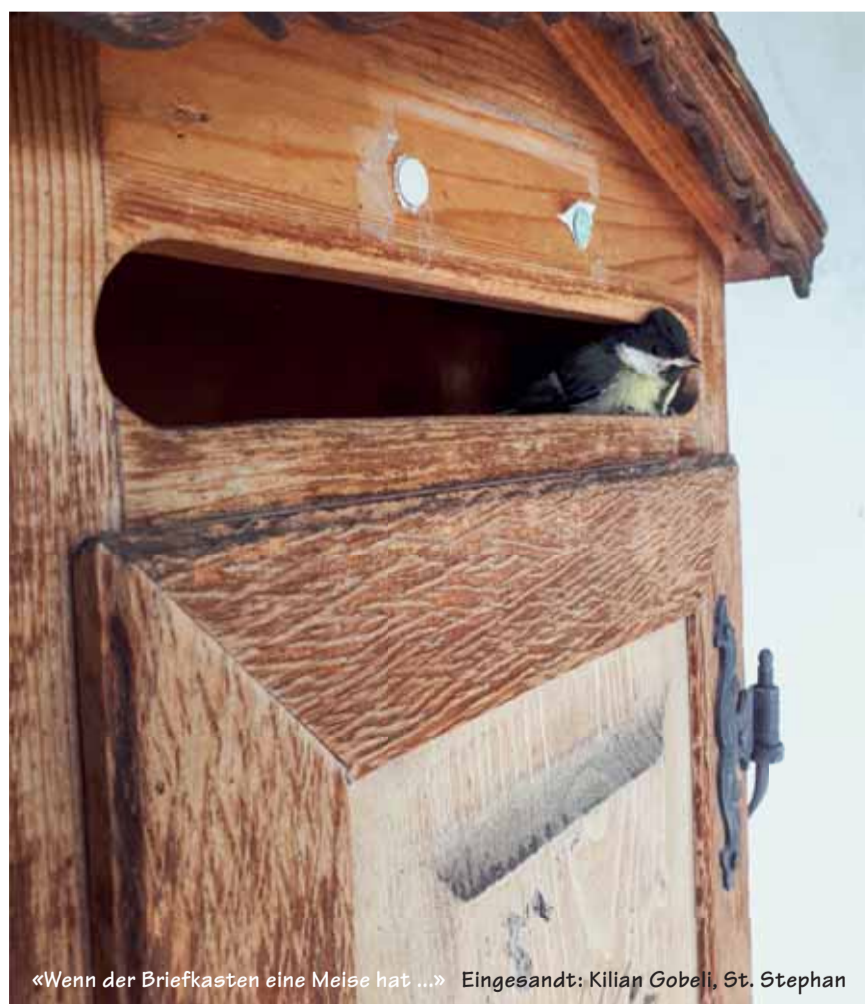
«Wenn der Briefkasten eine Meise hat ...» Eingesandt: Kilian Gobel, St. Stephan

Senden Sie uns ein schönes, originelles oder lustiges Bild und wir belohnen Sie mit einem Einkaufsgutschein von Coop im Wert von Fr. 30.00. Senden Sie das Bild in genügender Auflösung an anzeiger@ilg.ch oder Simmentaler Anzeiger, Herrenmattstr. 37, 3752 Wimmis.