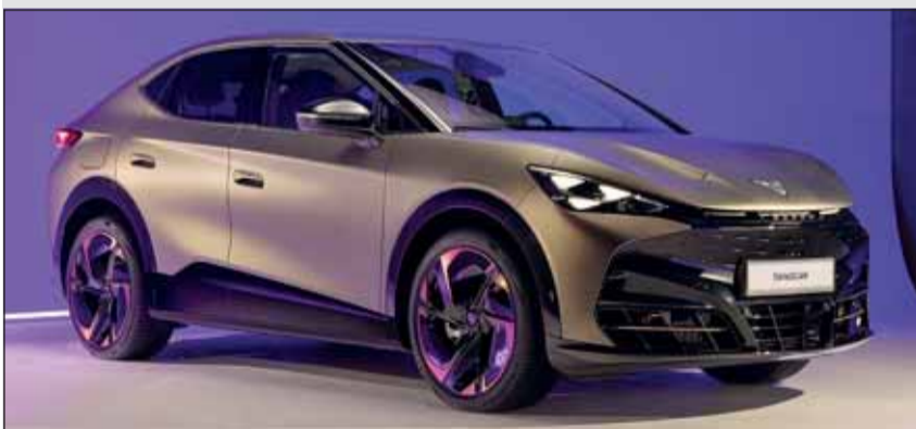
Cupra Tavascan: Der fünfplätziges Sedan ist eine echte Augenweide.

Alltagstauglichkeit bekam der Tavascan einen 540 Liter fassenden Kofferraum, dessen elektrische Heckklappe über ein virtuelles Pedal geöffnet und geschlossen werden kann.