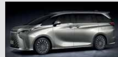
Lexus LM: hier vereinen sich Raum und Luxus in Perfektion.

Als LM 350h kommt der neue Lexus-Minivan mit vier oder sieben Sitzen zu uns. Der Innenraum des LM hebt die Gastlichkeit von Lexus auf ein bisher noch nie dagewesenes Niveau. Als eigenständiger PW mit einem unerreichten Passagier-Komfort setzt der LM auf Shuttle-Dienste (Hotels), und andern Chauffeur-Angeboten.