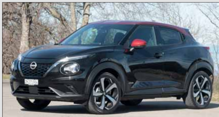
Typisch Nissan Juke: Knackige Karosserie mit Zweitonlackierung. RHO