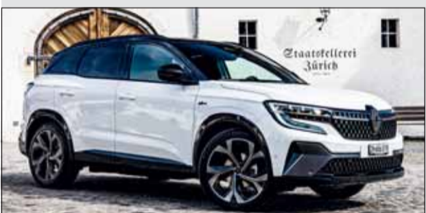
Renault Austral: Der Wendigste seines Segmentes.