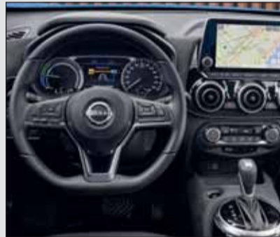
Sportliche Optik: Der Juke bietet eine ausgezeichnete Ausstattung.

Das Hybrid-System umfasst einen sparsamen Atkinson-Benziner und zwei Elektromotoren. Ihre Kraft wirkt über ein Klauengetriebe mit sechs Stufen auf die Vorderräder. So gerüstet erzielt der Juke völlig ausreichende Fahrleistungen – mindestens innerorts und auf kurvigen Landstrassen. Bergauf und auf der Autobahn hilft der Benziner mit hohen Drehzahlen tüchtig mit. Unvermeidlich ist eine laute Geräuschkulisse. Uns hat der zweifarbige Juke in der Tekna-Ausstattung jedenfalls sehr gut gefallen. Nicht nur, weil er praktisch keine Aufpreise kennt, sondern sofort optimal sitzt. RHO