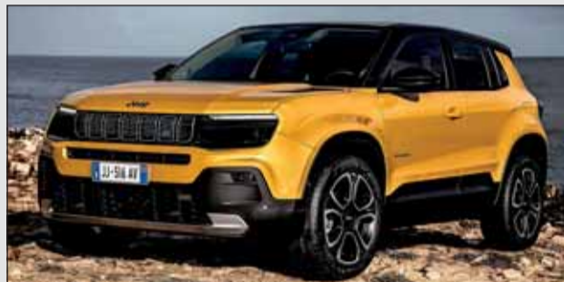
Jeep Avenger: Er ist das Auto des Jahres 2023.