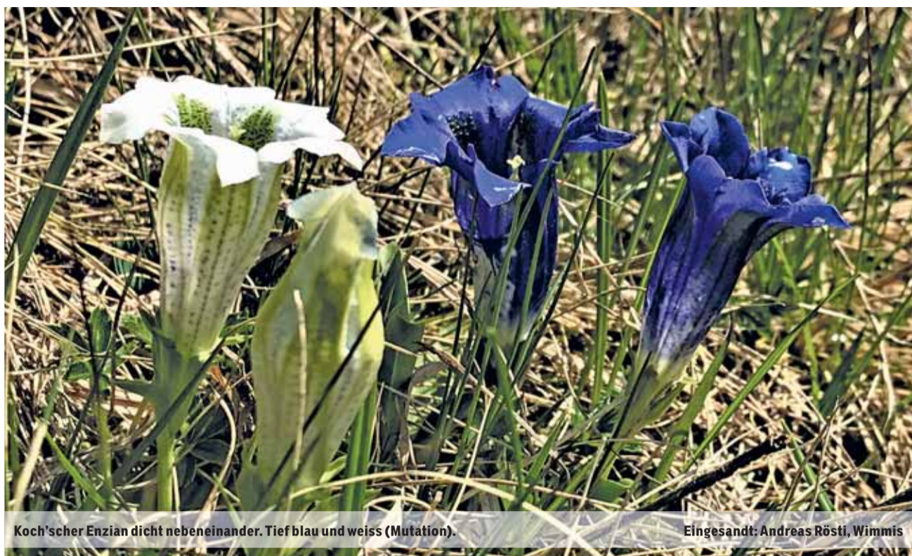
Koch'scher Enzian dicht nebeneinander. Tief blau und weiss (Mutation).

Senden Sie uns ein schönes, originelles oder lustiges Bild und wir belohnen Sie mit einem Einkaufsgutschein von Coop im Wert von Fr. 30.-.