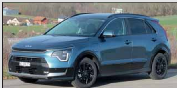
Kia Niro PHEV: Wenn die Reichweite entscheidend ist.