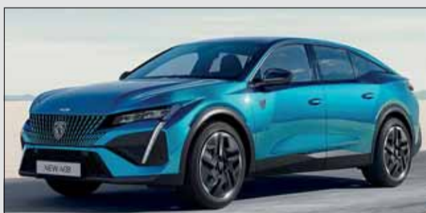
Peugeot 408 PHEV: Moderner Fließheck-Sedan.