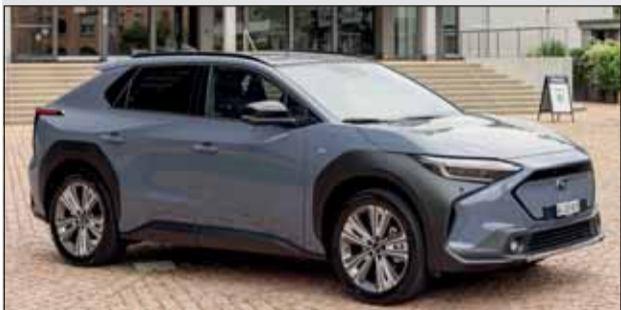
Subaru Solterra AWD: vollelektrischer Allradler.

vor, die in diesen Tagen eingetroffen sind. Alle sind mindestens zum Teil elektrifiziert. RHO