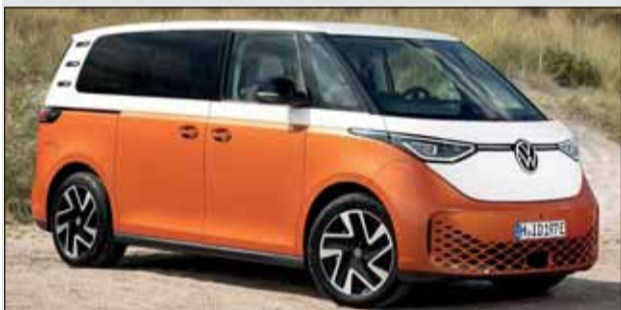
VW ID.Buzz: Der elektrische Alleskönner gefällt.