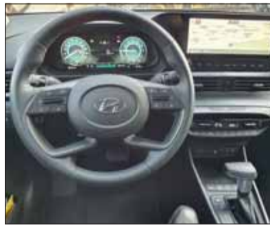
Aufgeräumt sportlich: Der i20 überzeugt auch innen mit Charme.

Reichweitenangst kennen die Besitzer eines i20 nicht. Das milde Hybridsystem verlangt denn auch keine zusätzlichen Kennt-