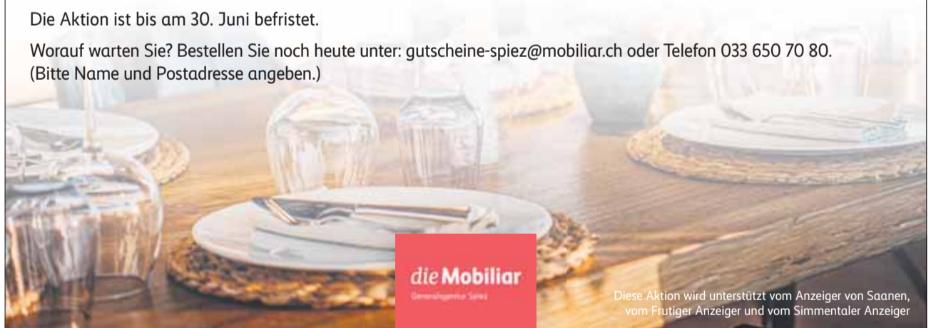
Diese Aktion wird unterstützt vom Anzeiger von Saanen, vom Frutiger Anzeiger und vom Simmentaler Anzeiger

Worauf warten Sie? Bestellen Sie noch heute unter: gutscheine-spiez@mobiliar.ch oder Telefon 033 650 70 80. (Bitte Name und Postadresse angeben.)