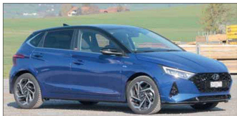
Wie ein Grosser: Der neue i20 bietet in jeder Beziehung etwas mehr. RHO

nisse. Der Einliter-Turbobenziner mit drei Zylindern liefert 88,2 Kilowatt (120 PS). Er wird von einem Elektromotor unterstützt, was ihm zusätzlichen Schub verleiht und den Verbrauch markant senkt. In den Versionen Amplia, Vertex und N-Line ist das famose 7-Gang-Doppelkupplungsgetriebe ab 28'800 Franken mit dabei. So gerüstet passt der Kleine überall. Der Hyundai i20 ist wirklich ein tolles Auto, das hohe Ansprüche befriedigt und dabei das Portemonnaie schont. Fünf Jahre Garantie inklusive. RHO