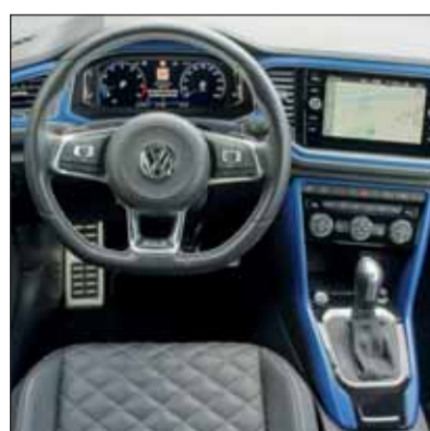
Klassisch: Das Bedienkonzept des Cabriolets ist sehr gut.

Reisen mit Wind im Haar Sobald es die Temperaturen und das Wetter zulassen, wird der T-ROC natürlich offen gefahren. Wer den Fahrtwind etwas eindämmen möchte, kann ein Windschott ordern. Die Fahrleistungen sind gut, die Heizung auch. Durch den stabilen Unterbau sowie die Verstärkungen im Bereich der Frontscheibe liegt der offene T-ROC auf jeder Strasse optimal. Seine Technik hinterlässt einen zuverlässigen Eindruck, so wie dies von einem Volkswagen erwartet werden darf. Wohlwissend dass das SUV-Cabriolet kaum zum Bestseller wird, verströmt VW mit ihm doch viel Lifestyle im Alltag. RHO