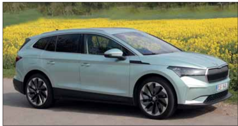
Total gelungen: Der Skoda Enyaq ist ein elektrischer SUV-Kombi. RHO

Die Auswahl an Batteriegrössen und Antrieben ist bei Skoda gross. Bei der ersten Kontaktnahme stand der Enyaq 80 zur Verfügung. Er ist mit der grösseren Batterie und 150 kW Leistung sowie Heckantrieb bestückt. Die entsprechende Allradversion hat 195 kW. Sie beschleunigt in 6,9 Sekunden auf 100 km/h. Die Höchstgeschwindigkeit ist auf 160 km/h beschränkt, aber dies stört in der Schweiz sowieso niemanden. Unsere Testfahrt zeigte ein ebenso vitales Fahrzeug, wie ein sehr auf einen niedrigen Stromverbrauch bedachtes Konzept. Kaum wird der Fuss vom Fahrpedal genommen rekurperiert das System und generiert so Strom für eine ausgewogene Reichweite von real über 300 Kilometer. Die Preise starten bei Fr. 42'590.-. RHO