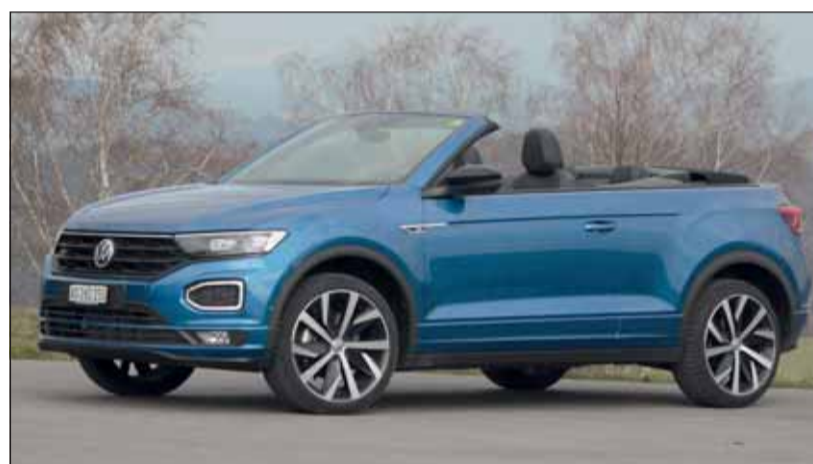
Offen für vier: Der T-ROC mit Faltdach ist ein urchiges Top-SUV. RHO

Fahrbericht: Volkswagen T-ROC Cabriolet 1.5 TSI