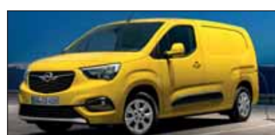
Saubere Stadtlieferungen mit dem Opel Combo-e Cargo.

Der neue rein batterie-elektrische Opel schleppt viel weg und ist dennoch kompakt genug für den dichten Stadtverkehr. Er bietet bis zu 4,4 Kubikmeter Ladevolumen und kann 800 Kilogramm Nutzlast schultern. Mit seiner 50 kWh-Lithium-Ionen-Batterie kommt er bis zu 275 Kilometer weit. Der E-Motor leistet 100 kW und 260 Nm Drehmoment.