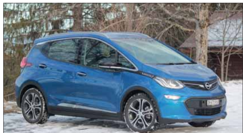
Toller Stromer: Der Opel Ampera-e wurde verbessert, Er macht es gut.

Im Schiebetrieb rekuperiert der Ampera-e automatisch, gewinnt dabei über den Elektromotor – der zum Generator wird – Energie zurück. Wechselt der Fahrer vom Drive- in den Low-Modus, steigt die Bremswirkung. In einer dritten Stufe kann zusätzlich mit einer Wippe am Lenkrad manuell auf volle Energierückgewinnung geschaltet werden, so dass nicht einmal mehr auf die Bremse getippt werden muss, um die Geschwindigkeit bis zum Stillstand abzubauen. Leise, kraftvoll und besonders schlau sind Attribute für den Ampera-e.