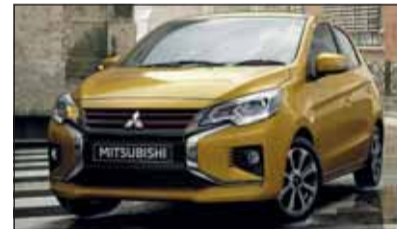
Mitsubishi Space Star: 3. Ausgabe.

Mitsubishi zeigt neuen Space Star Im dritten Anlauf dürften die Chancen für den kleinen Mitsubishi Space Star besser sein denn je. Optisch wirkt er ausgereift und erwachsen. Die Frontpartie gleicht jener der SUV aus dem gleichen Haus. Dreizylindermotoren mit 71 oder 80 PS setzen den Space Star in Fahrt. Damit ist das Leichtgewicht ganz flott und vor allem sparsam unterwegs.