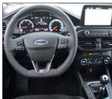
ST-Modus: Ford gibt dem Focus ST Sportlichkeit und Komfort mit.

Mit einem sanften Brummen erwacht der Vierzylinder zum Leben. Auch auf den ersten Metern käme niemand auf die Idee, dass es sich beim Dampfhammer um einen sparsamen Dieselmotor handelt. Mit grosser Wucht bringt er den ST rasch auf 100 km/h und zeichnet sich unterwegs als Kurvenkünstler aus. Der Federungskomfort ist klar definiert, aber nicht zu hart. Es ist eine wahre Freude, mit dem Focus ST durch die Stadt und über Land zu fahren, immer begleitet vom betörenden Sound. Einmal mehr ist Ford ein guter Wurf gelungen.