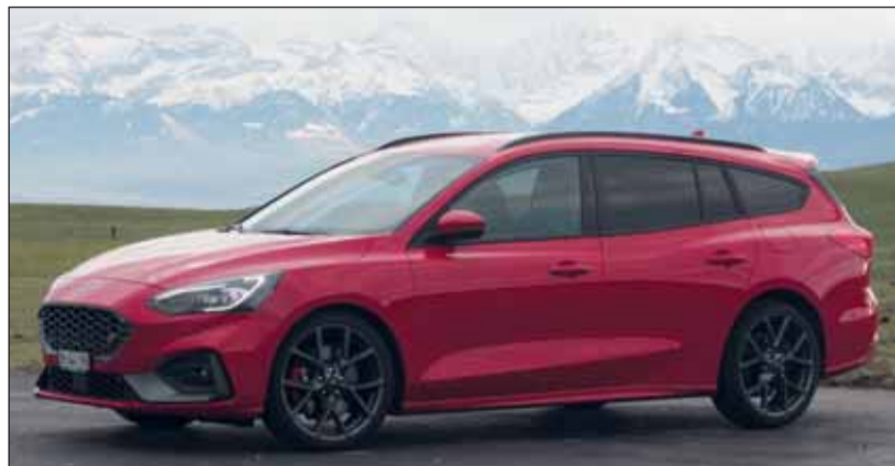
Schnell wie die Feuerwehr: Der Focus ST lockt sportliche Fahrer an. RHO