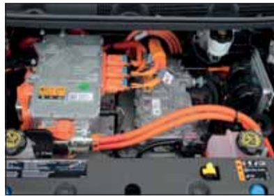
Hochspannung: Die Antriebssteuerung im Ampera-e.

Für das elektrisierende Temperament des Opel-Newcomers ist das maximale Drehmoment von 360 Newtonmeter verantwortlich. Die Leistung des Elektromotors entspricht 150 kW/204 PS. So gehören souveräne Ampelstarts oder Autobahnauffahrten zu den Paradedisziplinen des Reichweiten-Champions. Von null auf Tempo 50 beschleunigt der Kompakt-