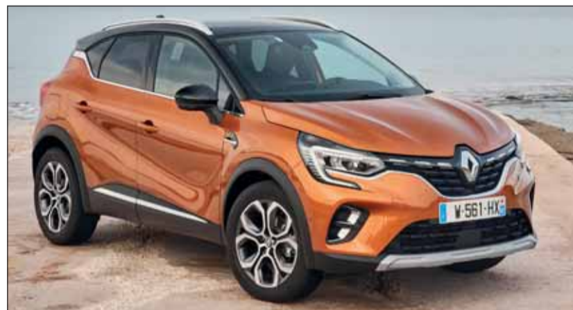
Überarbeitet: Der Renault Captur ist etwas grösser geworden. Renault

Das Motorenangebot mit dem 1.0 TCe (100 PS) und dem 1.3 TCe (130 PS und 155 PS) sowie dem Blue CDI Turbodiesel (115 PS) wird um den E-Tech Plug-in Hybrid erweitert. Letzterer besteht aus einem 1.6-Liter-Benzinaggregat und zwei Elektromotoren, bietet also faktisch Allradantrieb. Unterwegs fällt der neue Captur durch seine angenehme Federung, die präzise Kurvenfahrt und die hilfreichen Assistenten (adaptiver Tempomat, Fahrlichtautomatik, aktive Notbremsung usw.) auf. Der neue Captur ist klar erwachsener und familienfreundlicher geworden.