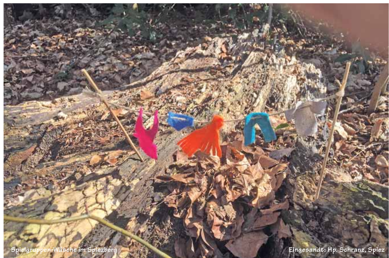
Spielgruppen-Wäsche im Spiezberg