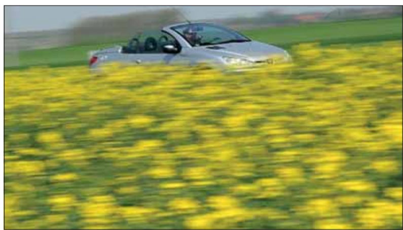
Blustfahrt: Macht mit einem frisch gewarteten Fahrzeug mehr Spass. web

In Kombination mit dem Frühjahrsputz kann beim Garagisten auch gleich die Klimaanlage überprüft und gewartet werden. Eine angenehme Innenraumtemperatur trägt nicht nur zum Wohlbefinden, sondern auch wesentlich zur Konzentration und somit zur Fahrersicherheit bei. Ein frischer Pollenfilter sorgt für gesunde Luft im Fahrgastraum und verhindert das Eindringen der verbreiteten Blütenpollen. Der versierte Fachmann wechselt natürlich nicht nur die Reifen. Er prüft bei dieser Gelegenheit den Zustand der Bremsbeläge, aber auch die Scheibenwischerblätter und alle Öl- sowie andern Flüssigkeitsstände. Durch den Auftrag einer Politur werden die Poren im Lack geschlossen und ein Feinschliff lässt die Karosserie wie neu erscheinen. So macht die Ausfahrt in den Frühling grösseren Spass und das Auto dankt es mit souveränen Fahrleistungen, hohem Komfort und wenig Vibrationen.