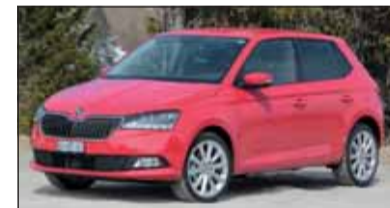
Feinschliff: Der überarbeitete Skoda Fabia gefällt.

Gründlich überarbeitet: Skoda Fabia Eine geschärfte Optik weist auf den jüngsten Fabia hin. Der knapp vier Meter lange Sedan hat mit optimierten Motoren, Doppelkupplungsgetriebe und vielen cleveren Details enorm gewonnen. Unser sparsamer Skoda Fabia (4,7 l/100 km) und war mit dem 110 PS starken Dreizylinder sowie Direktschaltgetriebe bestückt und mit 25'367 Franken angeschrieben (Basis Fr. 22'930.–).