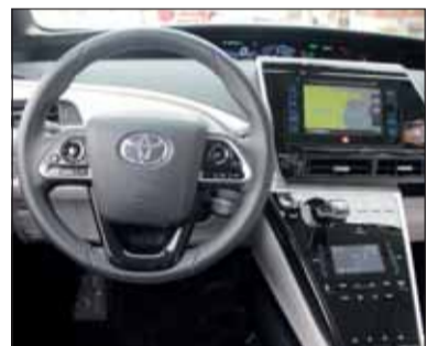
Wie im Flugzeug: Der Toyota Mirai setzt in jeder Hinsicht Marksteine.

Während andere Hersteller noch in der frühen Entwicklungsphase sind, bringt Toyota den Zukunftsantrieb bereits auf die Strasse. Das häufigste Element ist Wasserstoff (H 2 ), der überall zu finden ist. Seine gute Speicherfähigkeit ist ein weiteres gutes Argument. Reiner Wasserstoff wird in der Brennstoffzelle zu elektrischer Energie und Wasser aufgespalten. Der Mirai fährt also rein elektrisch. Überschüssiger Strom wird in der Batterie gelagert, bis er wieder gebraucht wird. Die Fahrleistungen sind wahrlich berauschend. Aus Fahrersicht ist er eine emissionsfreie, sichere Limousine. Einziger Nachteil: In der Schweiz gibt es zur Zeit bloss eine öffentliche Wasserstofftankstelle in Hunzenschwil (AG). RHo