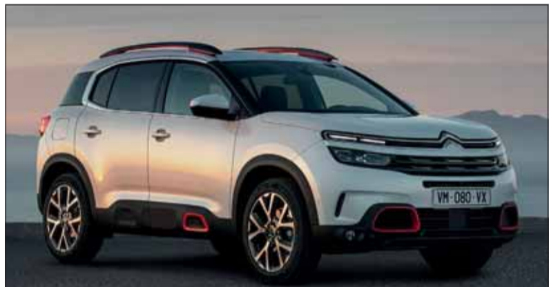
Entspannung angesagt: Der C5 Aircross macht Träume wahr. Citroën

Natürlich ist der C5 Aircross mit zahlreichen Motor-Getriebekombinationen ab Fr. 26'400.– zu haben. Die Preisliste geht jedoch für die Topversionen bis gegen 50'000 Franken hoch. Die Leistungen von 131 bis 181 PS (Hybrid inkl. Allradantrieb: 300 PS) sorgt dafür, dass die am besten passende Lösung gewählt werden kann. Weil der Neuling leider nicht gefahren werden konnte, verzichten wir auf Fahreindrücke. Dafür sind wir sehr angetan von den roten Elementen, welche die Karosserie zieren und ihr einen speziellen Touch geben. RHo