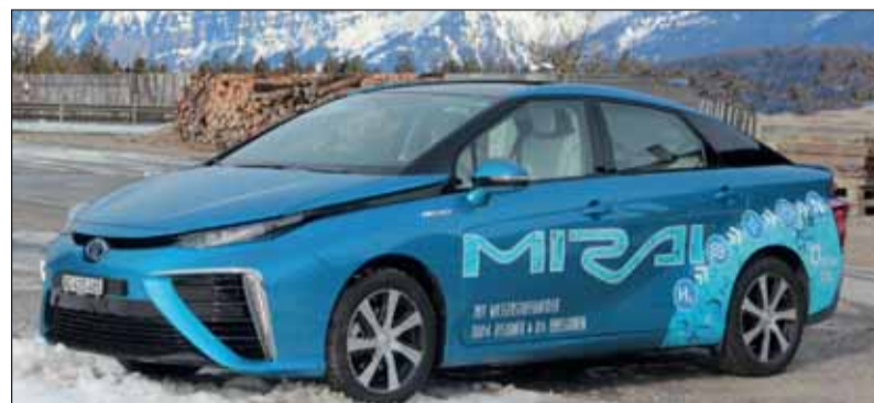
Einzigartig: Der Mirai ist das erste Wasserstofffahrzeug von Toyota. RHo