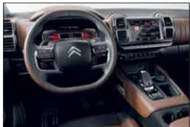
Mit dem C5 Aircross setzt Citroën auf Bewährtes in neuem Look.

Ausserlich ist der neue C5 Aircross eindeutig als SUV aufgemacht. Dabei besitzt er mit Ausnahme des Hybrid-Version bloss Frontantrieb und ist daher neben der Strasse nur sehr begrenzt einsetzbar. Der Innenraum ist – ty-