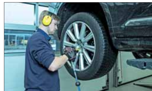
Die Werkstätten der AGVS-Garagisten sind in Betrieb und sorgen auch in der Coronavirus-Zeit für den notwendigen Reifenwechsel.

Einen vorgeschriebenen Zeitpunkt für den Reifenwechsel gibt es hierzulande nicht. Der AGVS empfiehlt, die Winterreifen gemäss der Faustregel O bis O zu fahren – von Oktober bis Ostern. «Die zwei bis drei Wochen rund um die Feiertage eignen sich ideal für den Wechsel, auch in der aktuellen Lage.»