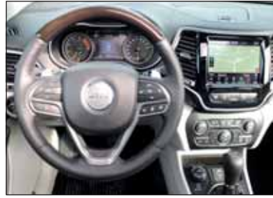
Edel und reichhaltig: Das Overland-Interieur überzeugt total.

Der 2-Liter-Turbobenziner läuft seidenweich und bildet in Verbindung mit der 9-stufigen Getriebeautomatik eine harmonische Einheit, die zum Cruisen einlädt. Dabei kann der Che-