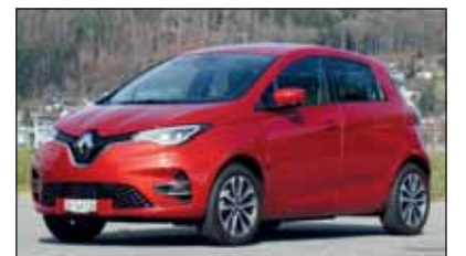
Renault ZOE: 3. Generation.

Stärker und perfekter: Renault ZOE Renault hat einen der grössten Erfahrungsschatze bei vollelektrisch angetriebenen Fahrzeugen. Seit letztem Januar wird die nochmals stark verbesserte dritte Generation verkauft. Ausser dem stärkeren Motor (135 kWh) ist es die Digitalisierung auf der einen und die Vernetzung auf der anderen Seite, die den ZOE (ab Fr. 29'700.-) nausmachen.