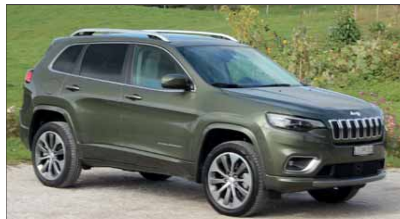
Zünftig zugelegt: Die Version Overland macht den Cherokee heiss. RHO

rookee auch ganz gehörig zuschlagen. Der verbaute Active Drive I bietet vier verschiedene Traktionsarten, muss jedoch ohne Geländeunterstützung auskommen. Trotzdem fährt der Overland auch auf losem Untergrund, Schnee oder nassen Wiesen überaus weit. In nur 7,2 Sekunden ist der 4,6 Meter lange Cherokee auf Tempo einhundert und beschleunigt bis auf 206 km/h. Insgesamt überzeugten uns die moderne Einrichtung mit vielen Komfortmerkmalen, das souveräne Fahrwerk sowie die reichhaltige Ausstattung. Ein praktischer Familienfreund für alle Fälle. Weil der Cherokee Overland schon von Haus auf sehr gut ausgestattet ist, liegen der Basis- und der eigentliche Fahrzeugpreis nahe beieinander: Fr. 58'500.-, respektive Fr. 60'650.-. Ein echter Jeep.