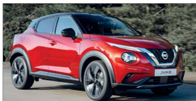
Zweite Generation: Der neue Nissan Juke setzt Emotionen frei. Nissan

Der neue Juke ist auf höchste Agilität getrimmt. Trotz des Längenzuwachses ist er rund 23 Kilogramm leichter als sein Vorgänger, was der Fahrdynamik zugutekommt. Der vermehrte Einsatz hochfesten Stahls sorgt für eine steifere Plattform, die Stabilität, Performance und Kurvenverhalten verbessert. Unter der Motorhaube arbeitet ein effizienter DIG-T-Turbobenziner mit drei Zylindern, der aus einem Liter Hubraum 117 PS entwickelt. Die Kraftübertragung übernimmt wahlweise ein Sechsganggetriebe oder ein sportliches Siebengang-Doppelkupplungsgetriebe. Der Fahrer kann das Fahrverhalten mit drei Modi (Eco, Standard, Sport) anpassen. RHO