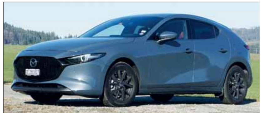
Kodo-Design: Perfekte Architektur für Auto mit modernster Technik. cj