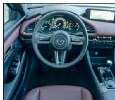
Zweifarbige: Der Mazda-Innenraum ist stimmig eingerichtet.

stattet. Diesen Motor mit milder Hybridtechnik lernten wir bereits im Mazda CX-30 kennen, dort war er allerdings mit einem automatischen Getriebe gekoppelt. Der jetzige Testwagen verfügte über das manuelle Schaltgetriebe. Mit ihm änderte sich das Beschleunigungsverhalten deutlich, denn die versprochenen 180 PS schienen sich auf dem Weg zu den Rädern irgendwo zu verlieren. Da gibt es nach unserer Meinung nur zwei Lösungen: entweder wird auf den Allradantrieb verzichtet weil das Gewicht einspart, oder Mazda müsste sich überlegen, den X-Motor mittels Turbo oder Kompressor zu jener Agilität zu verhelfen, die heutzutage gewünscht und beim Überholen nötig ist. Die meisten Fahrer werden das kleine Manko aber nicht merken, da sie sich ohnehin für die 6-Stufen-Automatik (+ Fr. 2000.-) entscheiden. RHO