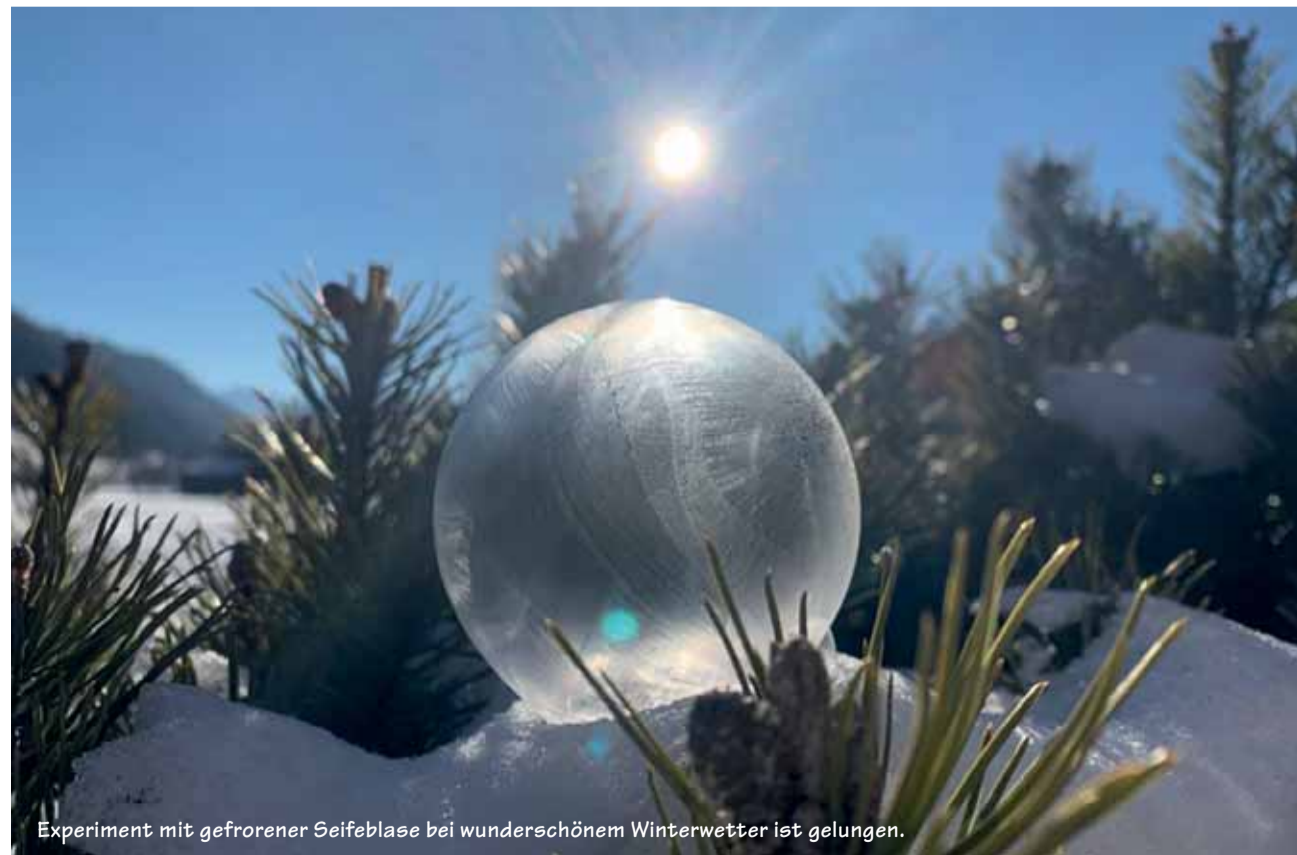
Experiment mit gefrorener Seifeblase bei wunderschönem Winterwetter ist gelungen.

Senden Sie uns ein schönes, originelles oder lustiges Bild und wir belohnen Sie mit einem Einkaufsgutschein von Coop im Wert von Fr. 30.00. Senden Sie das Bild in genügender Auflösung an anzeiger@ilg.ch oder Simmentaler Anzeiger, Herrenmattstr. 37, 3752 Wimmis.