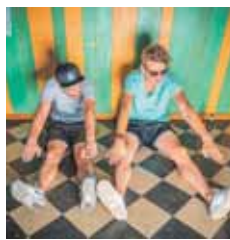
Dabu Fantastic ab 23.00 Uhr auf der Roggliwiese