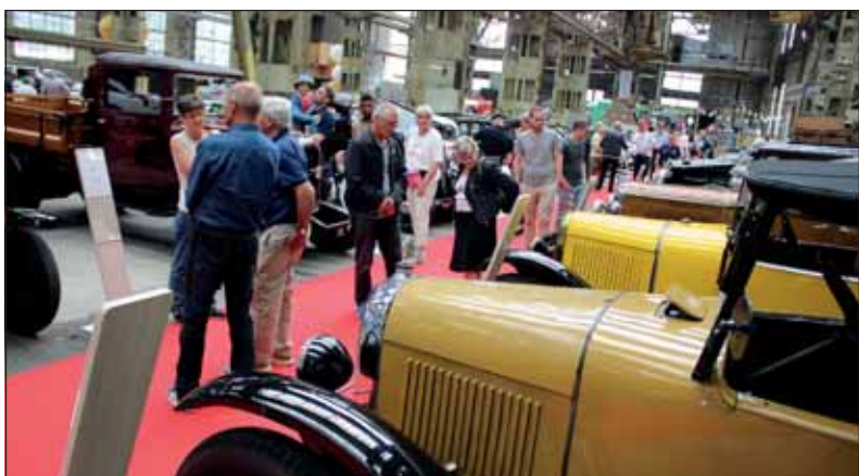
Citroën-Ausstellung: In der grossen Werkhalle standen 100 alte Wagen.

Immerhin, die von verschiedenen Seiten beigegebenen – teils sehr exklusiven – Doppelwinkelautos zeigten die Fahrzeugentwicklung vom ersten bis zum neuesten Modell. Informative Tafeln liessen die Historie der Marke Revue passieren und zu jedem Exponat wurden auf einem Ständer die wichtigsten Informationen weitergegeben. Schon wenige Jahre nach der Gründung trat Citroën als Erfinder raffinierter Lösungen auf. Zu den herausragenden Fahrzeugen gehört der Traktion, eines der ersten Fahrzeuge mit verkehrt montiertem Vierzylinder und Frontantrieb. Erwähnt werden müssen aber auch der 2CV und seine vielen Varianten, die ID- und DS-Modelle mit hydraulischer Federung oder der Citroën-Maserati als blitzschneller Überflieger der 60er-Jahre.