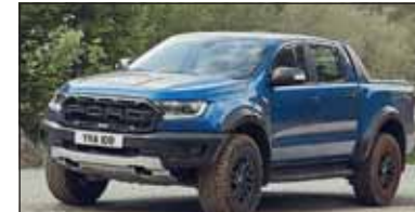
Ford Raptor: Der ultimative Allrad-Doppelkabiner auf Ranger-Basis.

Ford Ranger Raptor: Der Offroader Neu in der Palette des Ford Ranger figuriert die Version Raptor als Lifestyle-Sportmodell. Er nutzt die grössere Bodenfreiheit um im Gelände noch agiler zu wirken. Topmotorisierung ist der 2-Liter Biturbodiesel mit 213 PS (500 Nm). Der ab Fr. 57'650 Franken kostende Raptor steht für ultimativen Offroad-Fahrspass sowie hohe Beständigkeit.