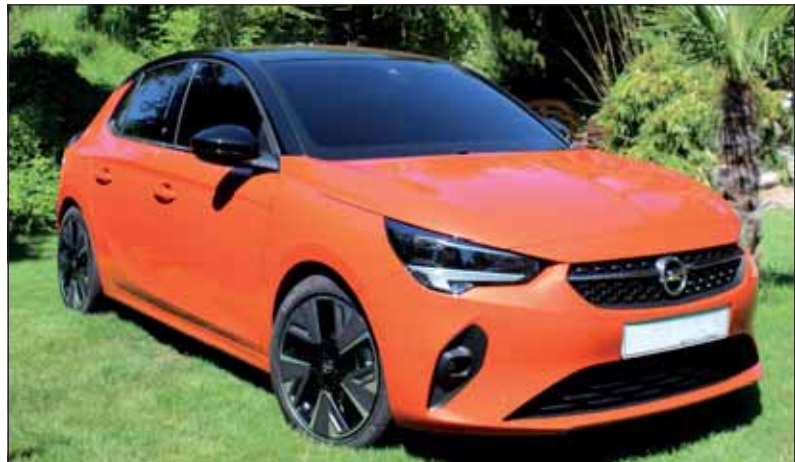
Neuer Opel Corsa: Die 6. Generation startet mit der Elektroversion. RHO

Erstmals bietet Opel mit der sechsten Corsa-Generation eine rein batterie-elektrische Variante mit 100 kW (136 PS) Leistung und einer Reichweite von bis zu 330 Kilometer (WLTP) an. Der in Kürze bestellbare Corsa-e ist das Volkselektroauto mit dem Blitz. Der ab Anfang 2020 zur Auslieferung gelangende Corsa-e ist zu Preisen ab Fr. 33'990.- zu haben. Opel kündigt darüber hinaus an, dass bis 2024 alle Modellreihen mindestens eine elektrifizierte Version aufweisen werden. Die beiden nächsten sind der Opel Mokka X sowie der Vivaro.