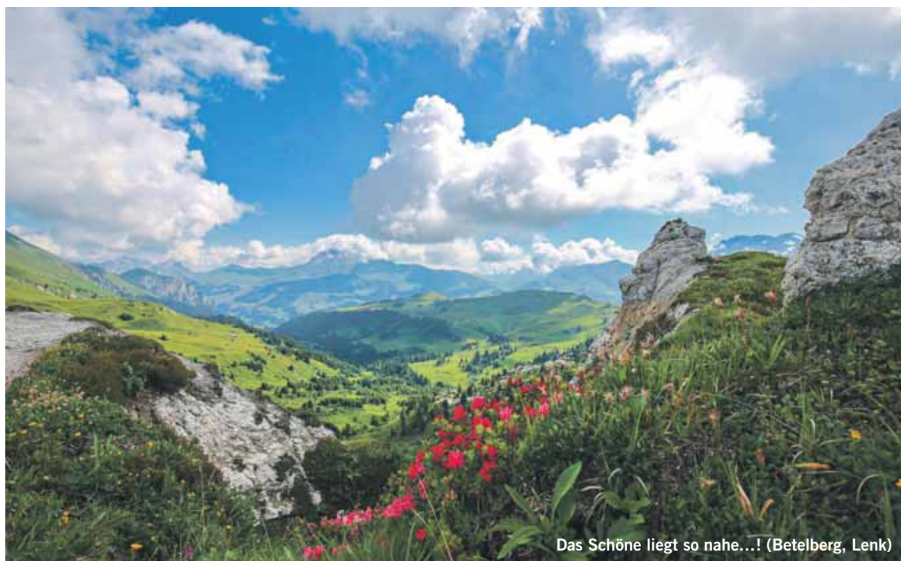
Das Schöne liegt so nahe...! (Betelberg, Lenk)