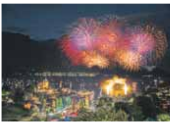
Grosses Feuerwerk ab 22.30 Uhr am Spiezer Himmel