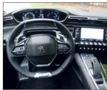
Kleines Lenkrad: Die Anzeigen liegen darüber, genial gemacht.