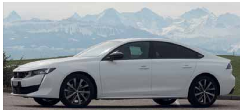
Peugeot 508: Wie ein Coupé steht der Viertürer in der Landschaft. RHO

Fahrbericht: Peugeot 508 HDI 180 GT-Line