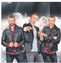
Grubertaler ab 23.00 Uhr im Buchtrondel