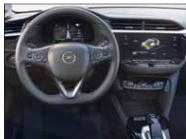
Volligital: Der Elektro-Corsa will das Volkselektroauto werden.

höheren Fahrzeugsegmenten vorbehalten waren. Dazu gehört etwa das IntelliLux LED Matrix-Licht, das Opel erstmals im Kleinwagensegment anbietet. Das moderne Interieur lässt sich sogar mit einem volligitalen Cockpit und Ledersitzen aufwerten. Bestens vernetzt und unterhalten sind Corsa-Fahrer und -Passagiere mit dem Infotainment-Angebot aus dem Top-System Multimedia mit 10-Zoll-Farb-Touchscreen.