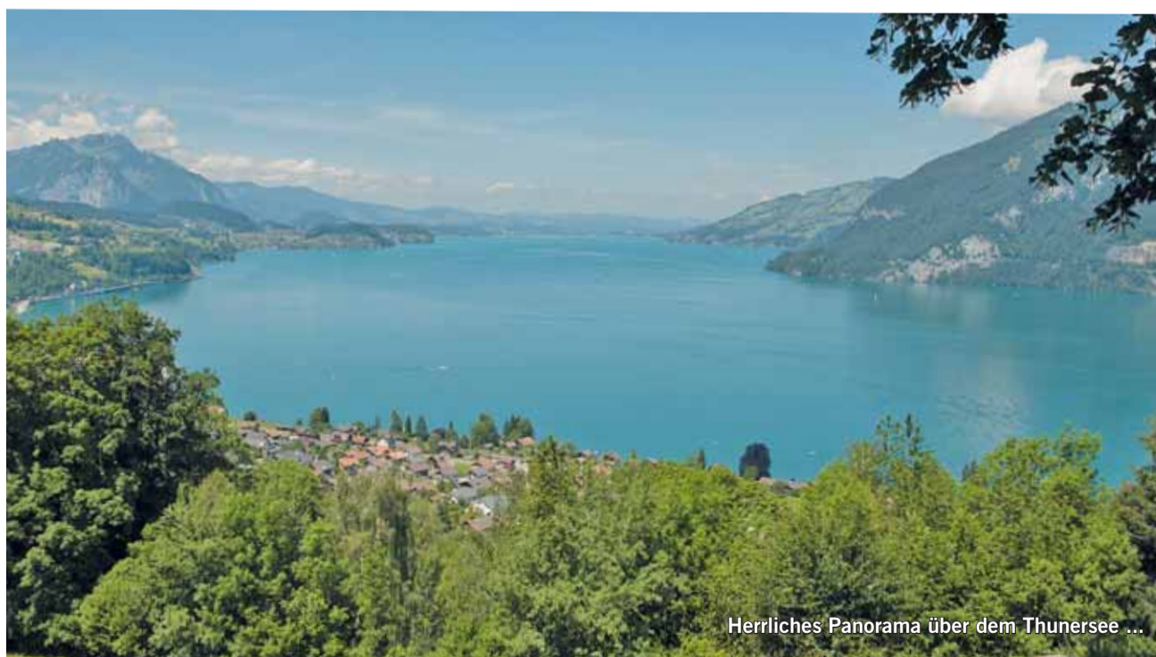
Herrliches Panorama über dem Thunersee ...

Jedes publizierte Bild wird mit einem Einkaufsgutschein von Coop im Wert von Fr. 30.00 belohnt. Senden Sie Ihr Bild (Ouerformat) in genügender Auflösung an anzeiger@ilg.ch oder Simmentaler Anzeiger, Herrenmattstr. 37, 3752 Wimmis. Bitte mit Absender und kurzer Legende. Es wird keine Korrespondenz geführt.