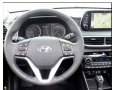
Perfekt: Angesichts der tollen Ausstattung lockt der Tucson viele an.