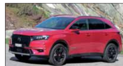
DS7 Crossback: Der Edel-Citroën lässt Muskeln spielen: bis 225 PS.

DS Automobiles bringt den DS7 In der SUV-Szene hatte Citroën bislang nicht viel zu bieten. Nun aber gibt es mit dem DS7 Crossback ein sehr interessantes Modell. Die Schwester von Peugeot 3008 und Opel Grandland X zeigt sich aussen und innen überaus edel und gespickt voll von Extravaganzen. Besonders erwähnenswert ist die Lichtsignatur in LED. Bevor die Hybridversion da ist, gibt es nur Frontantrieb.