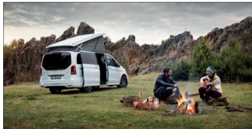
Kompakter Camper: Der Mercedes-Benz Marco Polo bietet Freiheit pur.

Zwei bis drei Tage vor der Abreise wird beim Auftanken an der Tankstelle der Luftdruck in allen Reifen (inklusive Reserverad) um mindestens 0,3 bar (hpa) erhöht. Das schont das Profil und bringt mehr Stabilität, bei nur wenig sinkendem Abrollkomfort. Am Abreisetag selbst gilt es zuerst alle schweren und grossen Gegenstände möglichst tief im Auto zu platzieren. Wenn über die Fensterlinie hinaus beladen wird, darauf achten, dass die Sicht des Fahrers nicht beeinträchtigt wird. Alles was unterwegs benötigt wird (Verpflegung, Getränke, Insekten- und Sonnenschutzmittel, Brillen und Ausrüstung) in Griffweite deponieren. RHo