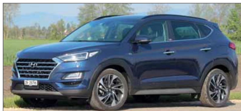
Immer besser: Der neue Tucson imponiert mit milden Hybrid. RHo