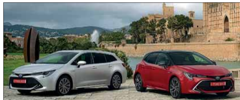
Kombi und Sedan: Der neue Corolla kommt mit klassischer Palette. Toyota

Zweimal mit Hybrid-Technik Angeboten wird der Corolla von einem 1.8-Liter Benzinmotor sowie einem Elektromotor. Die Systemleistung beträgt 122 PS. Der Verbrauch liegt bei lediglich 3.3 l/100km und der CO 2 Ausstoss liegt bei nur 76 g/km. Der Motor wurde überarbeitet, wobei der Reduktion von Reibwiderständen eine besondere Beachtung geschenkt wurde. Bei Bedarf nach mehr Leistung wird ein komplett neues System mit einem 2.0-Liter-Benzin- / Elektromotor angeboten. Die Leistung beträgt 180 PS und der Verbrauch steigt nur unwesentlich auf 3.9 l/100km an. Der Corolla kann bis zu einer Geschwindigkeit von 115 km/h rein elektrisch fahren und natürlich rekuperiert er beim Gleiten oder Verzögern elektrischen Strom, der in die Batterie eingespeist wird. Die Corolla-Palette steht bereits bei den Händlern. RHo