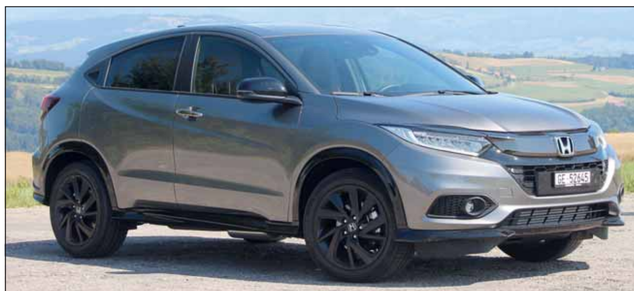
Gefällt: Der Honda HR-V hat rassige Linien und erfüllt SUV-Wünsche. RHo

Spritzige Power automatisch gut Wahrscheinlich werden junge Leute den HR-V Turbo mit dem mechanischen Getriebe bevorzugen. Wir genossen die Fahrt mit dem stu-