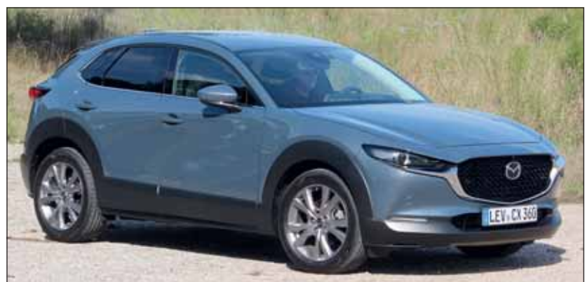
Mazda CX-30: Begeistert innen und aussen mit Klasse und Rasse. RHo

Mildhybridtechnik und Allradantrieb Während wir den CX-30 mit dem 122 PS starken 2-Liter-Hybridmotor fahren konnten ist der CX-30 auch mit dem 180 PS starken X-Kompressionszylinder-Benzintriebssatz zu haben. Bei beiden sorgt ein Elektromotor im Antriebsstrang dafür, dass die Beschleunigung über einen weiten Drehzahlbereich kraftvoll verläuft. Die Kraft wird über ein manuelles 6-Ganggetriebe oder eine 6-Stufenautomatik (+ Fr. 2000.-) auf die Vorder- oder alle vier Räder übertragen. Überrascht hat uns das ausgewogene Fahrverhalten des CX-30, denn er lässt sich nicht aus der Ruhe bringen. Tolles Ambiente, berauschende Formen und eine alltagstaugliche Saubertechnik sind im Mazda CX-30 zusammengeführt. Die Preise liegen zwischen Fr. 29'650.- und Fr. 39'650.-. RHo