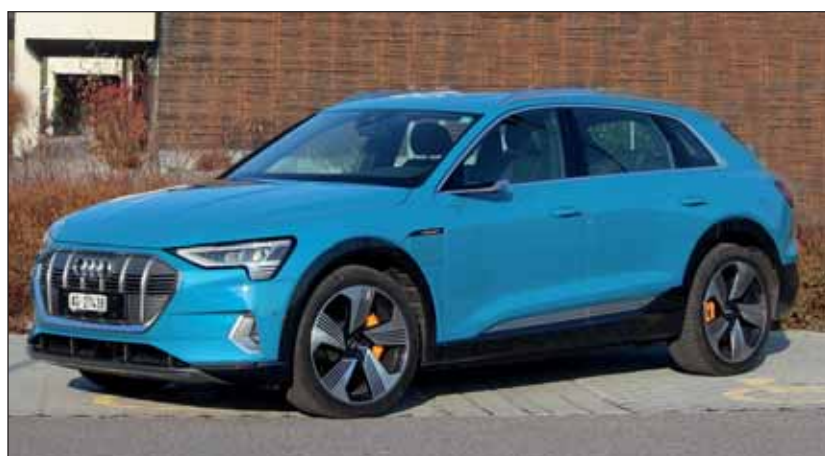
Weiterkommen: Der Audi e-tron strahlt wuchtige Eleganz aus. RHo