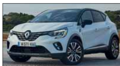
Redaktion: Roland Hofer

und dem 1.3 TCe (130 PS und 155 PS) sowie dem Blue CDI Turbodiesel (115 PS) wird um den E-Tech Plug-in Hybrid erweitert.