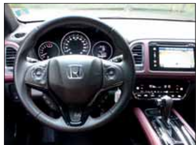
Gut ausgestattet: Die Turboversion des Honda HR-V wird sportlichem Anspruch gerecht.

Der Honda HR-V gefällt und jetzt hat er noch mehr Power. Das macht ihn zum munteren Spassmacher, der seine Technik nicht verstecken muss. Eine Testfahrt mit Biss.