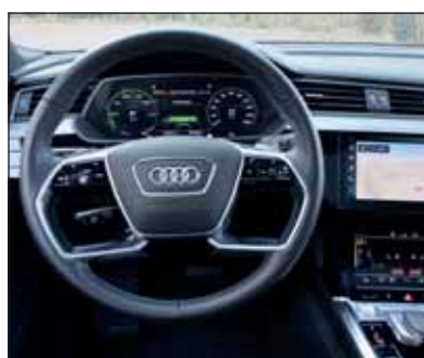
Audi e-tron: Viel Elektronik und eine digitale Welt eröffnen sich.

knapp sechs Sekunden auf 100 km/h beschleunigt. Der elektrische Allradantrieb sorgt für dynamisches Vorankommen auf verschiedensten Unterlagen. Unter Last ist permanent ein deutliches Summen zu vernehmen. Die serienmässige Luftfederung sorgt für Komfort, die Lenkung für zielgenaue Kurvenfahrt. Das Werk verspricht eine Reichweite von rund 400 Kilometern (nach WLTP). Dies war bei unserer Testfahrt allerdings nur etwa halb so viel. Nach Fahrten über 183 km waren es noch 104 km. Eine Nacht an der Haushaltsteckdose brachte wieder für 100 km Strom, 45 Minuten an der Schnellladesäule weitere 100 km. Leider war die Säule beim zweiten Anlauf bereits besetzt. Gut, dass die Rekuperation im Audi sehr gut funktioniert und die Reichweite unterwegs deutlich erhöht. RHo