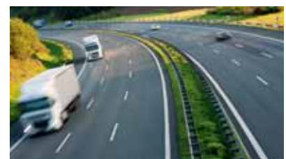
Ab Januar gibt es rund um das Thema Strassenverkehr einige Änderungen. Der AGVS schafft Klarheit.