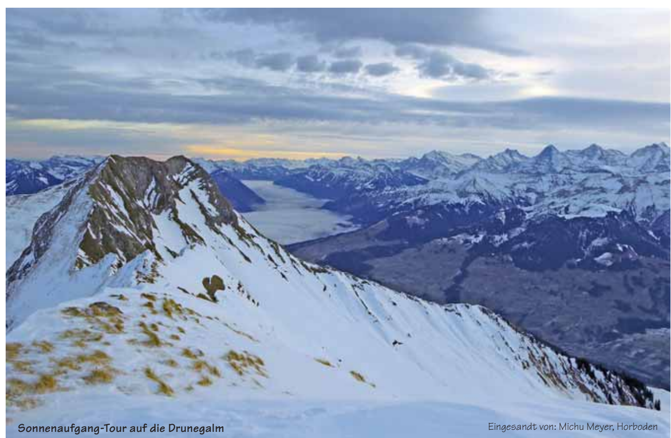
Sonnenaufgang-Tour auf die Drunegalm