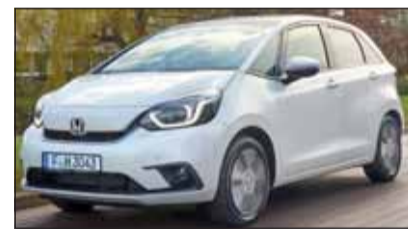
Honda Jazz E: Er ist komfortabel und eigenständig.

Honda Jazz E wie elektrisch Mit den flexibelsten Sitzen, die es im Kleinwagensektor gibt, wartet der neue Honda Jazz auf. Davon profitiert auch die Elektroverson. Der Stromer ist bestens für unsere Strassen vorbereitet, hat eine Reichweite, die für Pendel- oder Stadtfahrten immer ausreicht und verfügt über zahlreiche Sicherheitsassistenten.