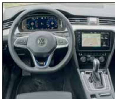
Weiterentwickelt: Das Passat-Innere mit hoher Verarbeitungsqualität.