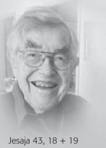
Jesaja 43, 18 + 19

Heute wurde mein geliebter Härzu, unser herzensguter Vätü, Grossvati und Schwiegervater