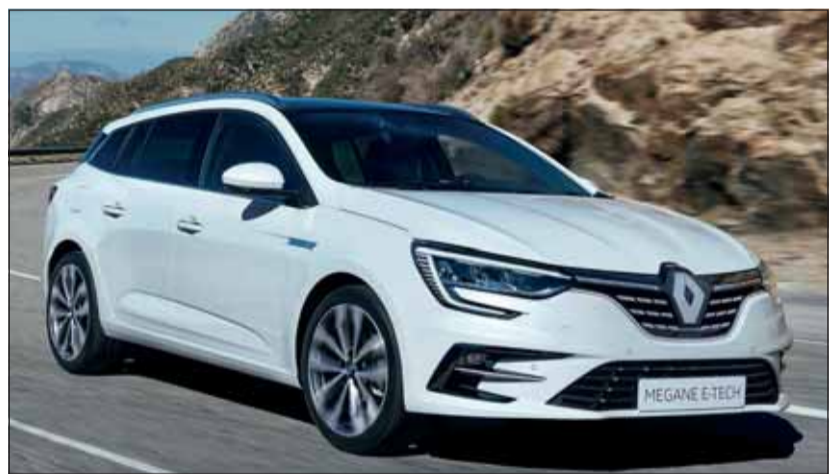
E-Tech Hybrid: Renault Megane Grandtour mit Elektro-Technik.

re von Renault einen fortschrittlichen und praktischen Hybridantrieb. Da ist einmal die neue Generation des 1,6 Liter Benzinmotors, der 118 Kilowatt (160 PS) leistet. Hinzu kommt ein Elektromotor mit 49 kW und ein Multi-Mode-Zahnradgetriebe mit Schaltmuffen. Die Koppelung des Elektromotors mit dem innovativen Getriebe ermöglicht optimierte, sanfte Schaltvorgänge sowie eine effektive Rekuperation. Die Architektur maximiert zudem den energetischen Wirkungsgrad. Die 9,8 kWh Batterie (400 V) im Megane E-Tech lässt das vollelektrische Fahren bis zu 135 km/h zu. Im gemischten Fahrbetrieb ist eine elektrische Reichweite von 50 km, im städtischen Verkehr (WLTP City) gar bis zu 65 km möglich. Der Fahrer kann zwischen optimiertem und sparsamem Betrieb oder sportlicher Gangart wählen. Den Megane Grandtour gibt es in fünf Ausstattungsversionen ab Fr. 40'200.-. Mit der gleichen Technik wird auch der Lifestyle-Renault Captur E-Tech ausgestattet, den es ab Fr. 38'100.- zu kaufen gibt.