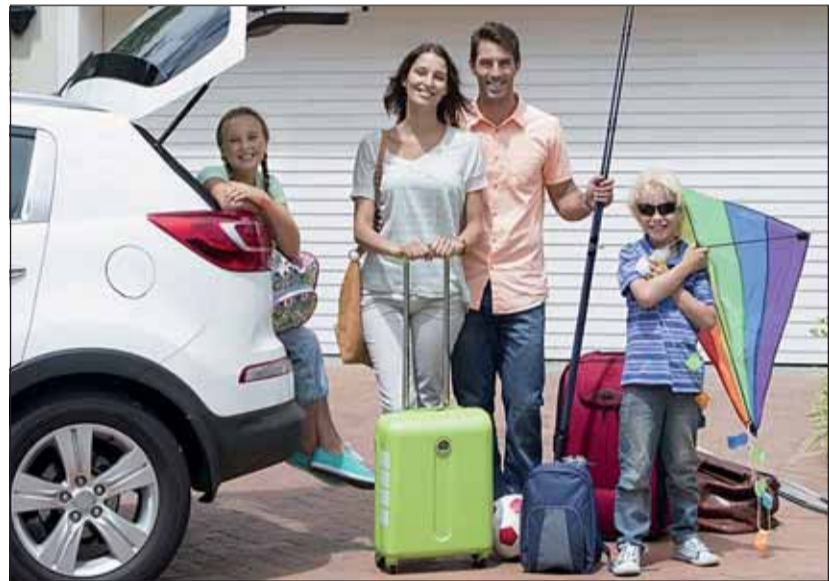
Wieder daheim: Aus den Autoferien in der Schweiz wohlbehalten zurück.

Kontrolle ist besser Wenn die Autoapotheke, das Pannendreieck, die Parkscheibe oder die Sicherheitswesten schon während längerer Zeit nicht mehr benötigt wurden, schadet es nicht, wenn diese rasch auf Vollständigkeit und Einsatzbereitschaft kontrolliert und da untergebracht werden, wo diese im Ernstfall auch gesucht werden. Gleiches gilt auch für das Reifenpannenset, das Abschleppseil und den Eiskratzer. RHo