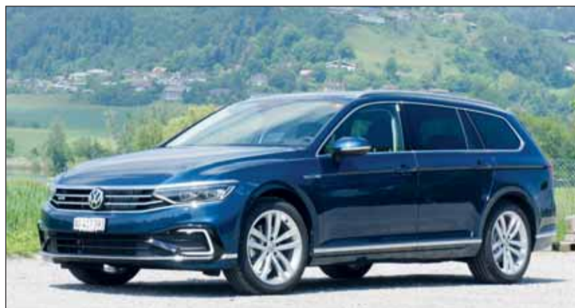
Macht als Kombi Sinn: Der Passat GTE ist bloss in einer Version zu haben