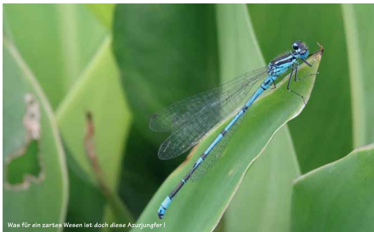
Was für ein zartes Wesen ist doch diese Azurjungfer!