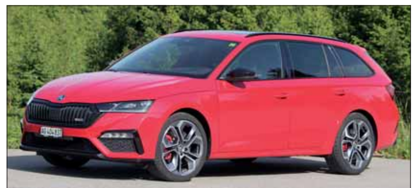
Sportlichkeit ist Trumpf: Beim Octavia RS ist alles aus einem Guss. RHO