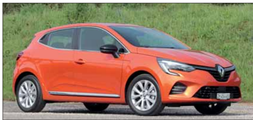
Über alle Berge: Der Clio Mildhybrid fährt auch ohne Strom weiter.

Clio in der Stadt weitgehend elektrisch unterwegs ist und dabei Benzin spart. Auch er rekuperiert in Gleitphasen Strom, so dass seine kleine Batterie immer wieder aufgeladen wird.