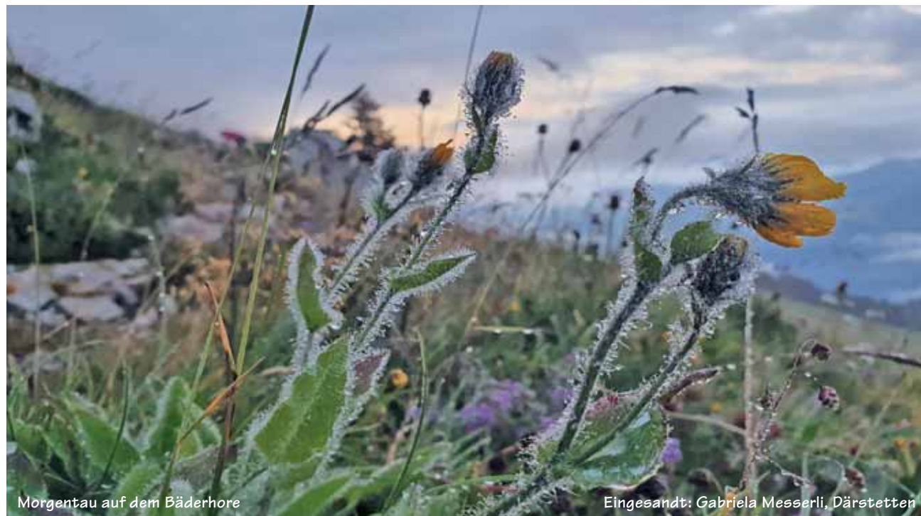
Morgentau auf dem Bäderhore