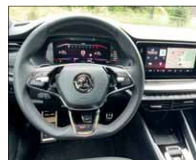
Digital aufgerüstet: Der Octavia RS bietet alles für eine sichere Fahrt.

Wer dem gleichstarken Octavia iV (Plug-in Hybrid) den Vorzug gibt, tut zwar etwa mehr für die Umwelt, aber der RS bietet fahraktiven Lenkern durch die vordere Differentialsperre und den ausgeprägten Sound mehr Sportlichkeit. So ist es eine wahre Freude, den Octavia RS über kurvenreiche Bergstrassen zu führen oder ihn zu fernen Reisezielen zu steuern. Er macht alles mit stoischer Ruhe und Überlegenheit und bleibt auch in Grenzsituationen gut beherrschbar. Wer für Anhängerbetrieb 4x4 wünscht, muss sich momentan mit der TDI-RS-Version begnügen. RHO