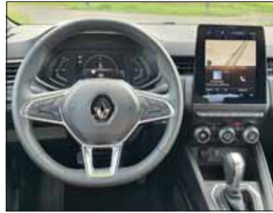
Tolles Ambiente: Im Renault Clio fühlen sich alle wohl.

etwas gleich gross sind, kann die Wahl entscheidend sein. In diesem Sommer prüfen wir den Clio E-Tech 140, der einen 42-Liter-Tank besitzt und bei einem Verbrauch von 4,3 l/100 km theoretisch über 900 Kilometer Reichweite hat. Der vollelektrische Zoe kommt – ebenfalls nach WLTP-Zyklus berechnet – gerade mal 395 km weit, dann muss er an die Ladestation. Unsere Erfahrungen zeigten, dass der