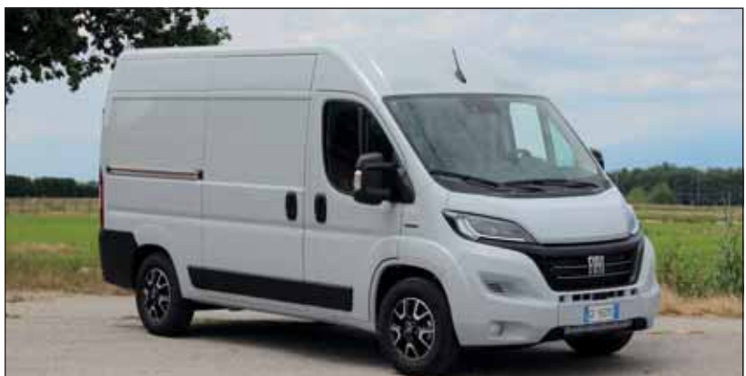
Für harte Arbeit: Der Fiat Ducato wurde auf Vordermann gebracht. RHO

Der bewährte 2,287 Liter grosse Turbodiesel Multijet 3 wird in den Ausführungen 120, 140, 160 und 180 angeboten. Wir prüften den Neuling in den Varianten 140 und 160 PS in Verbindung mit dem neuen Getriebeautomaten. Beide Kastenwagen waren mit 400 bis 500 Kilo Ladung beschwert, was authentische Eindrücke erlaubte. Kaum Unterschiede in den Fahrleistungen sind bis rund 60 km/h auszumachen, danach beschleunigt der 160 deutlich besser und ist daher ideal für alle, die auch mal längere Reisen unternehmen (Busversion). Die Version 140 dagegen ist sparsamer und kommt in der Agglomeration jederzeit mit. Der weit gespreizte Getriebeautomat schaltet recht fein und ist damit eine grosse Hilfe beim Go-and-Stopp wie auf der Autobahn, wo ihm zudem ein Seitenwindassistent eine stabile Fahrt sicherstellt. RHO