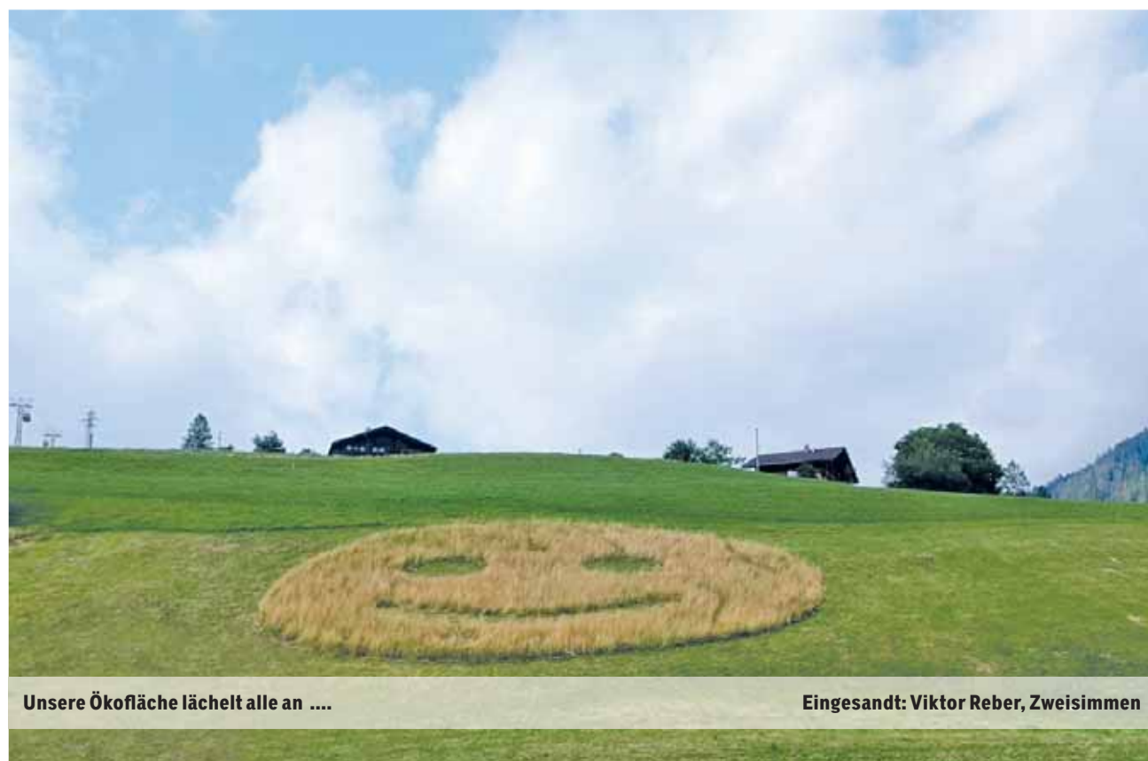
Unsere Ökofläche lächelt alle an ....