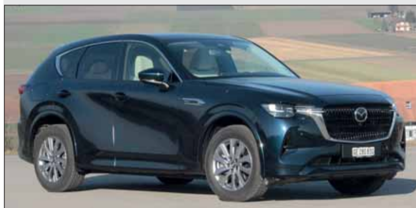
Flaggschiff: Der Mazda CX-60 zeigt Grösse und passt in die Schweiz.

Der 190-PS-Benziner ist für ein flottes Vorankommen absolut ausreichend. Sogar mit einem bis 2,5 Tonnen schweren Anhänger kommt er überall mit. Fahrersitz und Lenkrad lassen sich millimetergenau an die Wünsche des Lenkers anpassen, so dass entspanntes Fahren gegeben ist. Fehler werden von den Assistenten ausgezeichnet pariert. Ausgewogen verrichten Federung und Dämpfung ihre Arbeit. Der VW Tiguan Allspace hinterlässt einen fertigen und zuverlässigen Eindruck. Nur wer ihn fährt, erlebt die perfekten Systeme.