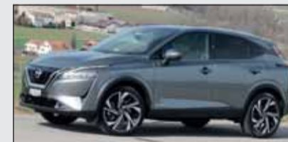
Nissan Qashqai mit Hybridantrieb.

Nissan gibt mächtig Gas, um die Fahrzeugflotte zu elektrifizieren. Der neue Qashqai macht als e-Power-Version viel Sinn. Denn er fährt elektrisch. Den Strom produziert ein Dreizylinder-Benziner. Der serielle Hybridantrieb wirkt durch zwei E-Motoren auf alle vier Räder.