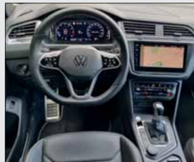
Klassisch gut: Der VW Tiguan Allspace ist klar überschaubar.

Auf der Antriebsseite gesellt sich ein neuer 48-Volt-Mildhybridmotor zur Palette. Neben den Benzinern und Dieselvarianten profitiert aber vor allem der e-2008 von Verbesserungen. Seine Leistung steigt um 15 auf 115 kW (156 PS) an. Die Batterie hat jetzt 54 Kilowattstunden (+4) Kapazität. In Verbindung mit einer gesteigerten Effizienz klettert die mögliche Reichweite auf über 400 Kilometer. Die Preisliste startet bei rund 42'000 Franken. Mit über 730'000 verkauften Exemplaren bleibt der Peugeot 2008 der Bestseller aus französischer Produktion.