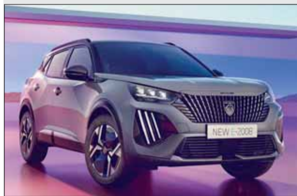
Aufgewertet: Peugeot hat die Modellreihe 2008 klar verjüngt.