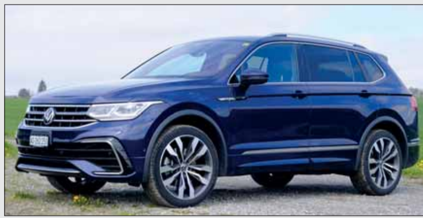
Geschärfte Optik: Der lange Tiguan überzeugt mit Charakter.