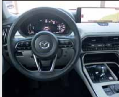
Feinkunst: Das Interieur besticht durch seine hellen Flächen.

Zwei Kraftquellen; 65 km elektrisch Der CX-60 ist der erste Hybrid-Mazda mit Stecker. Der 2,5 Liter grosse Saugbenziner bietet eine Leistung von 327 PS und 500 Newtonmeter Drehmoment. Dies ist im täglichen Einsatz völlig aus-