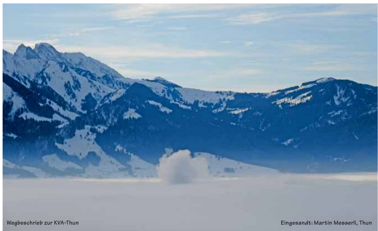
Wegbeschreibung zur KVA-Thun