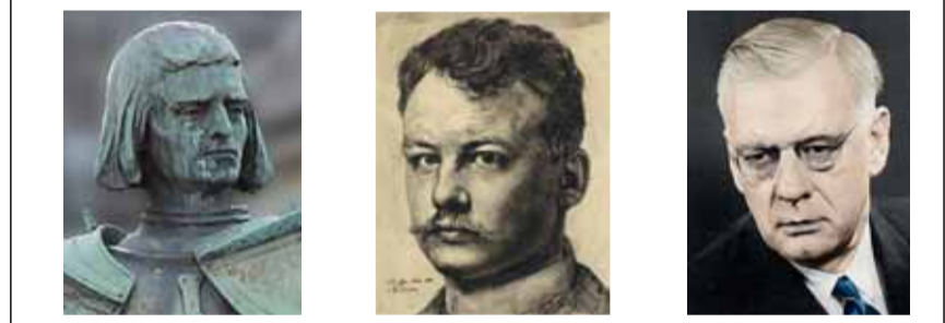
Adrian von Bubenberg (um 1434-1479) Der Held von Murten Karl Stauffer-Bern (1857-1891) Genie und Tragik Markus Feldmann (1897-1958) Gegen braune und rote Fäuste