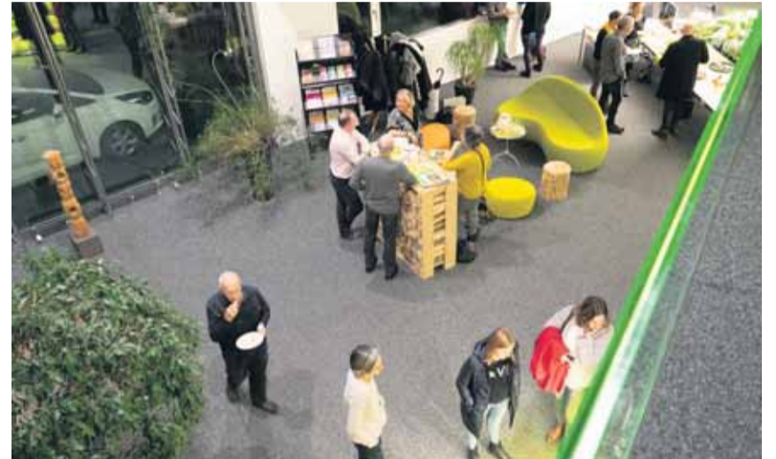
Die Buchvernissage fand im Foyer der Druckerei Ilg in Wimmis statt.