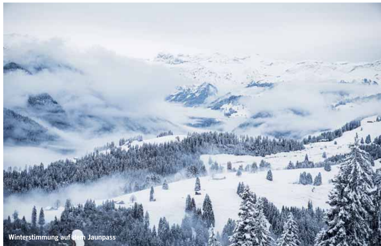
Winterstimmung auf dem Jaunpass

Senden Sie uns ein schönes, originelles oder lustiges Bild und wir belohnen Sie mit einem Einkaufsgutschein von Coop im Wert von Fr. 30.00. Senden Sie das Bild in genügender Auflösung an anzeiger@ilg.ch oder Simmentaler Anzeiger, Herrenmattstr. 37, 3752 Wimmis.