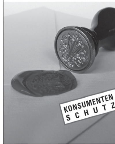
Ein Testament verfassen

Ein kleiner Ratgeber zum Verfassen eines gültigen Testaments.