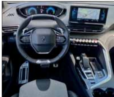
Typisch Peugeot: Armaturen über dem Lenkrad und Funktionstasten.

korverlauf des Grills dominiert. Das macht ihn breiter als er ist. Innen ist das Platzangebot überraschend gross. Wie bei Peugeot üblich liegend in den Anzeigen über dem kleinen Lenkrad, was ein Head-up-Displays erübrigt. Viele Stauräume helfen Ordnung halten. Die Sicherheit wird von zahlreichen Assistenten überwacht, der Komfort durch den Einsatz einer logischen Infotainment-Strategie sowie hoher Wohnlichkeit dominiert. Die Platzverhältnisse und Komfort sind überdurchschnittlich.