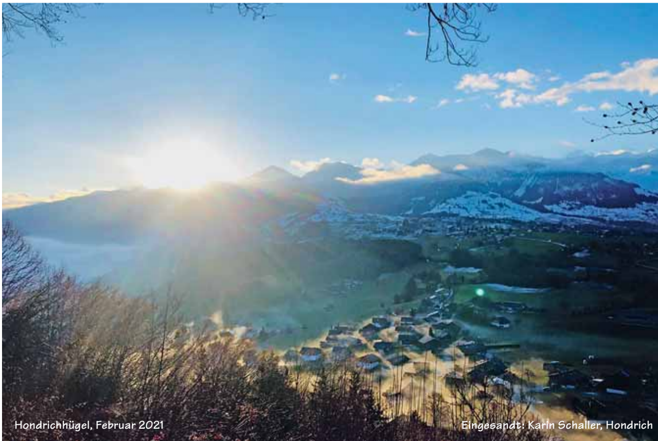
Hondrichhügel, Februar 2021