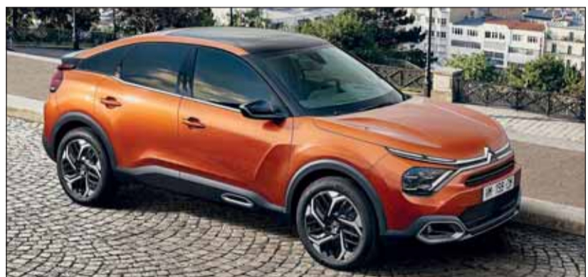
Alles im Fluss: Die Optik des neuen Citroën C4 vereint viele Stile.

den guten Erfahrungen, die Opel und Peugeot bereits gemacht haben. Zügig ging es den 6 km langen Stollen bergan. Am Ziel verkündete Lorenzo, wir hätten jetzt rund 600 Höhenmeter hinter uns und seien beim Grimselwerk 2 angekommen. Die Rückfahrt erfolgte auf gleichem Weg, da auf der Grimsel noch meterhoch Schnee lag. Ein Halt unterwegs führt zur Kristallgrotte im Granit, die Besuchern gerne gezeigt wird. Die guten Eigenschaften des ë-C4 bleiben gespeichert.