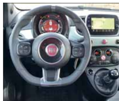
Gefällig: Im Cinquecento Hybrid fehlt es an nichts.