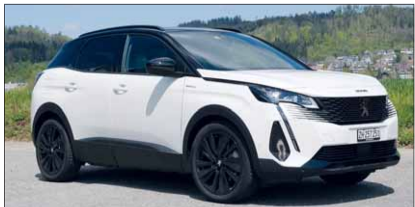
Bicolor: Der Peugeot wirkt als SUV gröber als er in Wirklichkeit ist.