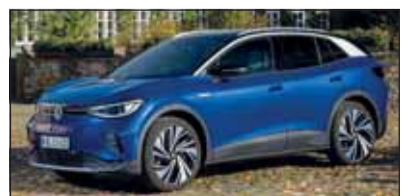
VW ID.4: Die neue Grösse von VW für alle die elektrisch mögen.

Auf der gleichen Plattform wie der Skoda Enyaq, basiert auch der VW ID.4. Dieser ist etwas grösser als der Erstling ID.3, hat auch etwas mehr Leistung und eine grössere Reichweite. Die Digitalisierung ist auch hier wahrscheinlich weit fortgeschritten und entsprechend gewöhnungsbedürftig. Der ID.4 startet in der Schweiz in diesen Tagen.