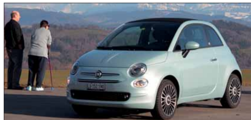
Liebling: Auch mit Hybridtechnik bleibt der Cinquecento ein Idol.