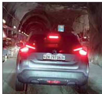
Der ë-C4 im KWO-Stollen: Tief im Berg fühlt sich das E-Auto wohl.

Die interessanteste Variante der neuen Generation ist sicher der ë-C4 mit 100 kW Motor. Dabei profitiert die Elektroversion von