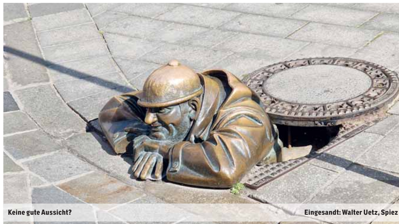
Keine gute Aussicht?