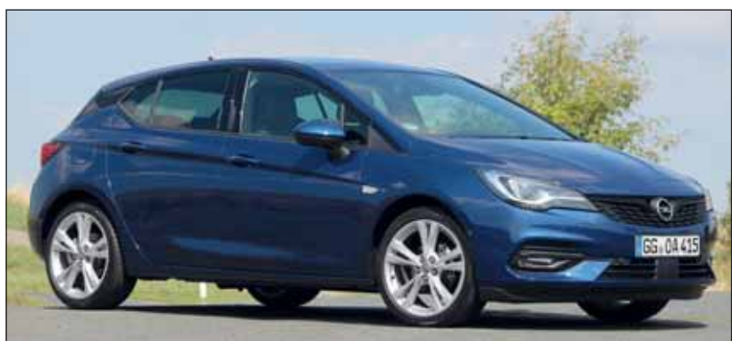
Neuer Schwung: Der Opel Astra wurde kräftig verjüngt und besser. RHo

Sparsame Dreizylindermotoren Die drei effizienten 1,2-Liter Turbobenziner, ein 1.4-Turbobenziner und zwei 1,5-Liter Turbodiesel (110 bis 145 PS) wurden völlig neu entwickelt. Sie setzen neue Massstäbe bei den Abgaswerten, indem fünf von sieben Leistungsstufen weniger als 100 Gramm CO 2 emittieren. Das ist für eine Modellpalette der Kompaktklasse ein absoluter Spitzenwert. Davon merkt allerdings der Fahrer wenig, denn die Motoren wirken unterwegs agil und spontan. Sie werden von 6-Gang-Schaltgetrieben, stufenlosen CVT-Kraftübertragungen oder neunstufigen Automatikgetrieben unterstützt. Die Preisliste beginnt bei Fr. 23'850.- für den Viertürer und Fr. 24'850.- für den Kombi Sports Tourer. RHo