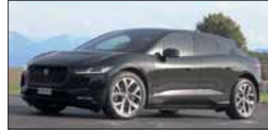
Jaguar I-Pace: Die Elektro-Wildkatze ist ein wunderbares Auto.

Lautlos, stark, schnell: Jaguar I-Pace Der erste vollelektrische Jaguar schlägt wie eine Bombe ein. Wer ihn sieht und wer ihn fährt ist begeistert. Vom Leistungsvermögen, der luxuriösen Eleganz und dem Platzangebot. 100 PS gibt es für jedes Rad. Eine Beschleunigung unter 5 Sekunden auf 100 km/h und über 400 km Reichweite zeichnen ihn aus. 85'600 Franken die sich für die Umwelt lohnen.