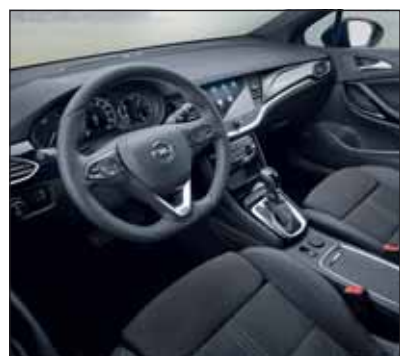
Edel und vollständig: Der Opel Astra orientiert sich nun auch innen an den grossen Modellen.

Aus der Modellpflege geht der Opel Astra deutlich geschärft hervor. Der bereits bestellbare Neuling profitiert allerdings nicht bloss von der optischen Verjüngung, sondern auch durch die technischen Neuerungen. Neu ist beispielsweise die konsequente Trennung der Ausstattungsvarianten in eine Linie ohne (siehe Bild)