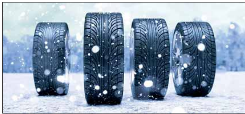
Wenn die Flocken tanzen: Winterreifen haben Vorteile bei Nässe und Kälte.

und Transporter) testete der TCS 15 Modelle. Nur drei Produkte schnitten mit der Endbewertung «empfehlenswert» ab. Erfreulicherweise sind die Eigenschaften der Winterreifen auf nasser Fahrbahn im Vergleich zum Sommerreifentest insgesamt besser, verschleissen aber deutlich schneller.