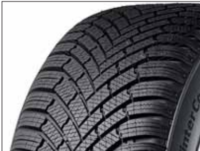
Profil und Gummimischung des Continental Wintercontact TS 850 sind empfehlenswert.

schleiss bewähren. Dabei zeigt sich deutlich, dass bekannte Reifenmarken immer die Nase vorn haben. In der Reifendimension 185/65 R15 88T (meistverkaufte Dimension für Kleinwagen) testete der TCS 16 Reifenmodelle. Dabei schnitten drei Reifen mit der Bestnote «sehr empfehlenswert», zehn Modelle mit «empfehlenswert», ein Reifen mit «bedingt empfehlenswert» und zwei mit «nicht empfehlenswert» ab. In der Reifendimension 205/65 R16C 107/105T (geeignet für Vans