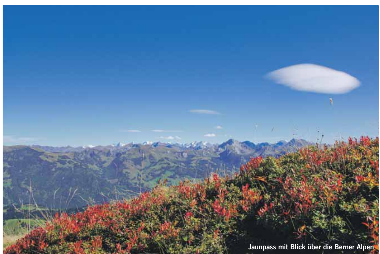
Jaunpass mit Blick über die Berner Alpen

Jedes publizierte Bild wird mit einem Einkaufsgutschein von Coop im Wert von Fr. 30.00 belohnt. Senden Sie Ihr Bild in genügender Auflösung an anzeiger@ilg.ch oder Simmentaler Anzeiger, Herrenmattestr. 37, 3752 Wimmis. Bitte mit Absender und kurzer Legende. Es wird keine Korrespondenz geführt.