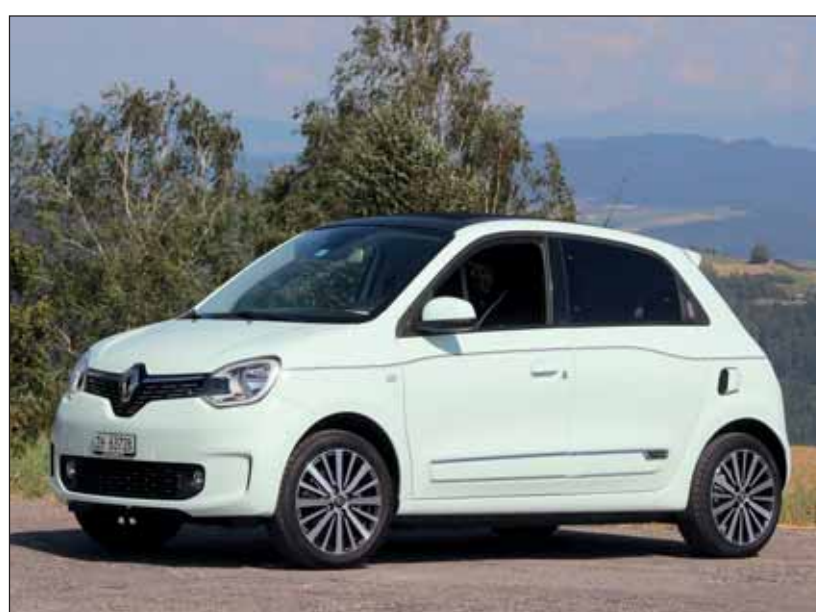
Mehrwert: Der überarbeitete Twingo wartet mit starken Details auf. RHo