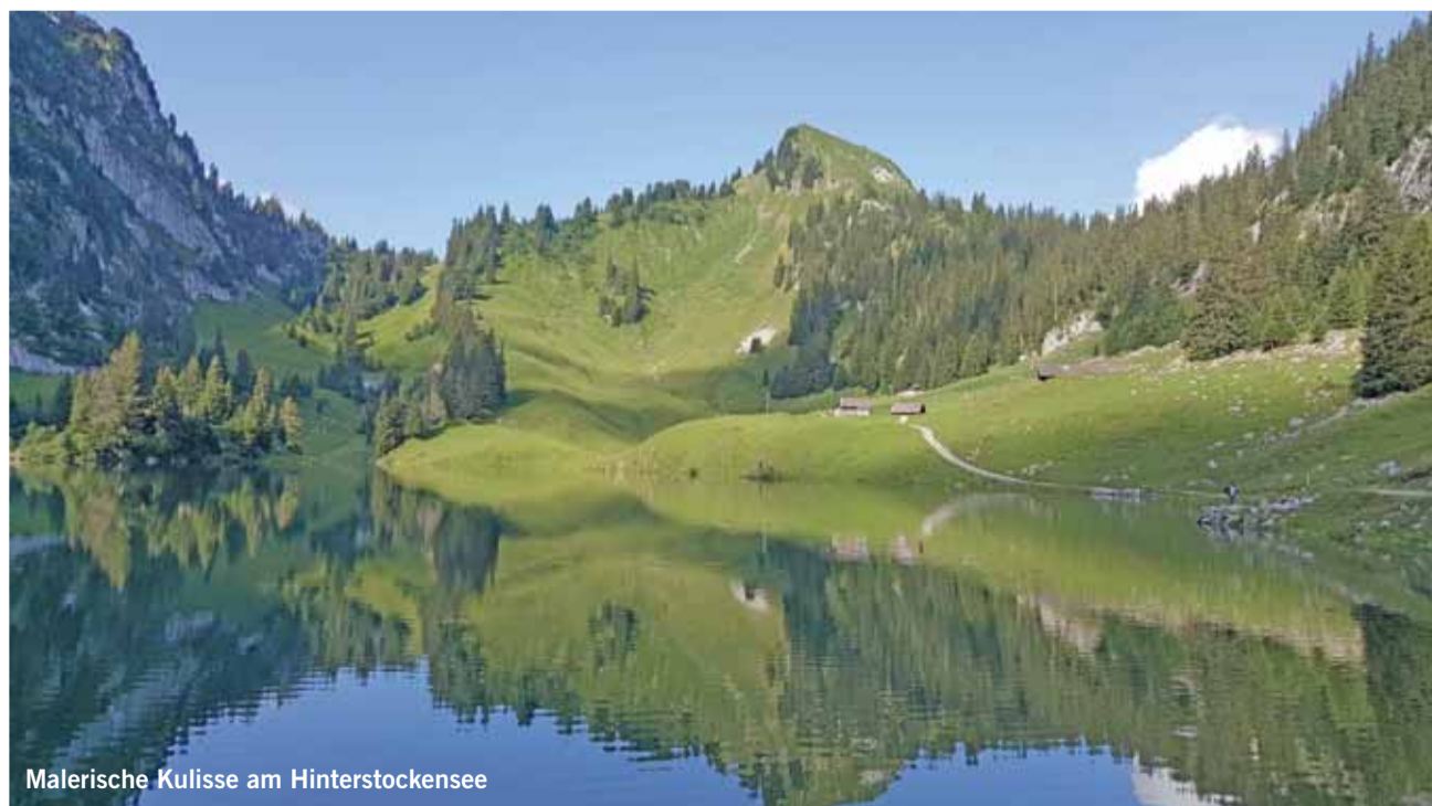
Malerische Kulisse am Hinterstockensee