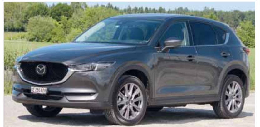
Top-Klasse: Der Mazda CX-5 trifft den Geschmack haargenau.

Fahrbericht: Mazda CX-5 184 AWD Revolution