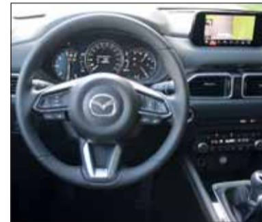
Alles da: Der Mazda CX-5 ist reichhaltig ausgestattet und gut gebaut.

Modell: Mazda CX-5 S-D 184 AWD Karosserie: 5 Türen / 5 Plätze Masse mm: L: 455 B: 184 H: 168 Motor: 4-Zyl., 2191 cm 3 , Turbo-D Leistung: 135 kW/184 PS, 4000/min Drehmoment: 445 Nm ab 2000/min Antrieb: 6-Gang man. / Allrad Spitze: 211 km/h, 0-100 9,3 s. Verbrauch: 7,4 l/100 km, CO 2 137 g/km Preis ab: Fr. 46'000.-, TW: 48'279.- Infos: www.mazda.ch