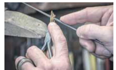
Hände: Sie sind das Werkzeug des Goldschmieds schlechthin. Individualität ist immer Handarbeit.