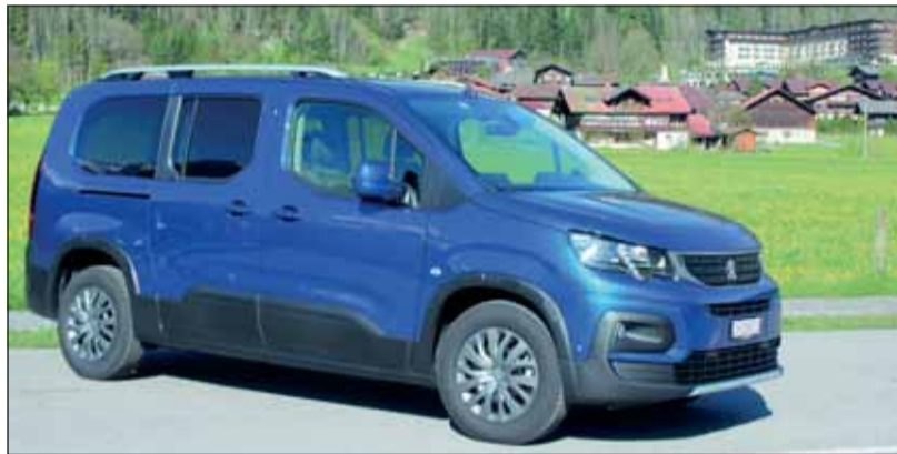
Für Lifestyle-Familien: Peugeot Rifter mit langem Radstand.

Als besonders genügsam erwies sich der 1,5 Liter grosse Turbodiesel mit 102 PS und Start-Stopp-System. Er war mit einem leichten 5-Ganggetriebe verblockt, das ebenfalls haushälterisch mit der Energie (4,4 l/100 km) umgeht und eine Spitzengeschwindigkeit von 165 km/h zulässt. Mit zunehmender Beladung wächst im Rifter der Komfort. Die grossen Reifen fördern eine präzise Kurvenfahrt sowie stabile Bremsmanöver. Mobile Familien finden im Peugeot Rifter genau das vor, was sie für Reisen, Freizeit und Spass alles dabeihaben wollen. Es gibt also allerhand viel Auto ab Fr. 32'320.-.