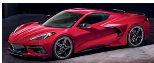
Chevrolet Corvette mit Mittelmotor.

Der US-Sportler Corvette Stingray erscheint 2020 in völlig neuem Layout. Der V8-Motor mit 495 PS liegt nun hinter den Sitzen, es handelt sich um eine Mittelmotorkonstruktion. Er ist mit einem 8-Gang-Doppelkupplungsgetriebe verblockt. Fahrstabilität, Beschleunigung und Verhalten auf der Strasse erreichen ein völlig neues Niveau.