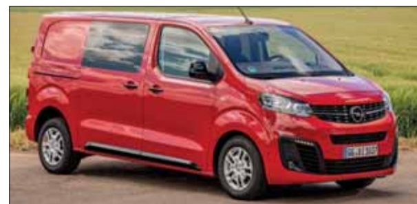
Nutzfahrzeug: Der neue Opel Vivaro kommt in zahlreichen Varianten.