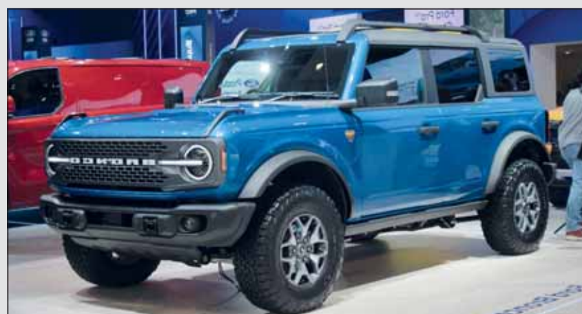
Ford Bronco: Eckig, praktisch und sehr geändegängig.

Nach vielen Jahren der Abwesenheit kommt der Name Bronco bei Ford zurück. Der Neuling orientiert sich optisch an den rustikalen Vorgängern, ist jedoch mit modernster Technik und Infotainment bestückt. Ob mit 273 oder 314 PS, er besitzt immer einen Benzinmotor und eine 10-Gang-Automatik ist zu haben. Im Gelände ist er eine Wucht.