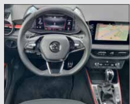
Rotes Dekor: Sportliches Rot zeichnet den Monte Carlo aus.