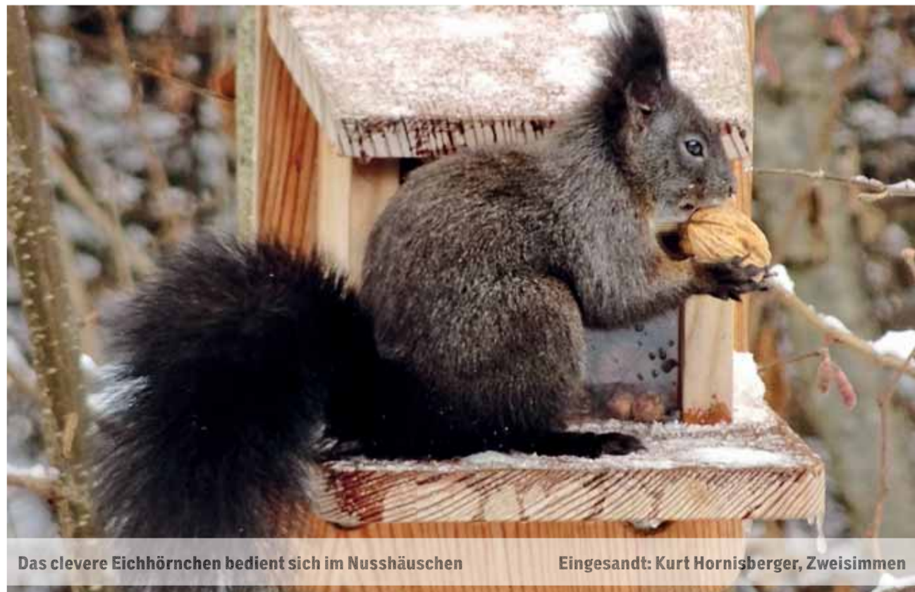
Das clevere Eichhörnchen bedient sich im Nusshäuschen