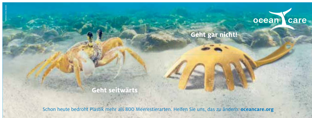
Schon heute bedroht Plastik mehr als 800 Meerestierarten. Helfen Sie uns, das zu ändern. oceancare.org