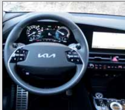
Bedienungsfreundlich und familiär: das Cockpit im Kia Niro EV.

Der permanent erregte Synchronmotor leistet im Niro 150 kW (204 PS) und liefert 255 Newtonmeter Drehmoment ab.