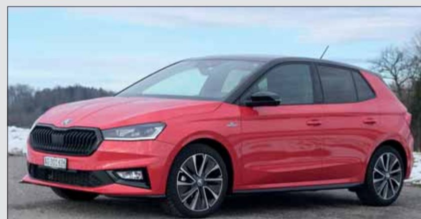
Sportlicher Lifestyle: Der Skoda Fabia weckt sportliche Rallyegelüste. cj