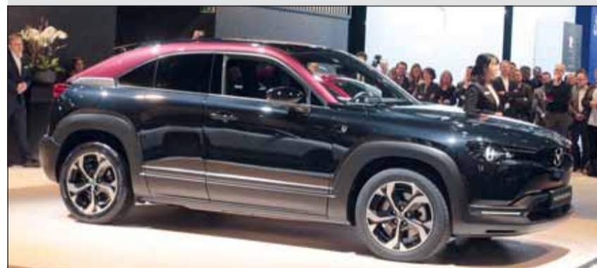
Elektro mit Range-Extender: Eine echte Mazda-Lösung, der MX-30 R. RHO

Idealerweise wird der Mazda MX-30 R-EV wie ein nachladbarer Hybrid gefahren, das heisst, bei jeder sich bietenden Gelegenheit wird das Ladekabel angeschlossen. In diesem Modus benötigt die Wankelmotor bloss rund einen Liter Benzin auf 100 Kilometer. Wird dagegen nur der aus der Batterie verfügbare Strom genutzt, ist der Akku nach rund 80 Kilometern leer, haben die Wankelscheiben alle Hände voll zu tun, um Strom zu produzieren. Die Folge ist ein wesentlich höherer Verbrauch. Für den Mazda MX-30 R-EV werden 42'000 Franken verlangt, das ist nur wenig mehr als für den reinen Elektriker. Entsprechend dürften die Absatzzahlen für das originelle Familienauto deutlich zum Bestseller machen.