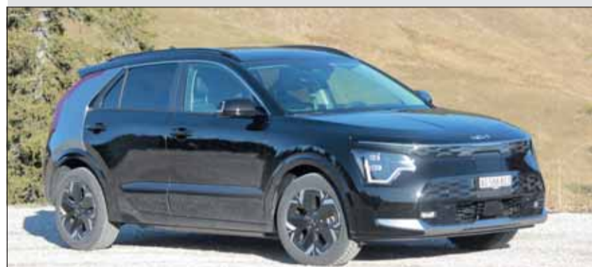
Völlig neuer Auftritt: Der Kia Niro ist kaum mehr wiederzuerkennen. RHO

Ein Drehschalter bestimmt die Fahrtrichtung und los geht es. Lautlos bewegt sich der Niro in der Stadt, aber auch auf der Autobahn dringen nur gedämpfte Geräusche zu den Insassen. Besonders geschätzt wurde der adaptive Tempomat, der sich leider auf Grund von schlechten Bedingungen häufig selbst ausser Betrieb nahm. Die vielfältigen Sitz- und Lenkradeinstellungen garantieren auch ermüdungsfreie Reisen an weiter entfernte Ladestationen. Insgesamt ein gutes Preis-Leistungsverhältnis ab bescheidenen 44'650 Franken.