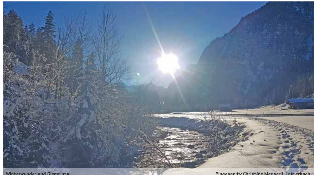
Winterwunderland Diemtigtal Eingesandt: Christine Messerli, Latterbach

Senden Sie uns ein schönes, originelles oder lustiges Bild und wir belohnen Sie mit einem Einkaufsgutschein von Coop im Wert von Fr. 30.–. Senden Sie das Bild in genügender Auflösung an anzeiger@ilg.ch oder Simmentaler Anzeiger, Herrenmattstr. 37, 3752 Wimmis. Bitte mit Absender und kurzer Legende. Es wird keine Korrespondenz geführt.