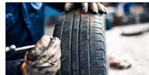
Spätestens nach acht Jahren oder bei zu geringer Profiltiefe müssen die Reifen ersetzt werden. Die AGVS-Garagisten verfügen über das notwendige Know-How und Werkzeug.

optimale Bedingungen und teilen bereits vor der Einlagerung mit, ob das Profil für die kommende Saison ausreichend ist. Zu guter Letzt gilt es zu beachten, dass die Entsorgung ausgedienter Reifen in die Hände von Profis gehört. Bilder von irgendwo im Freien deponierten Reifen zeugen davon, dass dieses Bewusstsein leider nicht immer vorhanden ist.