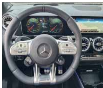
Perfekt gemacht: Die Armaturen versprechen Sport und Raffinesse.