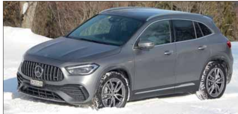
Sportlich: Die höchste Stufe des Mercedes-Benz GLA heisst AMG 35. RHO