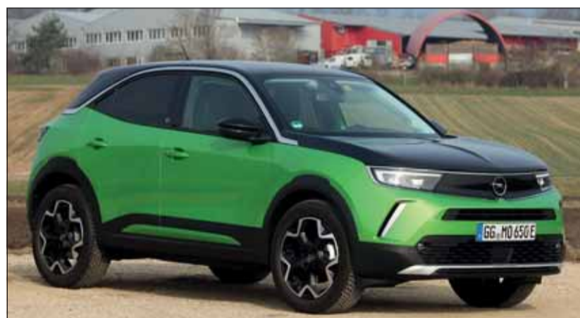
Moderner Crossover: Der Opel Mokka hat sich toll herausgeputzt. RHO

Mit dem Erscheinen des Mokka wird bei Opel eine neue Ära eingeläutet. Die Plattform ist so aufgebaut, dass sie Batterien für den Elektroantrieb ebenso aufnehmen kann, wie thermische Triebwerke. Ein 1,2-l-Turbobenziner mit 74 oder 96 kW, ein Diesel mit 81 kW sowie eine Elektroversion mit 100 kW sind wählbar. 6-Ganggetriebe oder Automaten sind an die Motorisierung gebunden. Dynamisch und ausgewogen abgefedert rollt der Mokka über alle Strassen. Dabei ist die Elektroversion klar die agilste, dazu leise und unterwegs absolut emissionsfrei. Vier Ausstattungsvarianten und mehrere Personalisierungspakete lassen keine Wünsche offen. Die Preise liegen zwischen 24'490.- und 44'200.- Franken, wobei allein die Batterien im Mokka-e mit rund 10'000 Franken zu Buche stehen. Dieser liegt jedoch voll im Trend und ist daher sehr zukunftsstrahend. Modernste Crossover-Interpretation. RHO