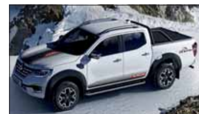
In Blanc Glace kommt der Alaskan ICE besonders zur Geltung.

Sonderserie: Renault Alaskan Renault bietet den Pick-up Alaskan ab sofort in der limitierten Sonderserie ICE-Edition an. Als Basis dient der Alaskan Intens mit Doppelkabine, Twin-Turbo dCi 190, 4x4 und 7-Stufen-Automat. Die ersten Alaskan ICE-Edition sind soeben in der Schweiz eingetroffen. Preis der Sonderserie: ab Fr. 57'135.-. Mit vielen Extras und Designelementen.