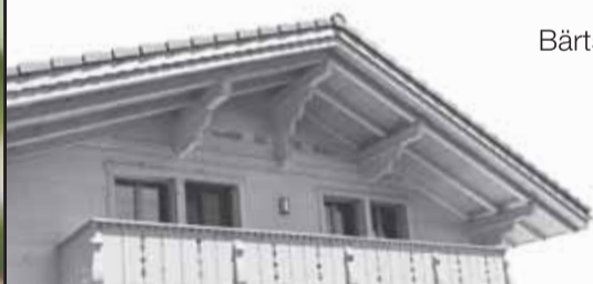
Bärtschi Bau AG, Frutigen