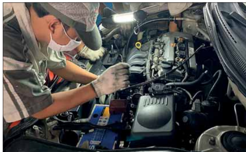
Braucht es immer: Versierte Fachleute, die Autos warten und pflegen. net

Jugendliche der beruflichen Grundausbildungen «Automobil-Fachmann/-frau» und «Automobil-Mechatroniker/-in» mit der Fachrichtung Nutzfahrzeuge dürfen neuerdings bereits vor ihrem 18. Geburtstag an die Fahrprüfung. Damit wird sichergestellt, dass alle noch während der Ausbildung auch Probefahrten ausführen dürfen.