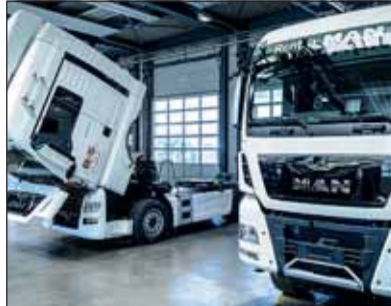
Nutzfahrzeuge bieten eine faszinierende Technik auf hohem Niveau.

entwickelt, so verändern sich auch die Berufe in der Automobilbranche. Sie sind abwechslungsreicher, anspruchsvoller und spannender geworden. Das Spektrum an Autoberufen ist heute breiter und vielfältiger denn je. Gefragt sind neben handwerklichem Geschick, einer schnellen Auffassungsgabe und einer gesunden Portion Menschenverstand auch vernetztes Denken, Teamfähigkeit und